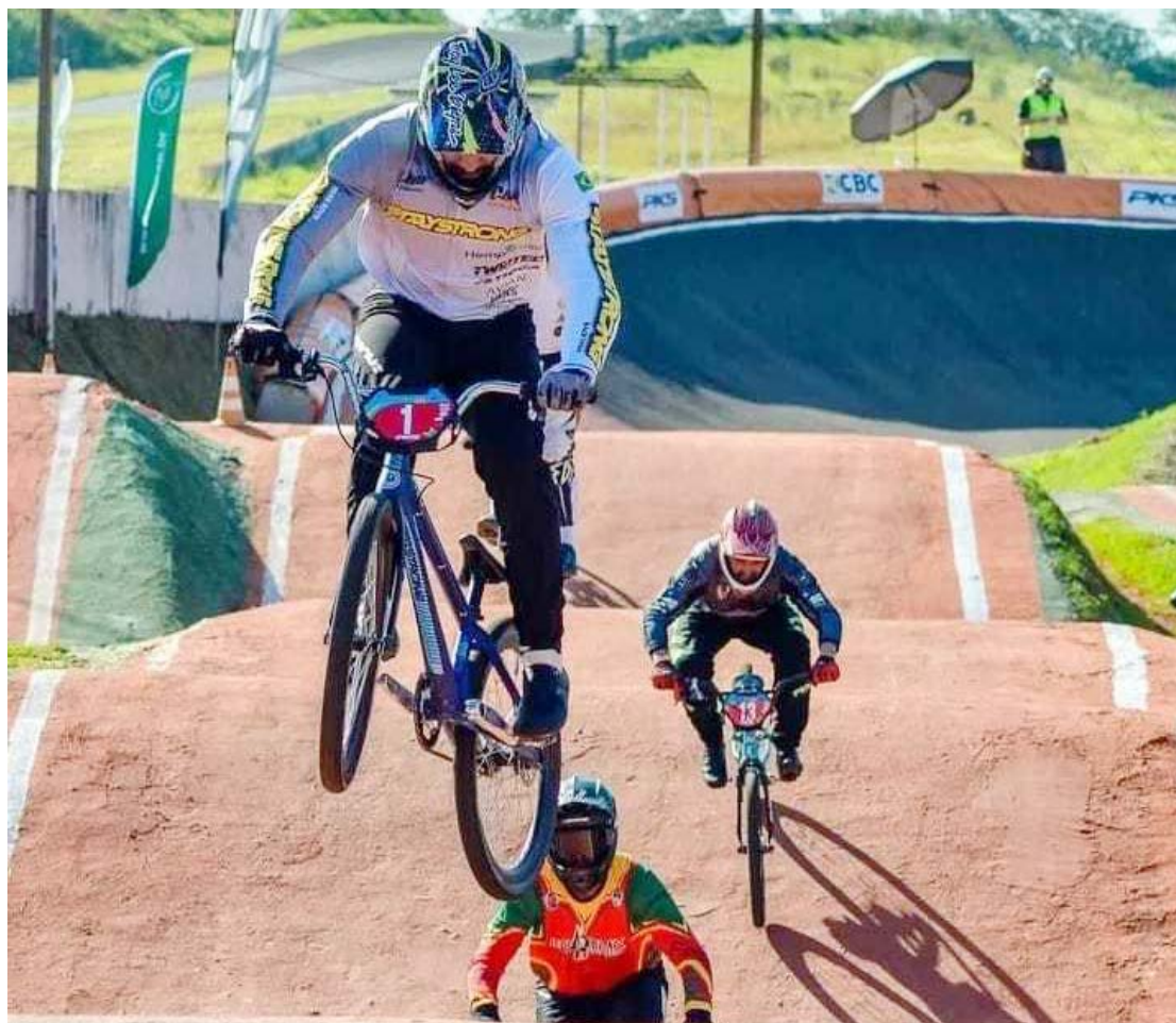
A competição aconteceu no último final de semana em Curitiba

Os atletas e dirigentes do Bicicross de Goioerê agradecem o apoio que tem recebido da Secretaria de Esportes permitindo que os atletas representem o município em competições de alto nível.