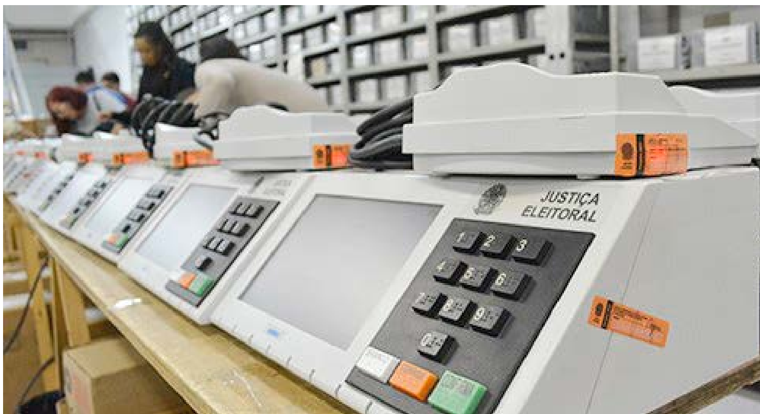
A geração de mídias acontecem ontem e nesta quarta-feira será a vez da lacração das urnas

Coluna publicada simultaneamente em 22 jornais e portais associados. Saiba mais em www.adipr.com.br