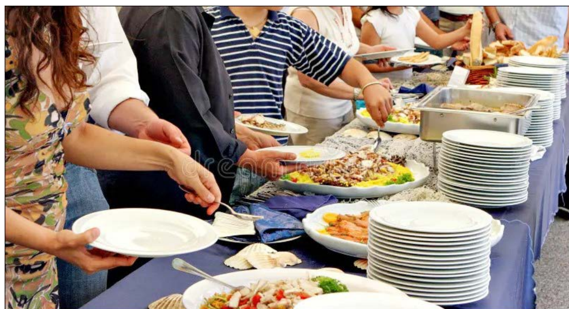
O evento está agendado para acontecer no próximo dia 29 deste mês

No cardápio constam costela grelhada, linguiça grelhada, arroz, maionese, farofa e salada. "Nós estamos animados e acreditando que teremos uma grande festa, com a participação dos empresários, colaboradores e toda a família do