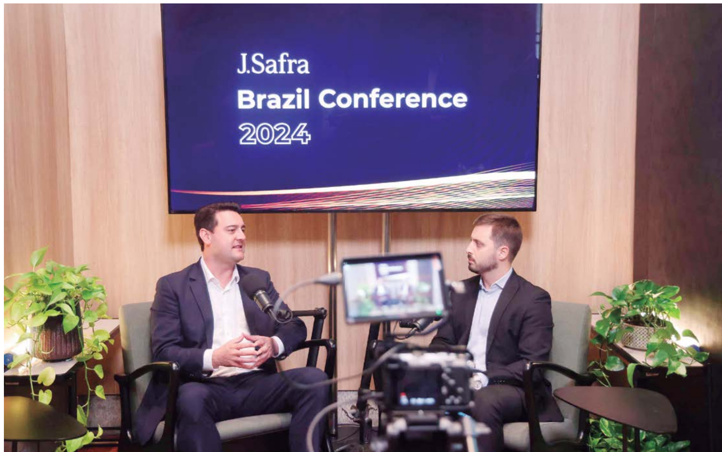
O governador participou nesta terça-feira (24), em São Paulo, do J.Safra Brazil Conference 2024, evento promovido pelo Banco Safra e que reúne investidores e lideranças públicas para debater o cenário econômico e oportunidades de investimentos.

Nos últimos cinco anos, o Paraná realizou importantes privatizações, como a da Sercomtel, empresa de telefonia com sede em Londrina, e Copel Telecom, subsidiária da Copel na área de internet e fibra óptica; a concessão do Parque Estadual de Vila Velha, em Ponta Grossa; a transformação da Copel em corporação; e mais recentemente PPPs da Sanepar