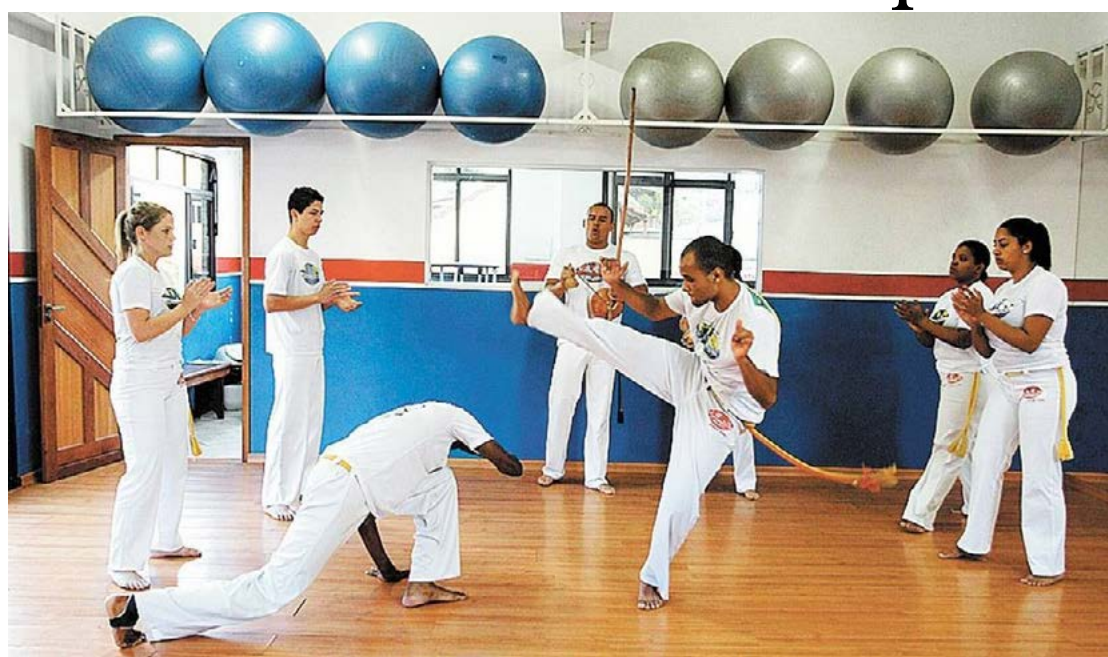
O projeto estará em Goioerê na próxima quinta-feira

O evento será gratuito e os interessados em participar poderá fazer suas inscrições através do link: https://forms.gle/5Vodk3Nt6qo5UYLHA “Esse projeto é uma oportu-