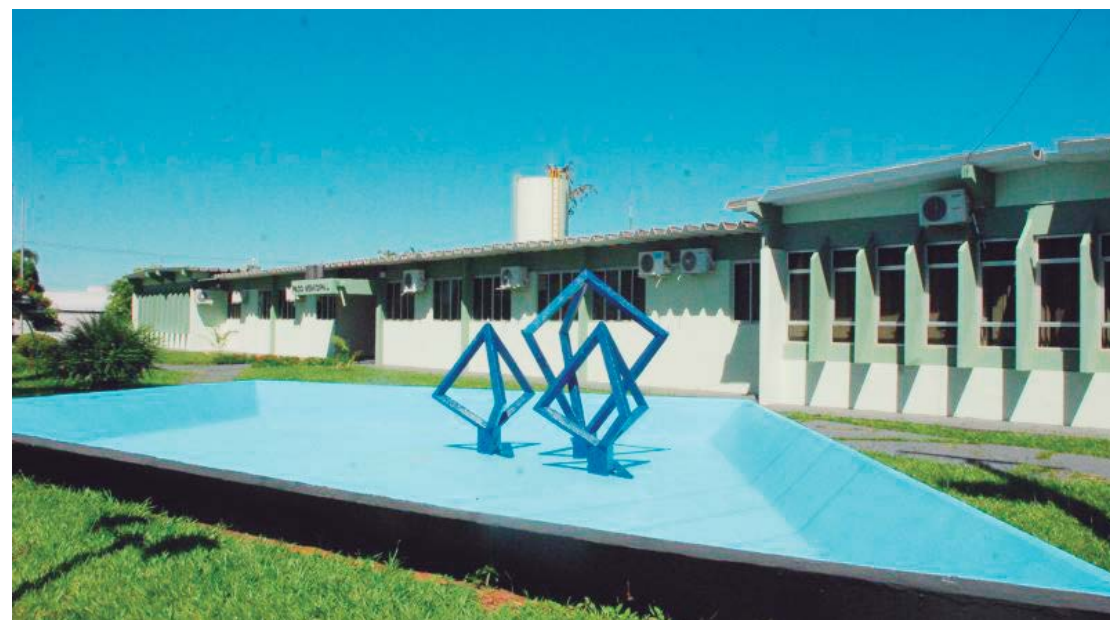
Audiência pública foi agenda para esta quinta-feira, dia 26

A audiência será das mais importantes, uma vez que é esta lei que estabelece as metas e prioridades