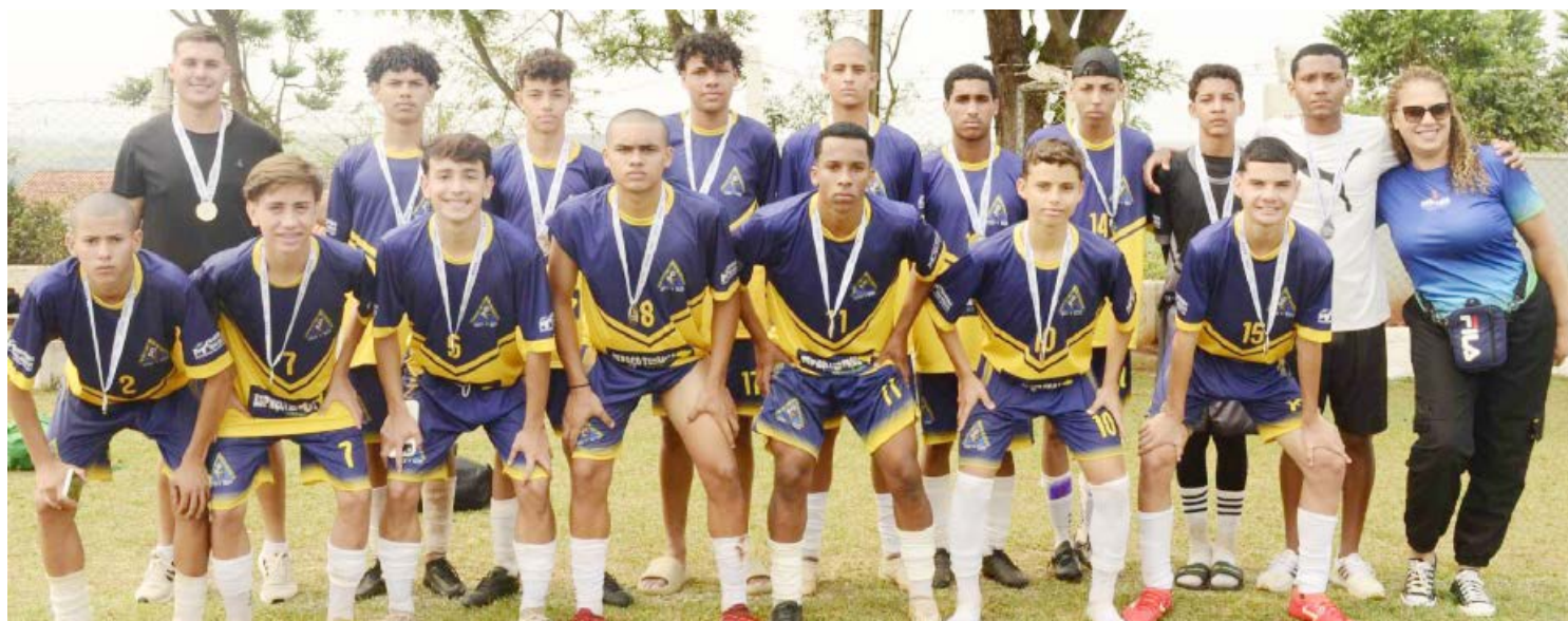
As equipes classificadas e que estarão representando Goioerê nos JEP's Bom de Bola

Goioerê será representada pelas equipes do Colégio Estadual Antonio Lacerda – Premen II – que garantiram vaga competindo nas categorias 12 a