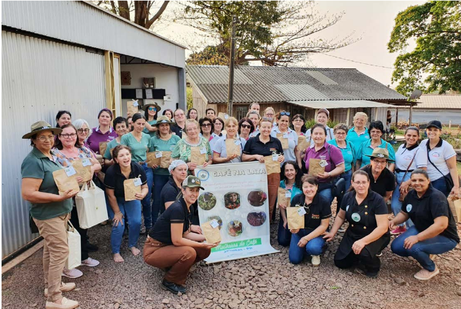
Na atividade, as mulheres visitaram à sede do Projeto Mulheres do Café, em Jesuítas, e puderam conhecer todas as etapas de produção do Café na Lata.