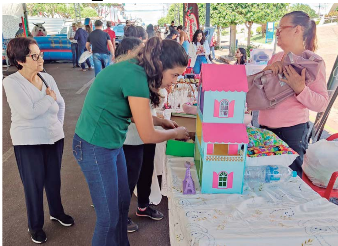
Esta será a terceira edição do evento, que este ano acontecerá de 12 a 14 de setembro

poderão desfrutar de pratos deliciosos na praça de alimentação, destacando o melhor da