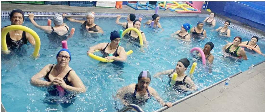
Em Goioerê, a hidroginástica é uma prática diária entre os idosos