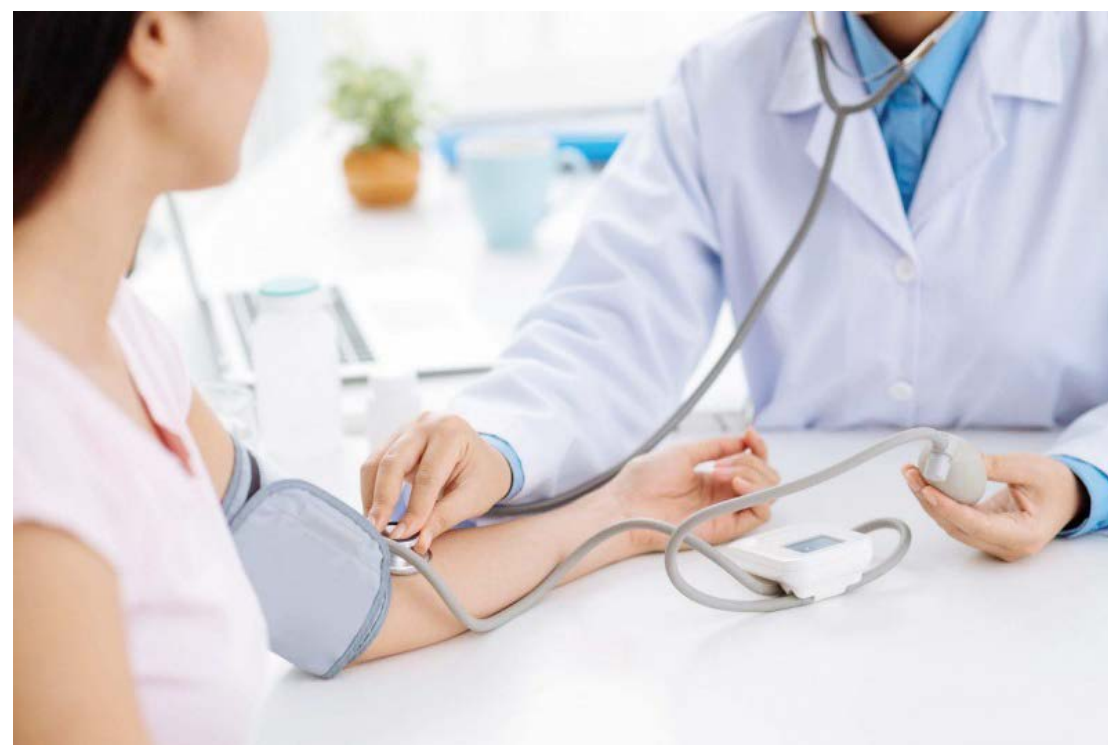
O horário de atendimento na UBS Central foi ampliado: até às 21 horas