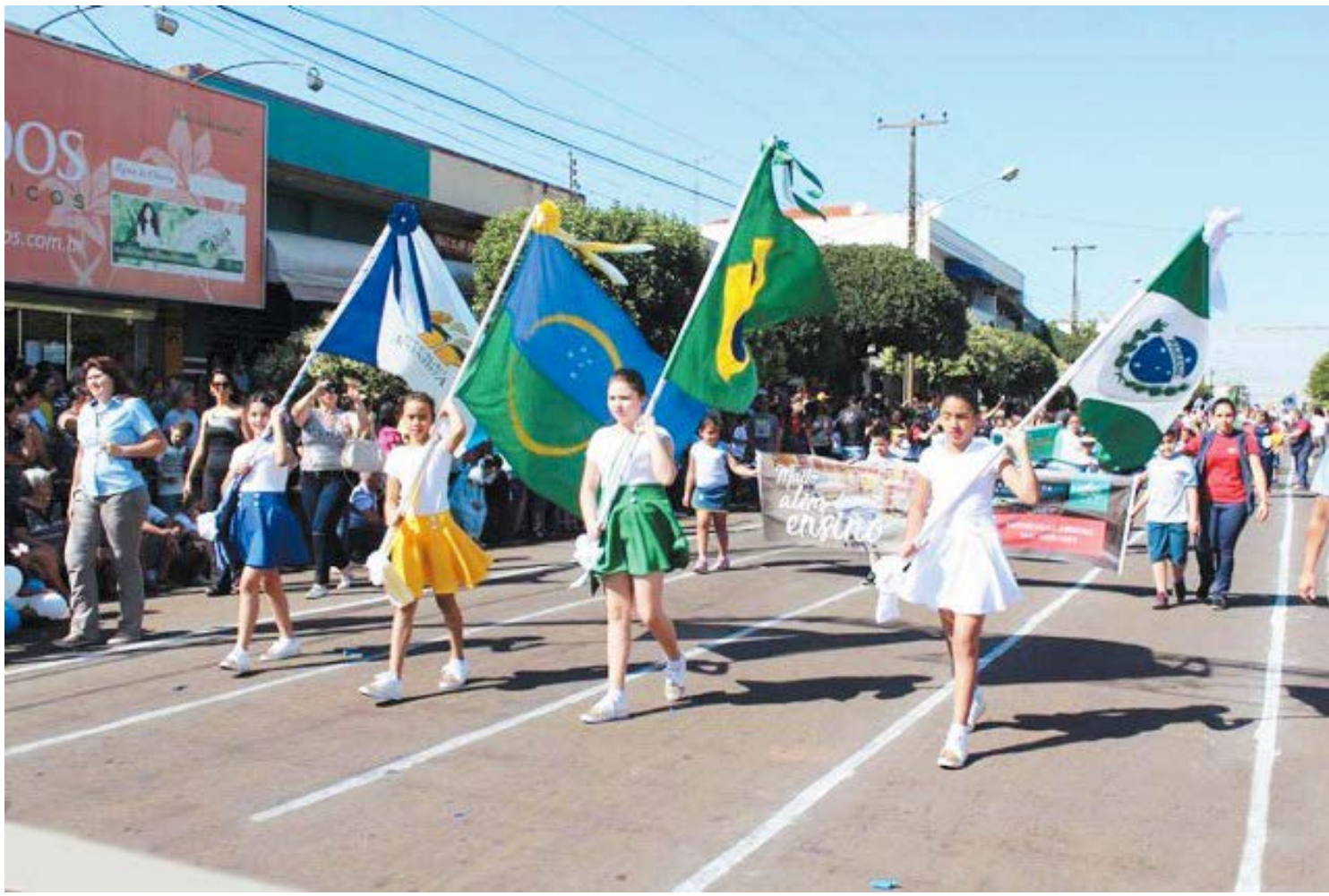
Acontecerá neste sábado mais uma edição de Desfile Cívico de 7 de Setembro

A concentração será às 8 horas, com o desfile saindo logo em