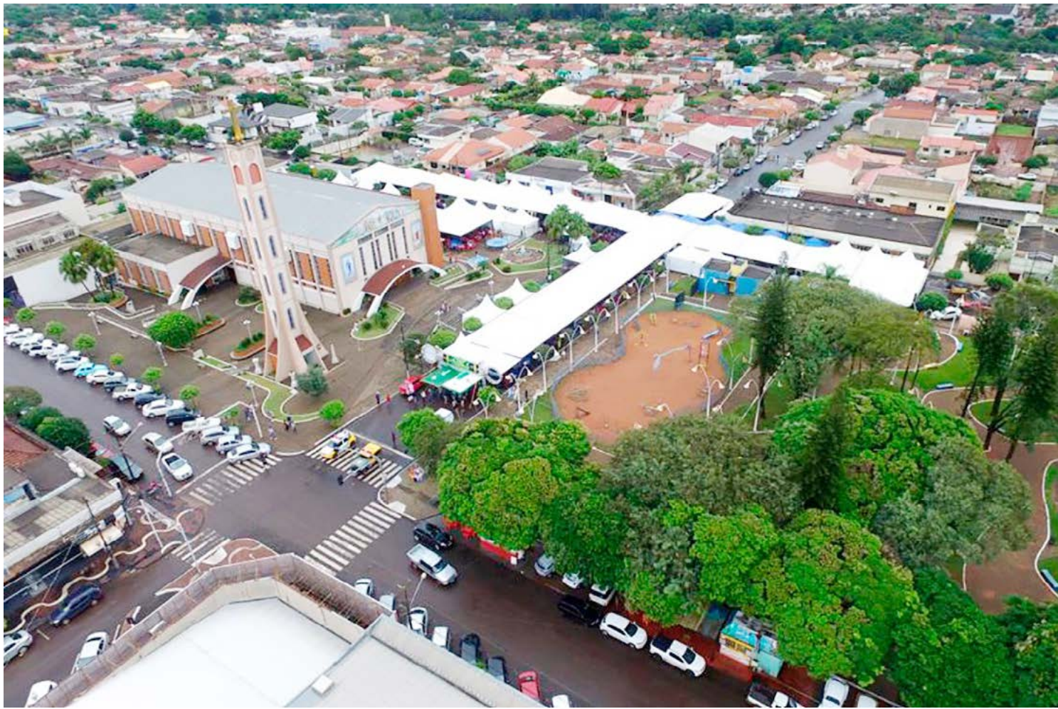
A programação de fechamento dos setores continua de segunda a sexta-feira

De acordo com a Sanepar, desde o início deste ano, várias ações emergenciais, manobras e melhorias já foram adotadas para garantir que não falte água tratada aos moradores da cidade. Conforme informou em nota, há dificuldades no abastecimento de água devido a vazão reduzida das nascentes que abastece a população. Com a estiagem, mananciais, poços e minas, que abastecem o município, foram perdendo vazão. O principal poço, localizado no