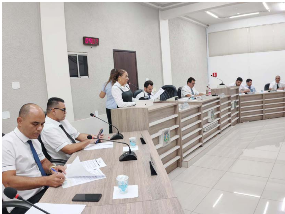
A sessão foi realizada na noite de ontem: apenas um projeto votado

É importante destacar que nestes quase quatro anos, a Câmara de Goioerê realizou um trabalho de excelência, sempre votando e aprovando projetos de interesse da comunidade e da administração municipal.