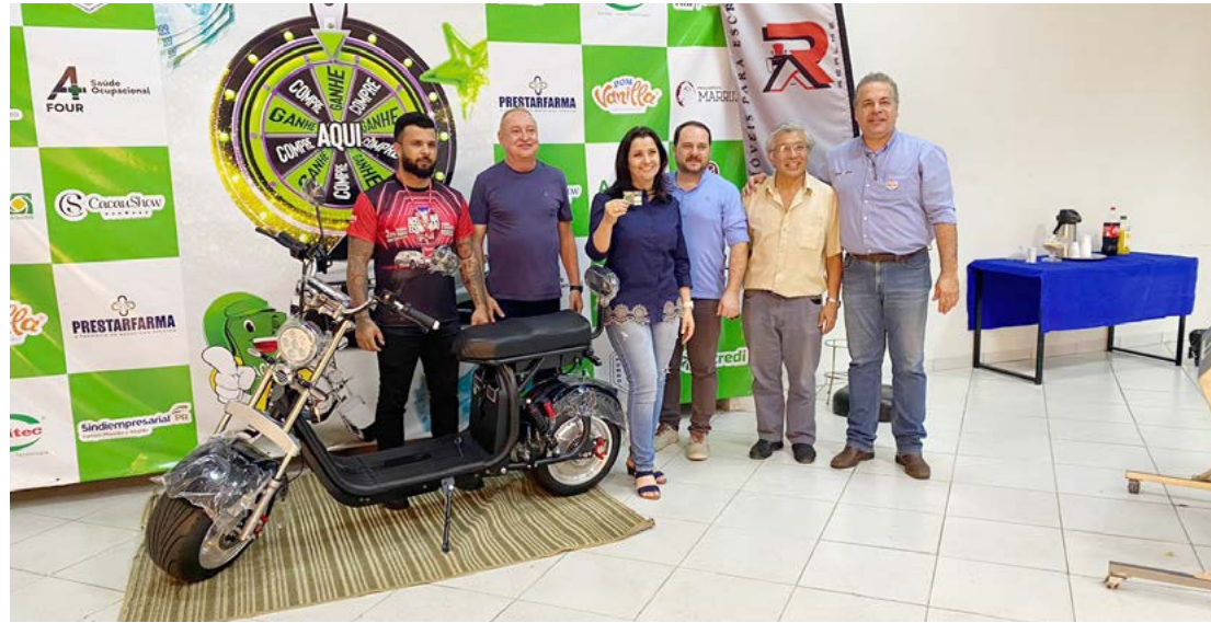
O sorteio foi feito na última sexta-feira em Goioerê

Além de fortalecer a economia da cidade e da região, essas ações oferecem prêmios atrativos aos consumidores, contribuindo para o movimento no comércio de Goioerê.