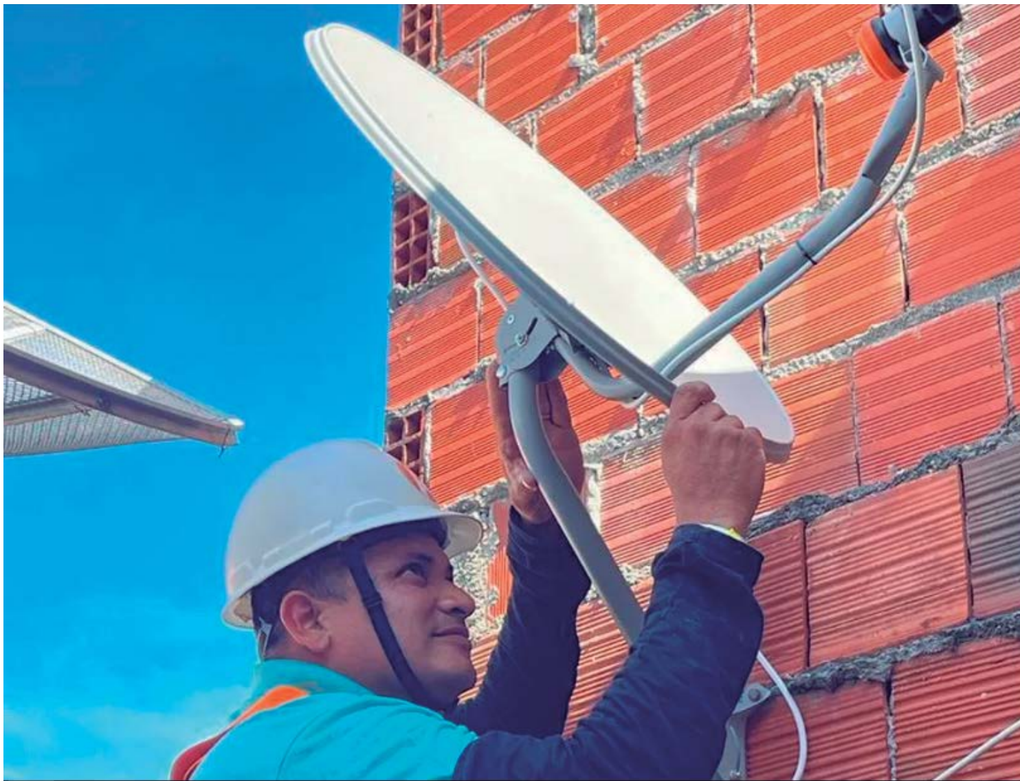
A ação faz parte de um programa que visa substituir os equipamentos antigos pelos novos modelos

A ação faz parte de um programa que visa substituir os equipamentos antigos pelos novos modelos digitais, garantindo acesso contínuo aos canais de TV sem interferências. As famílias interessadas devem acessar o site sigaantenado.com.br ou ligar para 0800 729 2404, de segunda a sexta-feira, das 08h00 às 20h00, e aos sábados, das 08h00 às 16h00, com o Cadastro de Pessoa Física (CPF) ou Número