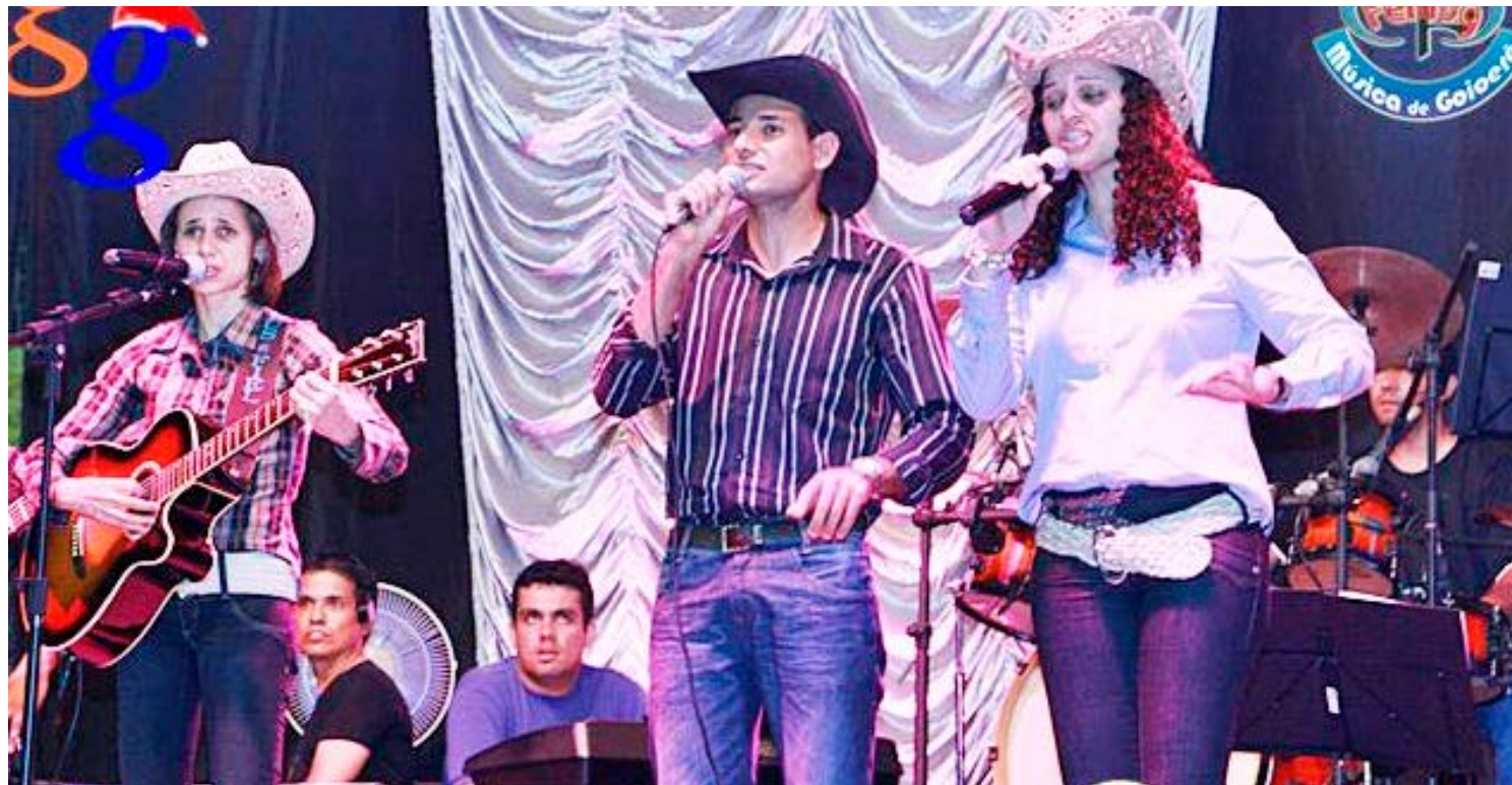
O festival será realizado no próximo mês de novembro na praça da Matriz: mais de 50 mil reais em prêmios

participar têm até o dia 10 de outubro para se inscreverem no site da prefeitura de Goioerê: goioere.pr.gov.br ou através do link: https://forms.gle/ccamsYu7HsuoX5tEA