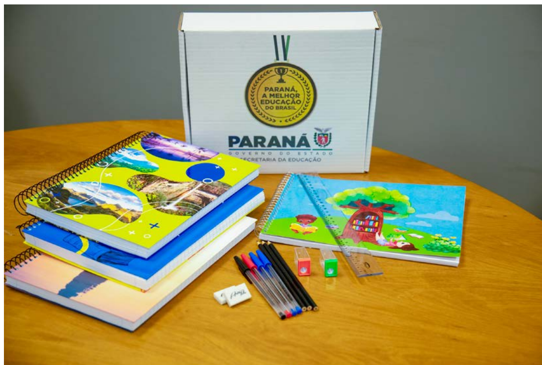
A distribuição dos kits será para todos os alunos da rede estadual de ensino

Os kits deverão ser entregues já no início do ano letivo de 2025, em fevereiro, para os alunos dos ensinos fundamental II, médio e profissionalizante e da Educação de Jovens e Adultos (EJA). A logística e distribuição dos materiais será feita pelo Núcleo