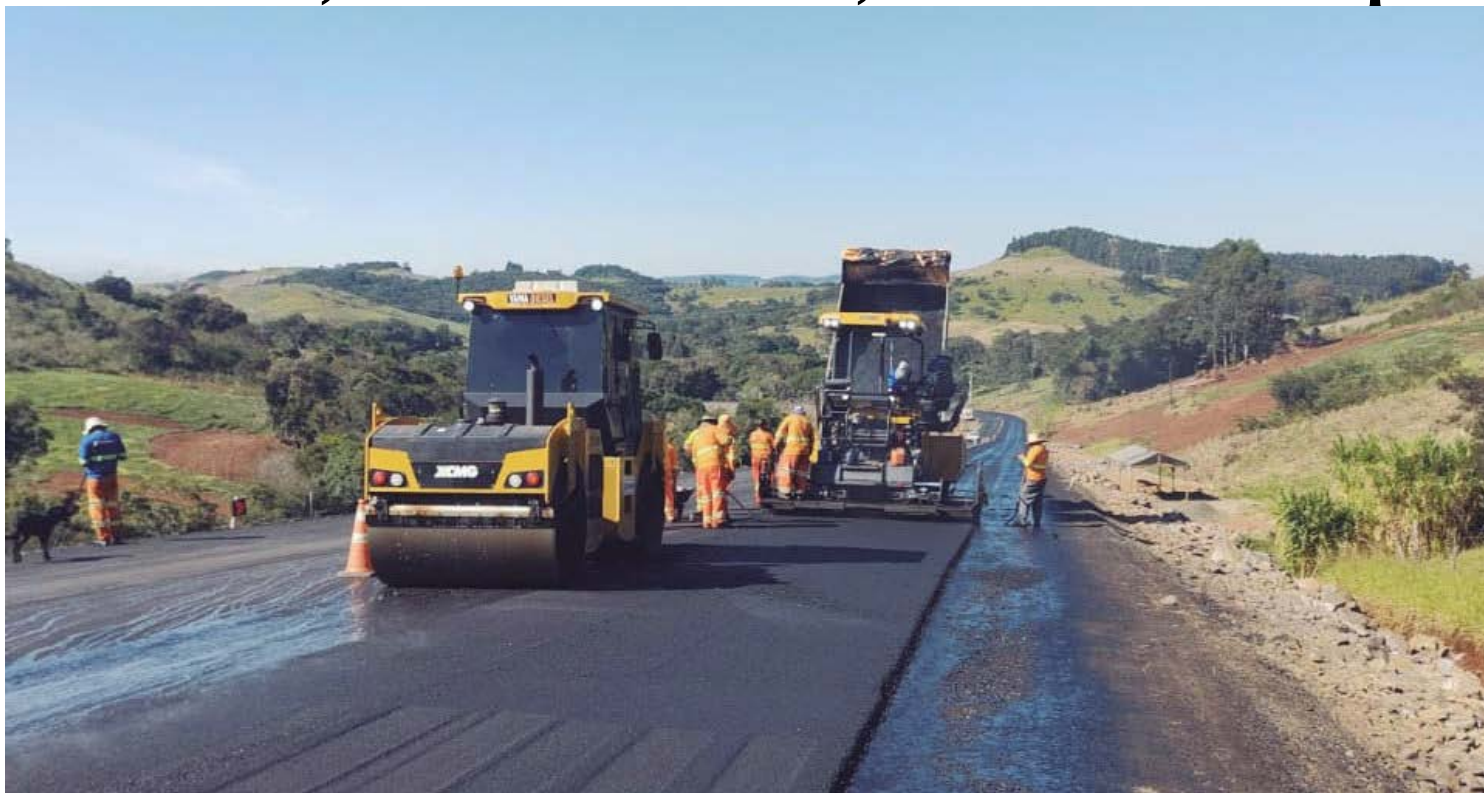
Ao todo, o orçamento dedicado a investimentos para o próximo ano será de R$ 6,3 bilhões, valor quase 60% maior do que o registrado na Lei Orçamentária Anual (LOA) de 2024, segundo números da Secretaria de Estado da Fazenda (Sefa)

Para o secretário da Fazenda, Norberto Ortigara, esse aumento nos investimentos previsto na PLOA é reflexo não só da boa saúde fiscal do Paraná, mas também do compromisso do Governo do