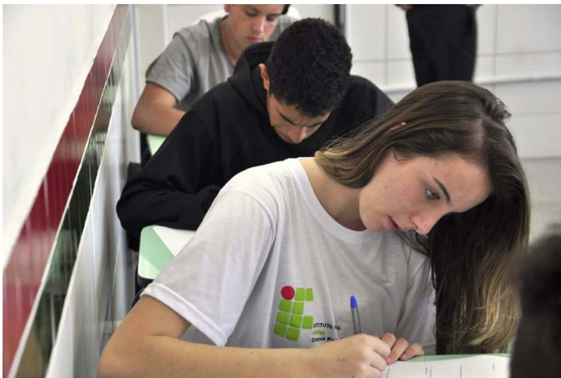
As inscrições para os cursos do IFPR seguem até o dia 20 de novembro

INSCRIÇÕES: - O período de inscrições para concorrer a uma vaga nos cursos técnicos do IFPR foi iniciado no último dia 03 de