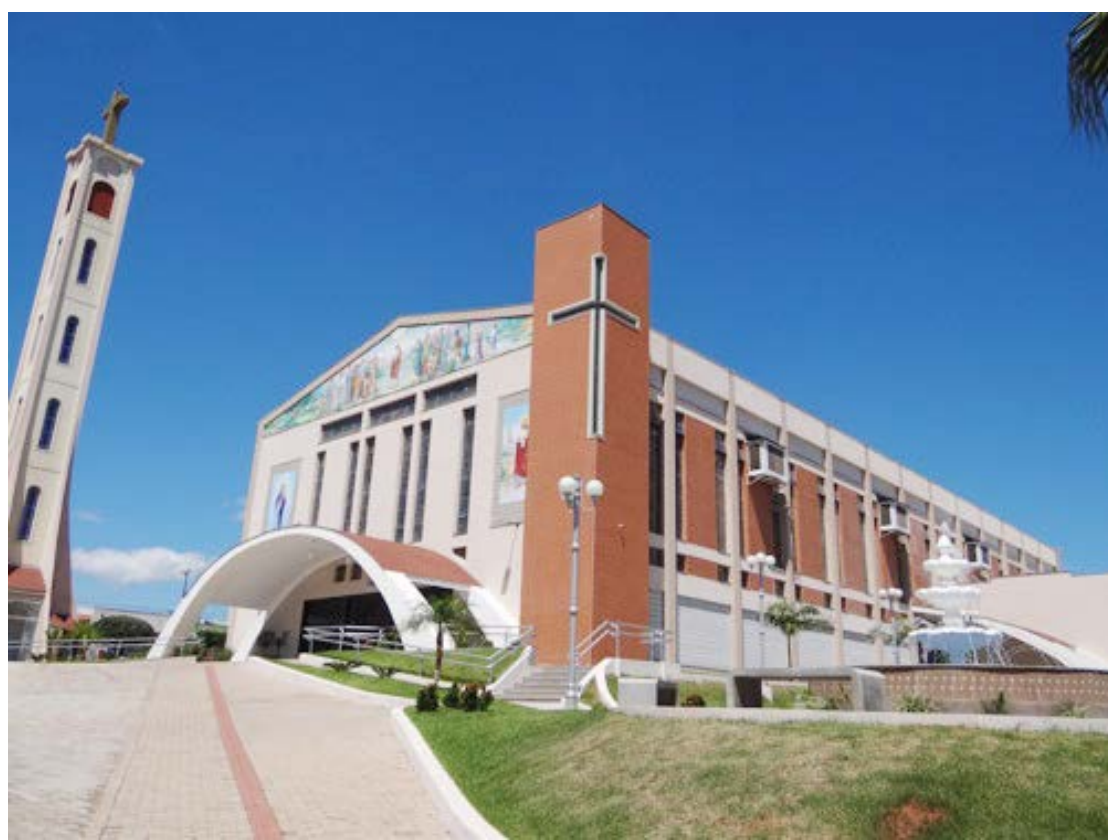
Na igreja Matriz a programação será movimentada, com missa e procissão

A Igreja Matriz será o local principal das celebrações deste sábado, uma vez que o templo é também o maior das igrejas católicas, podendo abrigar um grande número de fiéis.