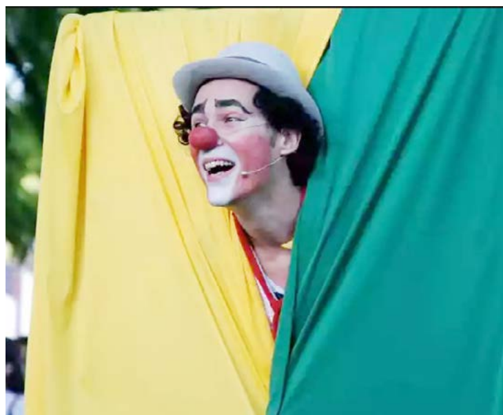
Os ingressos para o espetáculo serão distribuídos a partir de hoje

Segundo a orientação dos organizadores, os interessados em fazer a reti-