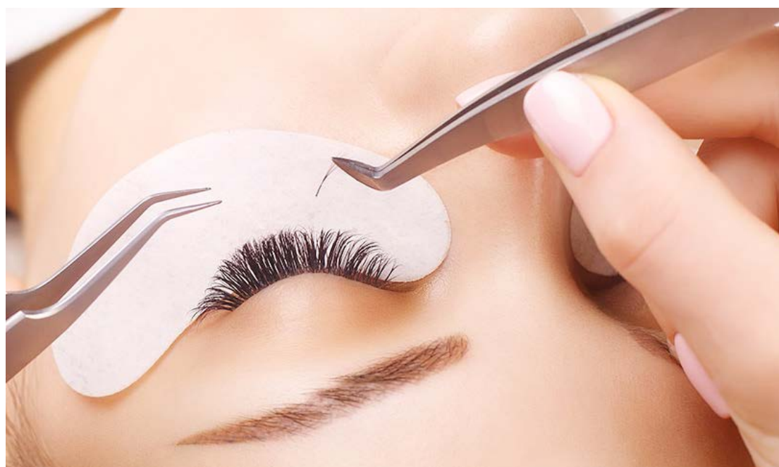
No total quatro novos cursos estão com inscrições abertas em Goioerê

O Curso de Técnicas para Operação de Caixa, com carga horária de 18 horas, será realizado de 05 a 28 de novembro, com aulas de segunda a quinta-feira, das 19h30 às 22h30, no Polo UAB, próximo ao Ginásio do Jardim Lindóia. Este curso é ideal para quem busca qualificação rápida e prática para trabalhar no comércio, aprendendo a operar caixas e lidar com