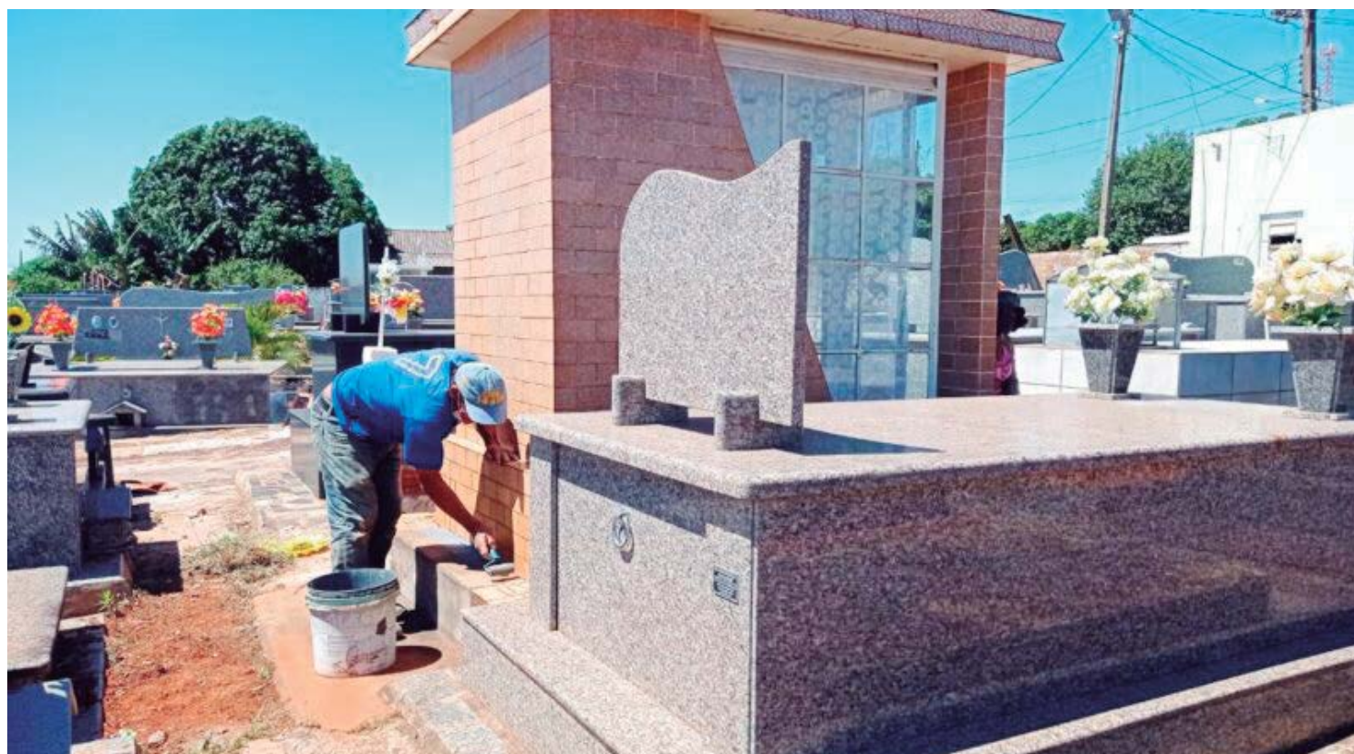
O prazo para realização de serviços de construções e reformas termina no dia 28, segunda-feira

A expectativa é que o Dia de Finados reúna milhares de pessoas no cemitério e a orientação é para não deixar os serviços para a última hora. “É importante