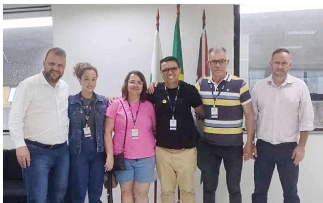
O vereador esteve na capital do estado esta semana: recurso para entidades

O vereador ressaltou a importância da articulação desses recursos para garantir melhorias nas instituições que prestam assistência social em Goioerê. Ele destacou que o apoio do Governo Estadual é essencial para que essas entidades possam ampliar e qualificar os serviços prestados à comunidade.