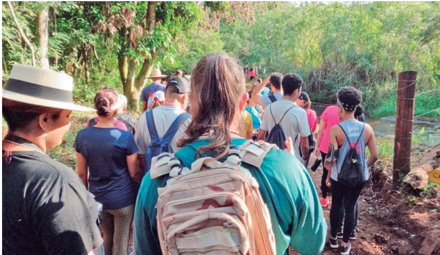
A caminhada está prevista para acontecer neste domingo, dia 27: inscrições seguem abertas

A concentração inicial será às 7 horas, no Parque de Exposições, onde em seguida será servido o café da manhã ao preço de R$ 15,00. Após a caminhada, às 12 horas, será servido almoço, com os convites custando R$ 40,00 cada. Toda a renda arrecadada no evento será destinada