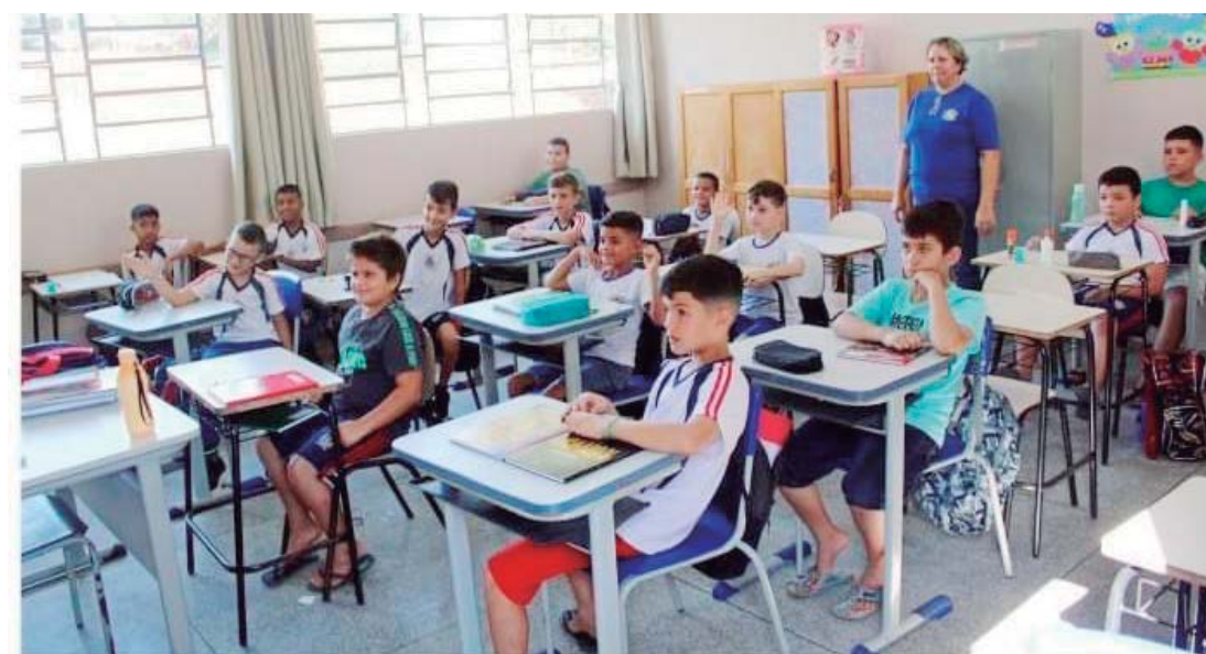
A rematrículas de forma online, a partir do dia 4 de novembro através da Área do Aluno

cessários para as matrículas estão fotocópia da matrícula ou água ou luz, comprovante de endereço, número de telefone e declaração vacinal atual, que deve ser pedida no Posto de Saúde.