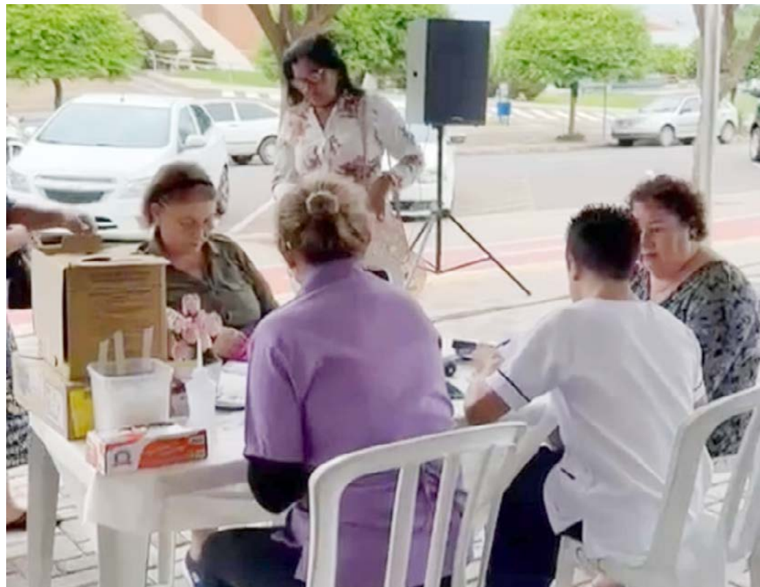
Ações iniciadas sábado seguem durante todo mês

ter tido relação sexual por dois dias e evitar o uso de cremes e duchas vaginais pelo mesmo período.