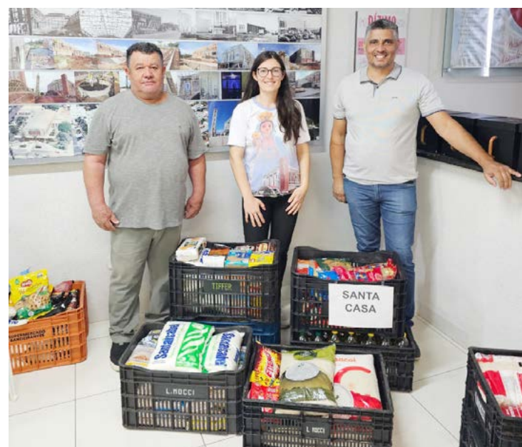
A doação foi feita pela comunidade católica da Paróquia Nossa Senhor das Candeias

A doação visa fortalecer a entidade, oferecendo aos pacientes e seus acompanhantes uma ali-