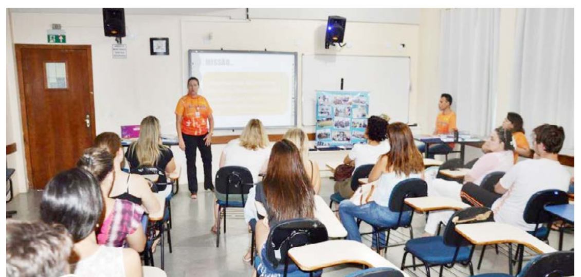
As inscrições terminam na próxima sexta-feira, dia 25

O concurso é voltado para estudantes que buscam acesso a um ensino de excelência, com uma