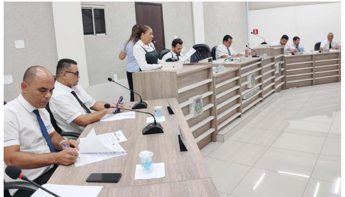
A sessão da Câmara foi realizada na noite de ontem em Goioerê

Ainda na sessão de ontem, os vereadores analisaram dois projetos de lei de iniciativa do Poder Executivo, sendo que o primeiro tratou da ratificação da consolidação do protocolo de intenções do Consórcio Intermunicipal de Educação e Ensino do Estado do Paraná (CIE-