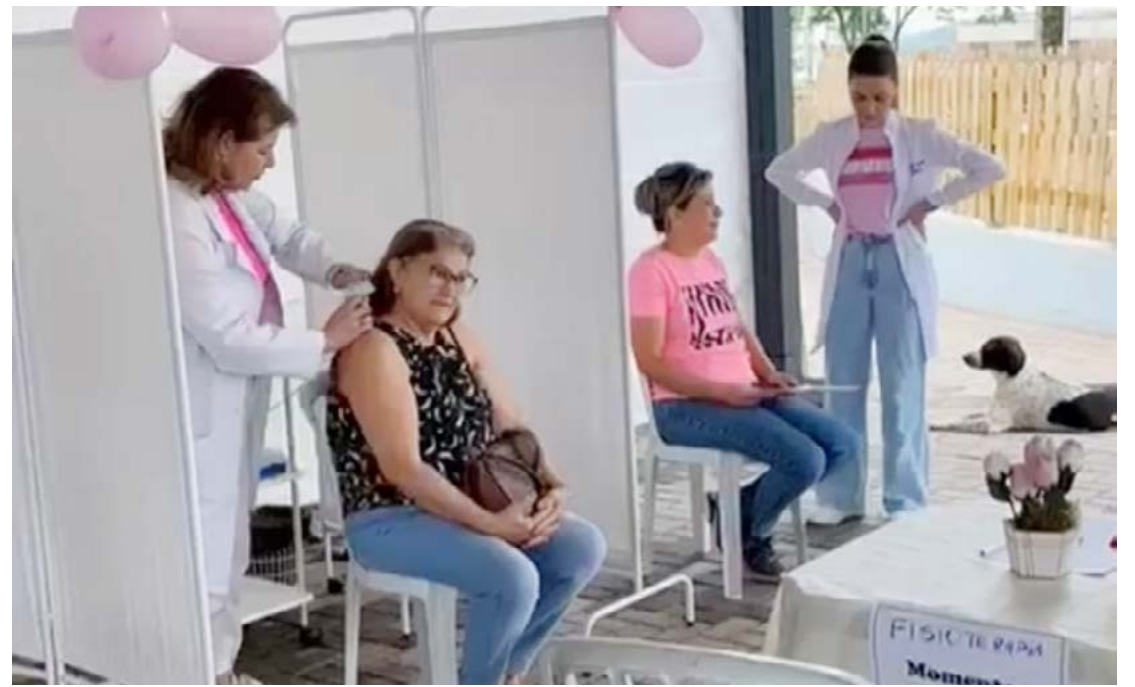
Diversos serviços foram oferecidos no último sábado na praça da Matriz

Para o exame é necessário levar um documento com foto, cartão SUS, cartão do posto, além de não estar menstruada, não