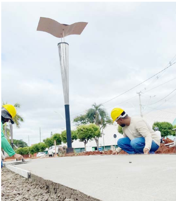
Os postes estão sendo substituídos e avenida vai ganhar novo sistema de iluminação

Ainda de acordo com o prefeito Betinho, a revitalização da Avenida