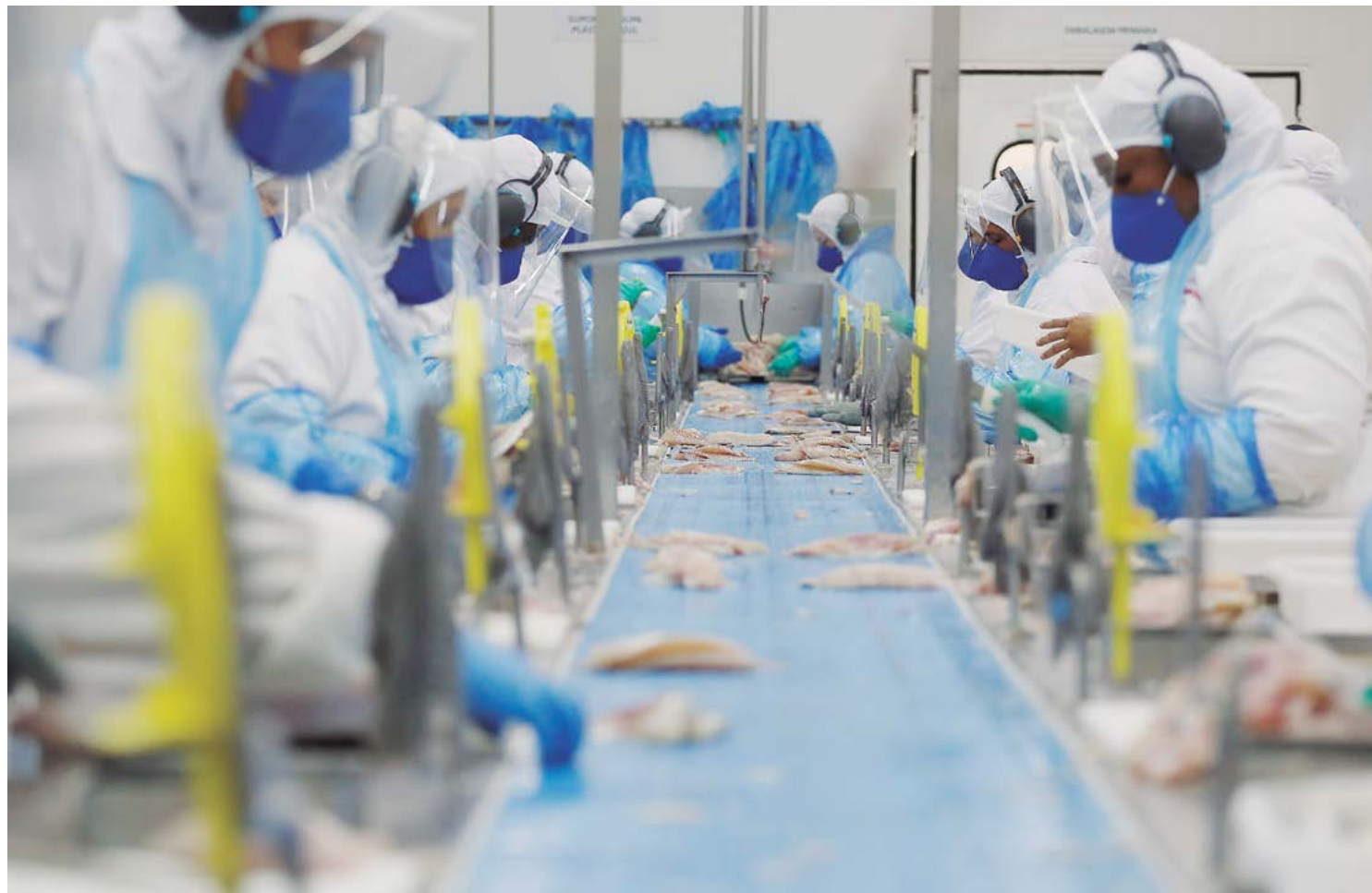
Ranking Época Negócios 360° 2024, divulgado nesta terça-feira (5) pela Revista Época e a Fundação Dom Cabral, mostra as empresas paranaenses que se destacam em cenário nacional.

Outro destaque é para a indústria automotiva, com a