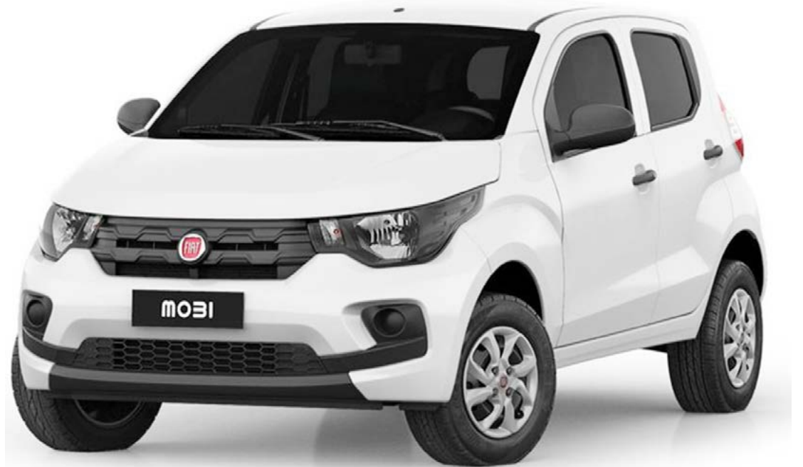
Comércio vai sortear veículo zero-quilômetro para os consumidores locais e também da região

“Estamos bem otimistas e a promoção do comércio será o grande diferencial neste final de ano em Goioerê”, destaca o presidente