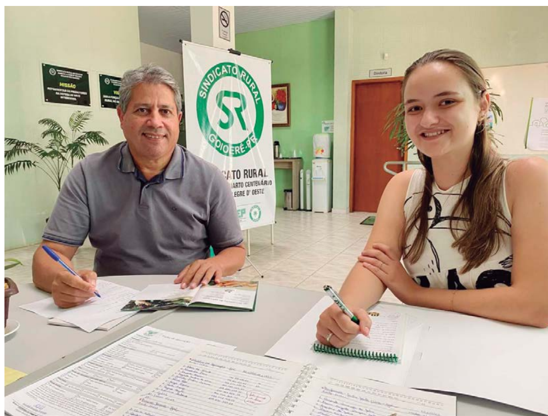
A renovação da parceria foi assinada na última quinta-feira em Goioerê

O gerente do IDR também reforçou que a parceria com o Sin-