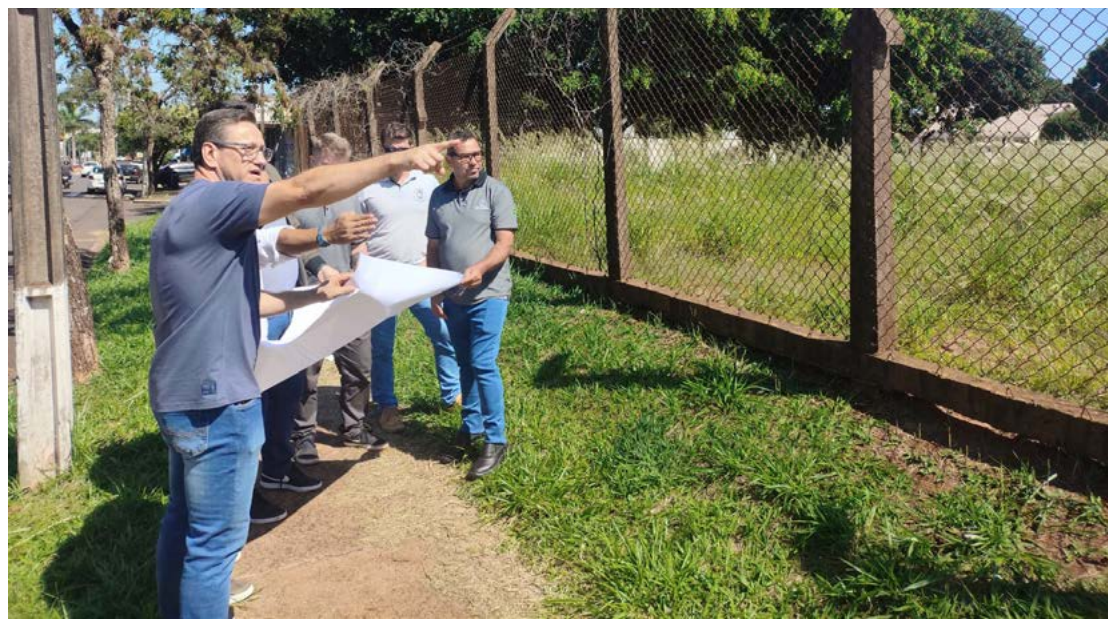
As obras de construção da sede própria do Núcleo de Educação serão iniciadas no próximo mês de dezembro

A nova sede será erguida em um terreno localizado nos fundos do Premen I, com frente para a Avenida Santos Dumont, e contará com 1.000 metros quadrados de área