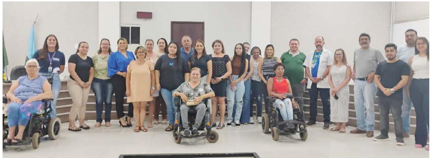
O curso foi realizado através de parceria da Câmara de Vereadores com o Senai

Os artigos assinados não exprimem necessariamente a opinião do Jornal