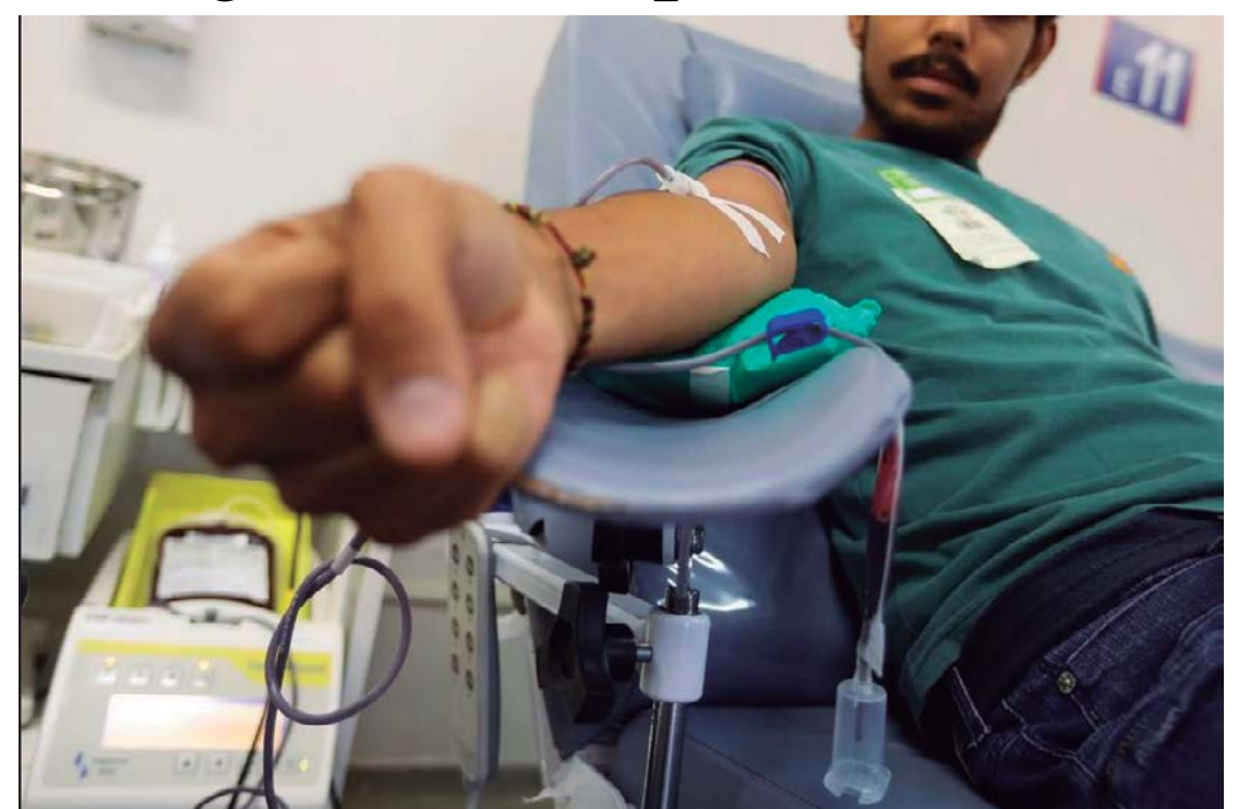
O alerta está sendo feito por conta de que no final de ano os estoques de sangue caem

“Neste momento que se aproxima de dezembro, há o aumento das cirurgias eletivas de grande porte. Médicos, antes de sair de férias, querem atender seus pacientes, e os pacientes querem fazer cirurgias