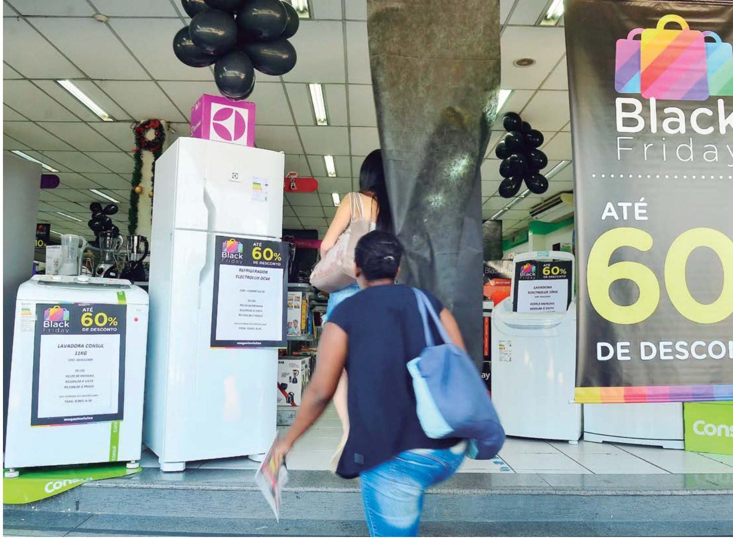
A promoção será aberta nesta sexta-feira: expectativa de boas vendas

perfil dos consumidores e identificou as principais características daqueles que participarão da Black Friday: Idade predominante – de 26 a 35 anos, seguidos pela faixa etária de 46 a 55 anos.