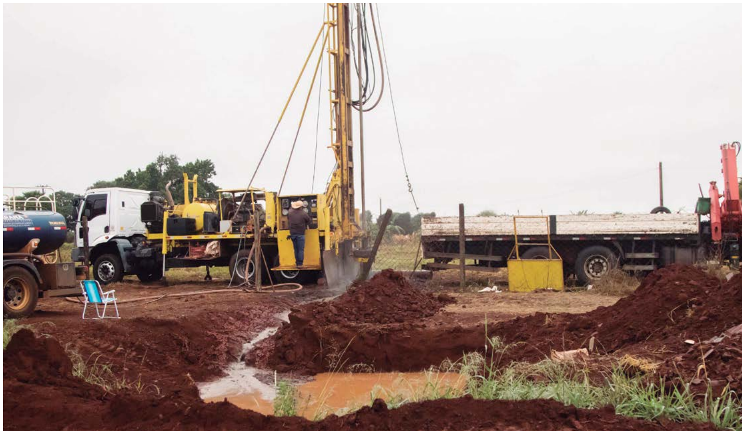
Objetivo do Governo do Estado, com a aquisição de três novas sondas roto-pneumáticas, é entregar os novos poços artesianos em comunidades rurais do Paraná no ano que vem, um incremento de 72% em relação a 2024

De acordo com a regulamentação do programa, o IAT fica responsável por fornecer os equipamentos de perfuração, kits contendo bomba, cabos, quadro de comando, reservatório com 10 mil ou 20 mil litros de ca-