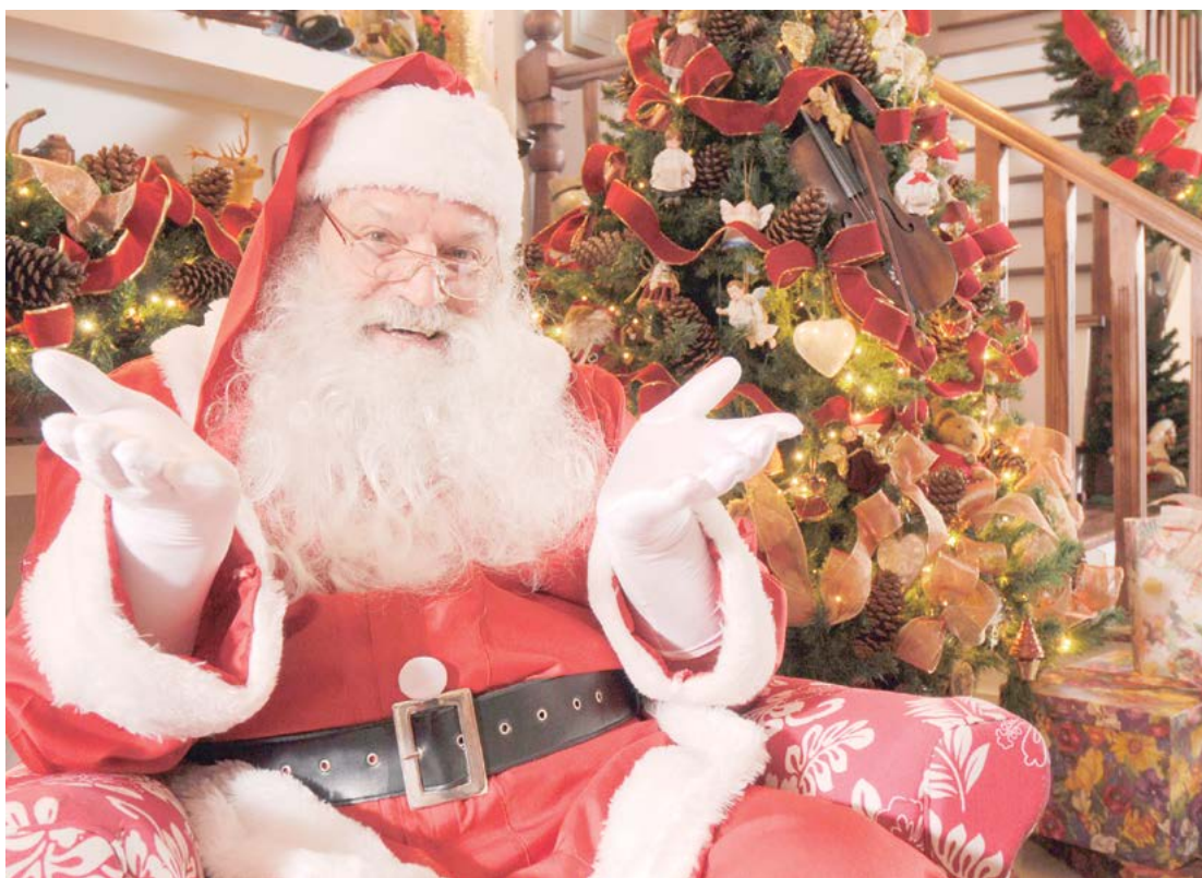
A chegada do Papai Noel está marcada para acontecer no dia 6 de dezembro em Goioerê

A programação conta com parceria da ACIG e prefeitura e segundo os organizadores, a chegada do Papai Noel, no dia 6, promete levar um clima de encanto e magia às ruas de Goioerê, atração que deverá reunir centenas de pessoas no centro