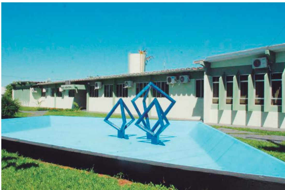
O fim de ano será de recesso nas repartições públicas, a partir do dia 23 de dezembro

to de saúde, haverá plantão no Posto Central, o que ajudará a desafogar o Pronto Atendimento, que geralmente fica