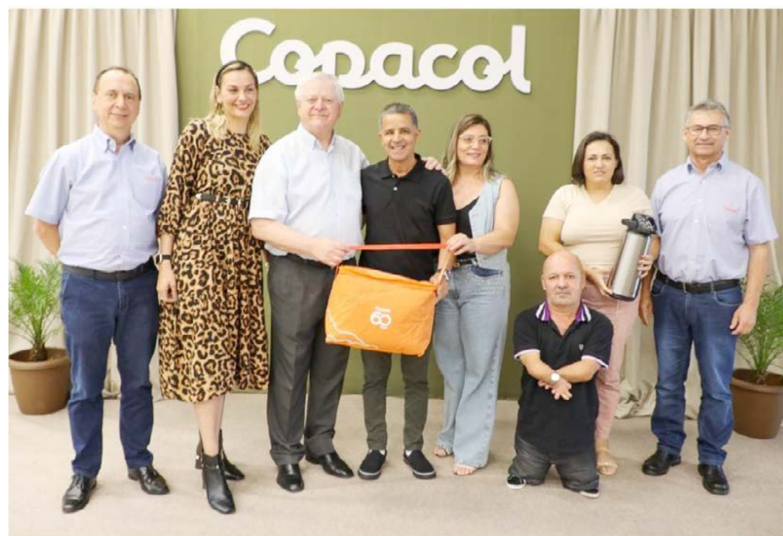
estiveram na Frimesa em Assis Chateaubriand