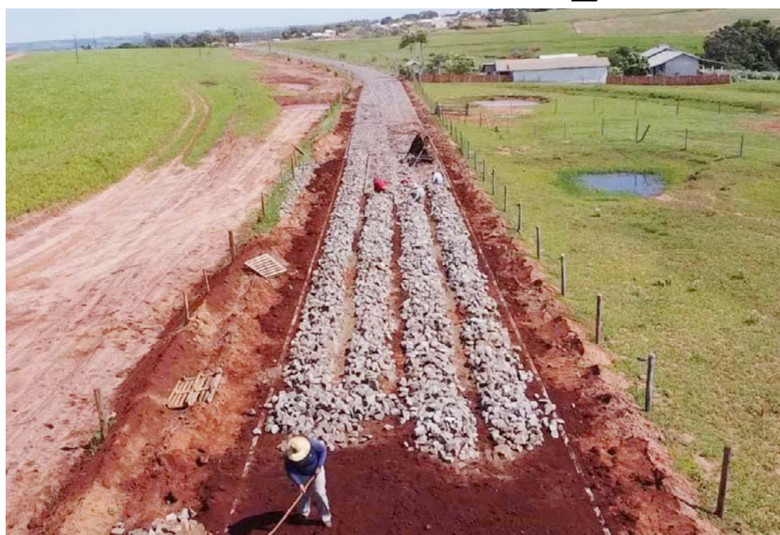
As obras estão em andamento: mais de R$ 1,8 milhão em investimentos

O investimento total será de R$ 1.899.630,27, sendo que R$ 1,7 milhão, foi viabilizado pelo deputado Alexandre Curi, junto ao Governo do Estado. A prefeitura entrou com