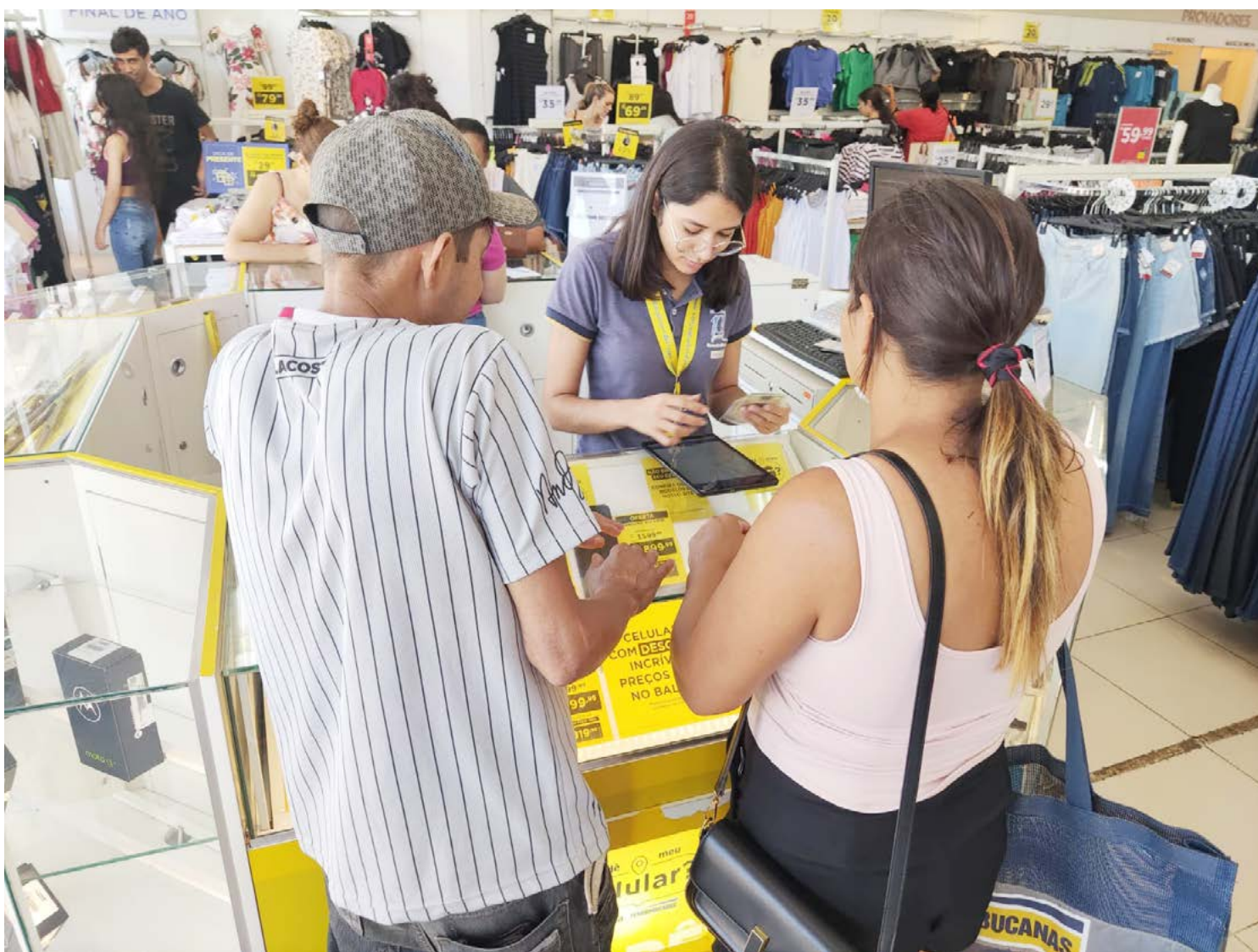
O comércio começa a funcionar em horário especial à noite no dia 16 de dezembro

A exemplo de anos anteriores, o horário especial de fim de ano deverá ser seguido pela maioria das empresas do centro