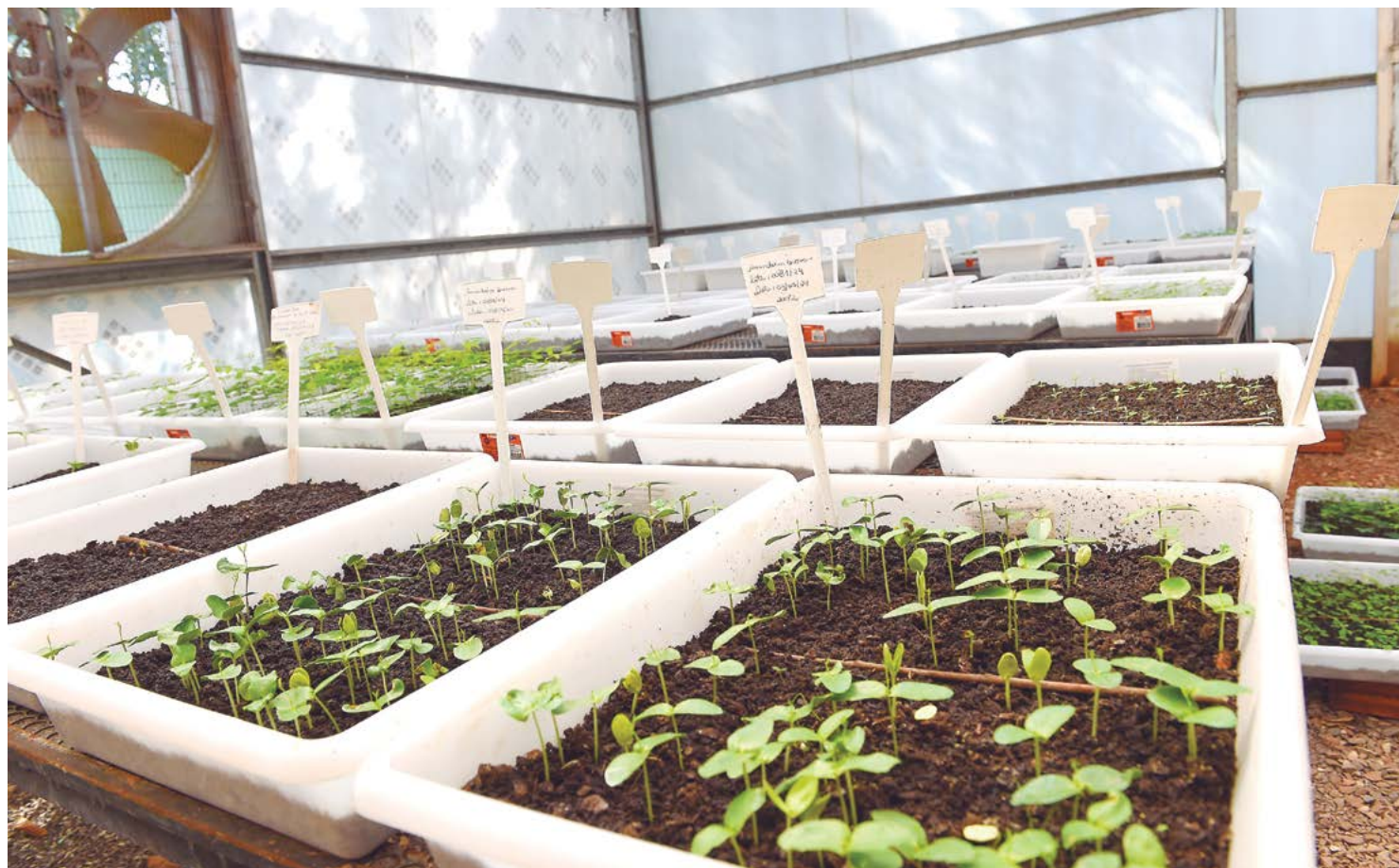
Paraná Mais Verde versão 2025 terá o início da reestruturação dos viveiros e laboratórios de sementes administrados pelo IAT

Outro objetivo é a expansão dos arboretos, espaços exclusivos para a proteção da diversidade arbórea, possibilitando que os visitantes aprendam sobre os diferentes usos da floresta, bem como sua interação com o meio ambiente. Serão quatro pontos a mais até