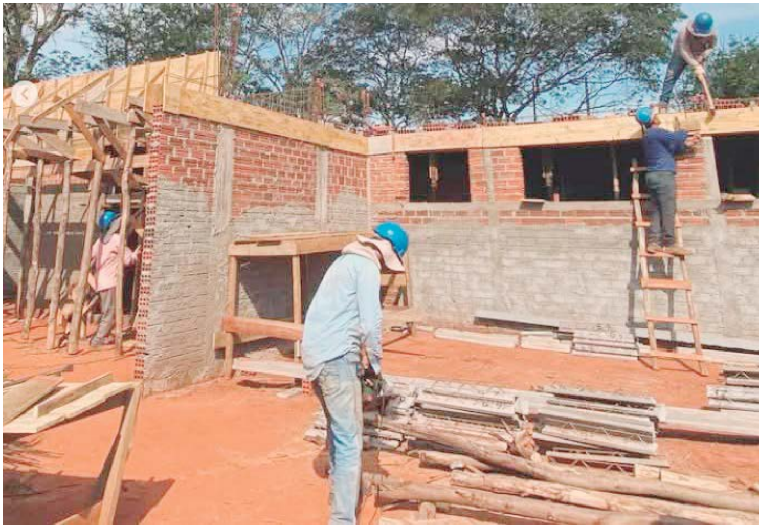
As obras estão bem adiantadas: investimentos de R$ 1,2 milhão