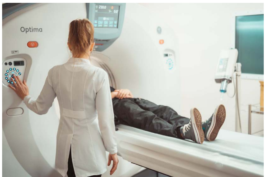
Em 2023, eram 31.109 estabelecimentos em todo o Estado, entre públicos (municipais/estaduais/federais) e privados, 24,6% a mais que o registrado em 2018 (24.958).

Já o número de clínicas e ambulatórios especializados passou de 2.563 para 3.600 no mesmo intervalo de tempo, aumento de 40,5%. E esse número deverá aumentar ainda mais com os dados de 2024. Somente na última segunda-feira (18), um centro médico com 25 clínicas de diversas especialidades foi inaugurado