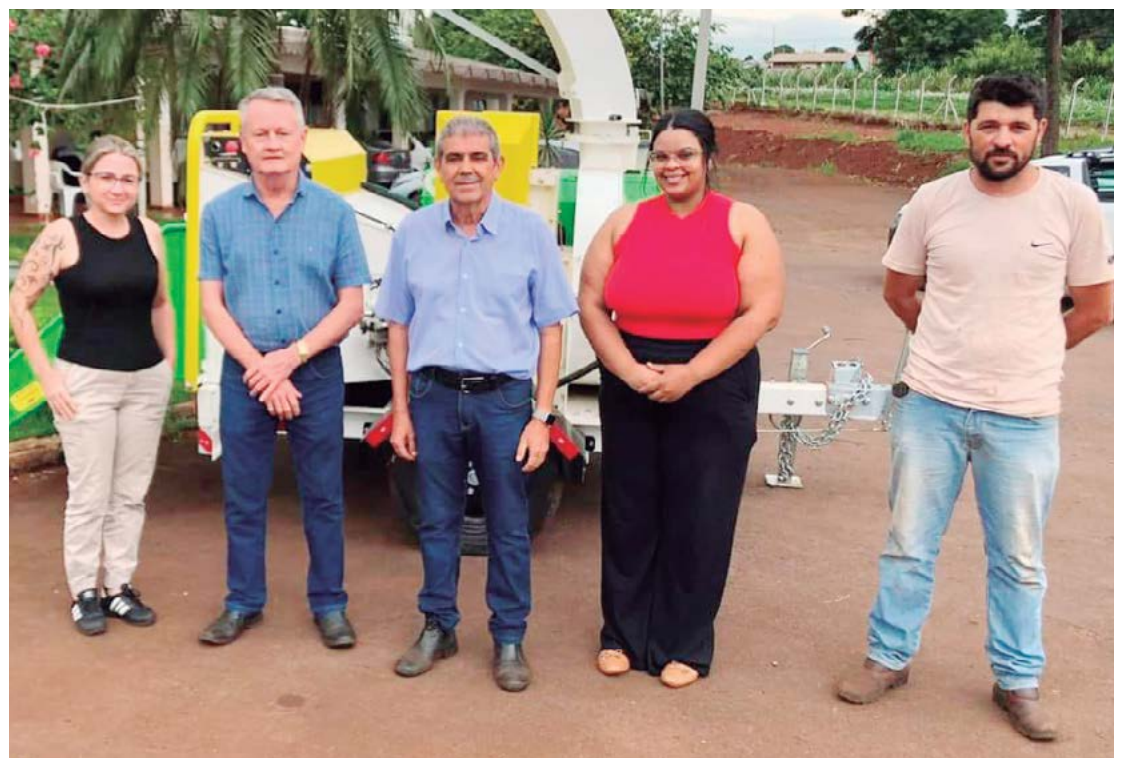
O investimento de R$ 234 mil, sendo R$ 210.600,00 através do Governo do Estado