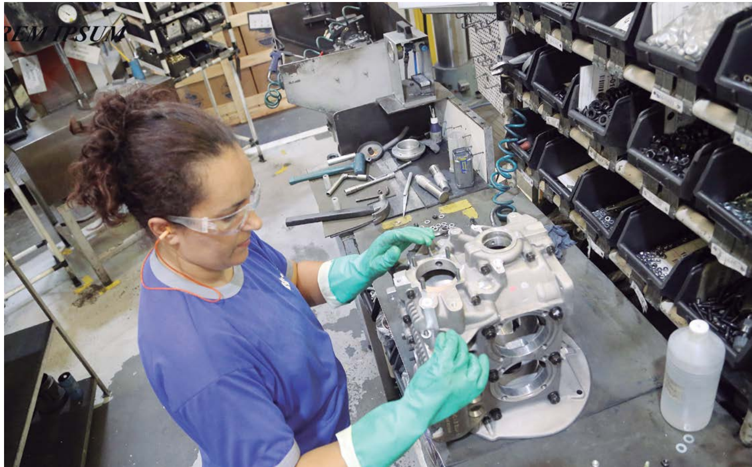
Paraná alcança número recorde de mulheres no mercado de trabalho: 2,6 milhões

Consequentemente, a taxa de desocupação feminina apresentou recuo expressivo, caindo para 4,8% no 3º trimestre deste ano. A título de ilustração, no 1º trimestre de 2019, 11,3% das paranaenses que procuravam emprego não alcançavam o objetivo, ou seja, a taxa de desocupação entre as mulheres declinou para menos da metade no Paraná nos últimos seis anos.