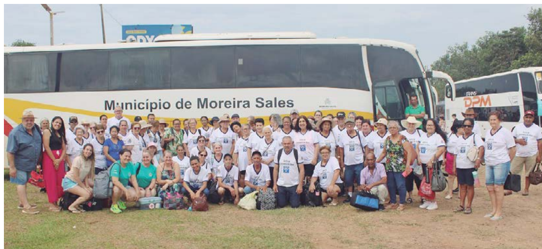
Os idosos viajaram com apoio do Governo Estadual e Prefeitura Municipal

No total 84 idosos estiveram presentes na viagem, proporcionada através programa do estado “Viaja+60”, em parceria com a Prefeitura Municipal.