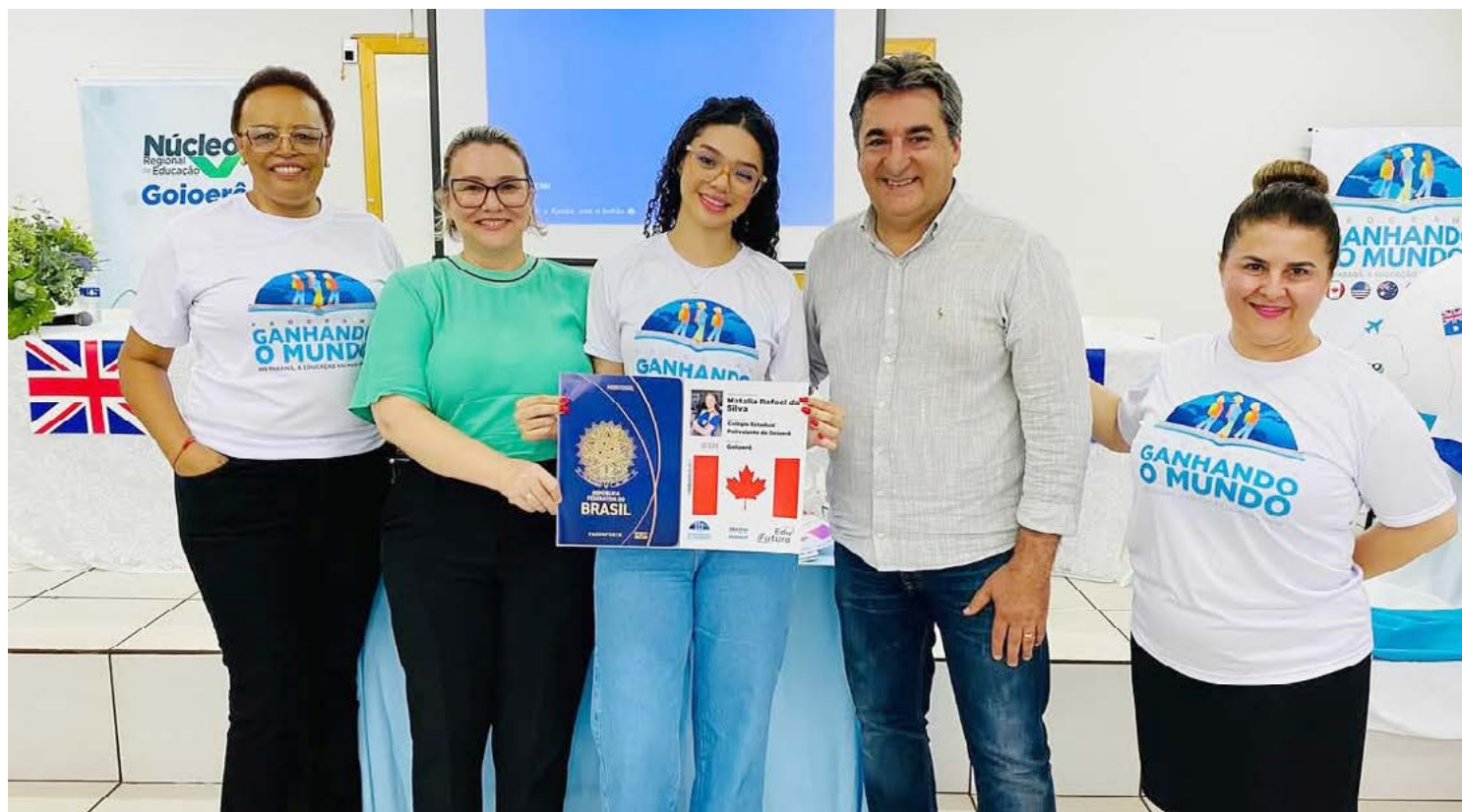
De Goioerê, quatro estudantes foram classificados para o programa

Os embarques estão previstos para começarem no início de 2025 e no total serão três meses de intercâmbio com to-