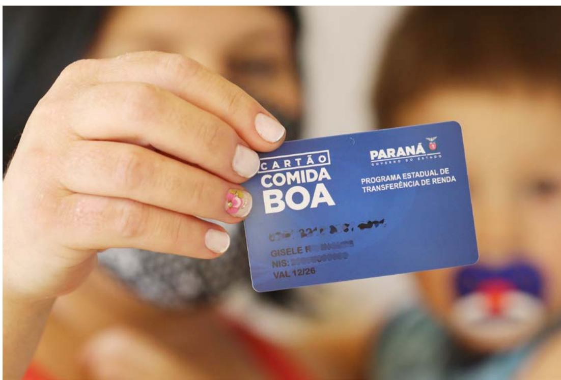
O cartão pode ser retirado no CRAS: mais de 200 famílias estão sendo convocadas

A secretária lembra que o benefício disponibilizado pelo Governo