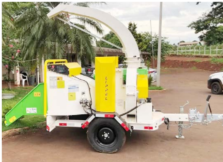
O novo triturador foi entregue na última sexta-feira: auxiliar na limpeza urbana