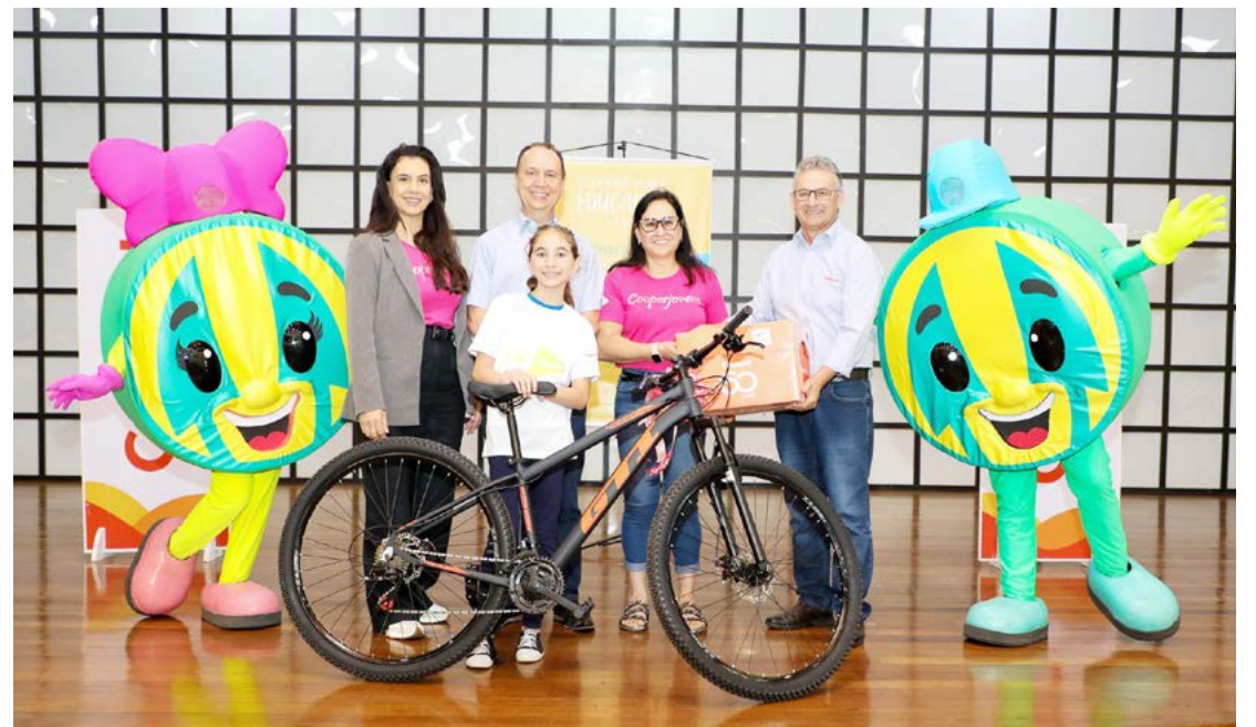
A atividades de recreação foram realizadas nesta quarta e quinta-feira, em Cafelândia, com a participação de 558 crianças envolvidas no CooperJovem

Como parte das atividades desenvolvidas ao longo do ano, após conhecer a fundo