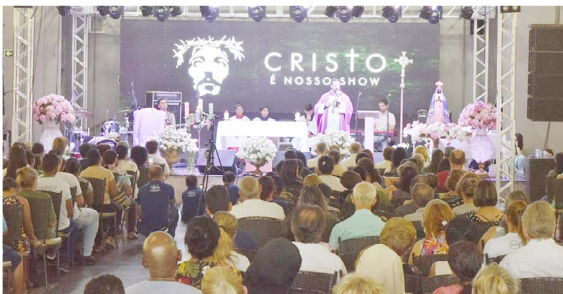
O evento acontece no Seminário São José, das 8 às 17 horas

A programação desse ano inclui ainda a 16ª Jornada Diocesana da Juventude (IDJ), atividade que faz parte do calendário da Igreja Católi-