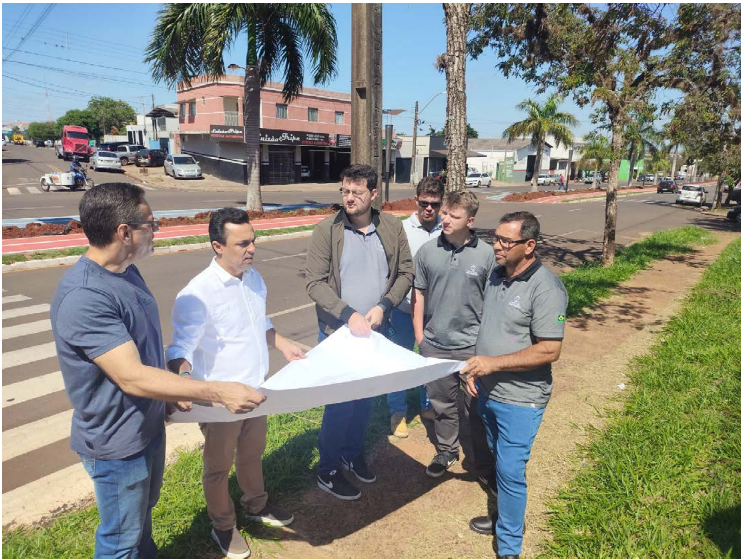
A construção será iniciada ainda no mês de dezembro: conquista importante para Goioerê