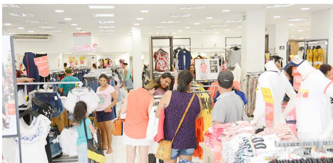
Por conta do feriado nacional desta sexta-feira, dia 15, o comércio de Goioerê estará fechado

A direção da ACIG lembra aos consumidores que o comércio já está realizando a pro-