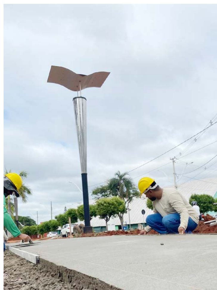
Os postes estão sendo substituídos e avenida vai ganhar novo sistema de iluminação

Ainda de acordo com o prefeito Betinho, a re-