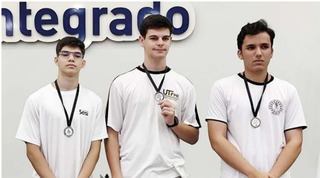
Os estudantes fizeram bonito na competição: conquista importante