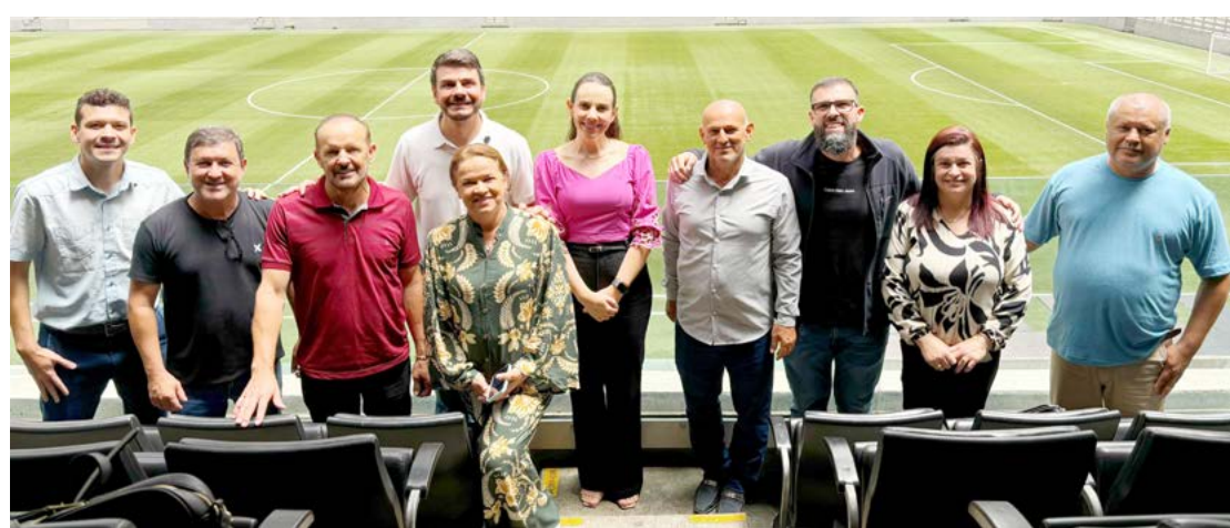
A equipe de Moreira Sales durante visita à Arena da Baixada

Tanto a Prefeitura de Moreira Sales, quanto Athletico Paranaense têm consciência que muitos pais não tem condições de matricular seus filhos em escolas de futebol, por isso, esse projeto tem essa responsabilidade social.