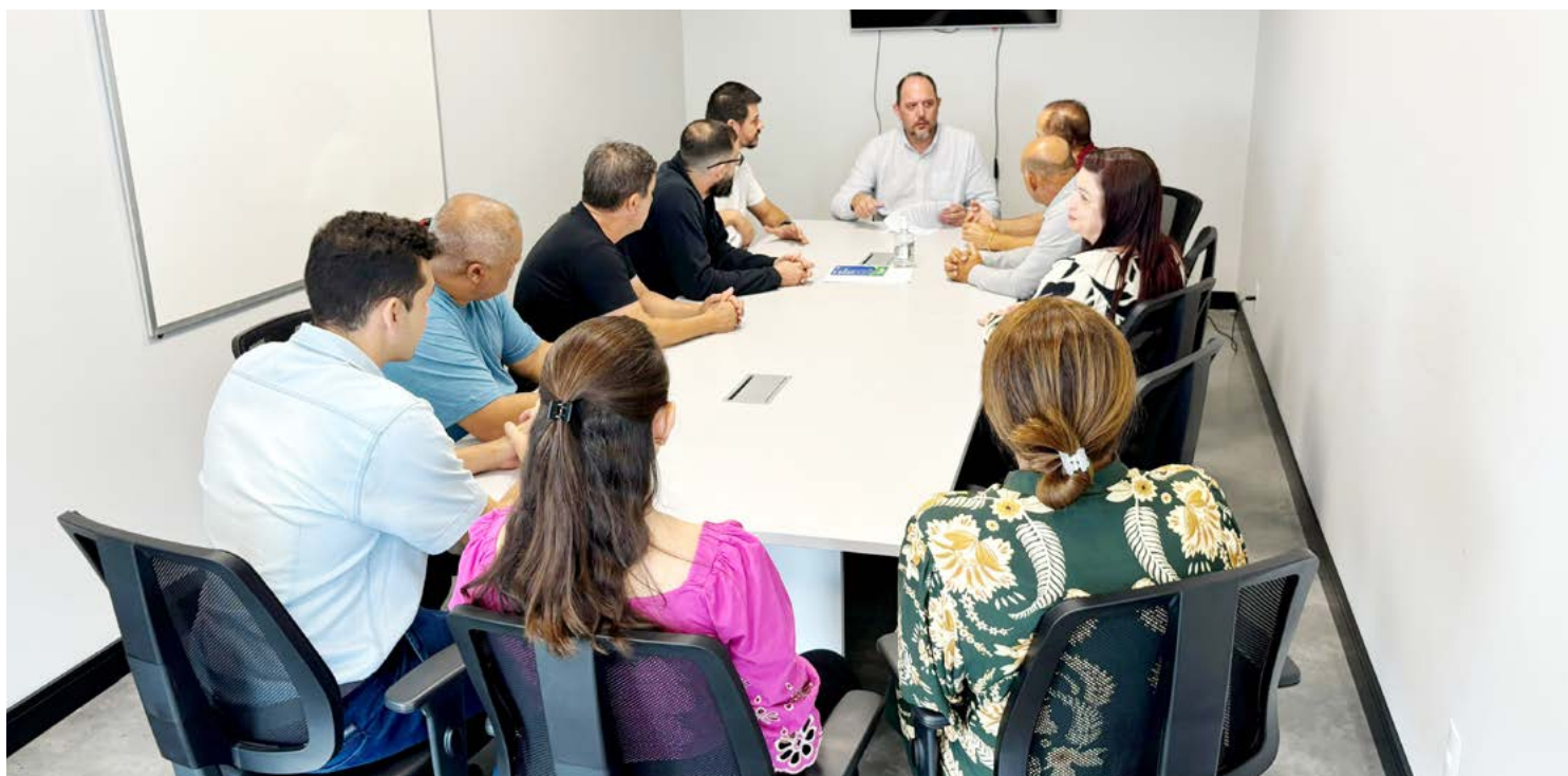
O convênio foi assinado na semana passada, na sede do club em Curitiba

O Projeto atenderá crianças e adolescentes, divididos em categorias conforme faixa etária, sendo disponibilizados para treinos e jogos e uniformes do Clube Athletico Paranaense.