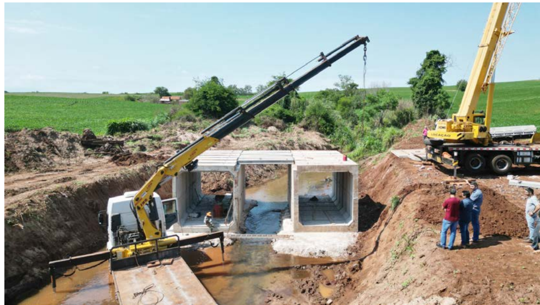
A ponte é de concreto e vai promover o acesso de moradores e agricultores aos municípios de Moreira Sales e Janiópolis

para facilitar o transporte escolar e até de pacientes que precisam de serviços da saúde dos dois municípios.