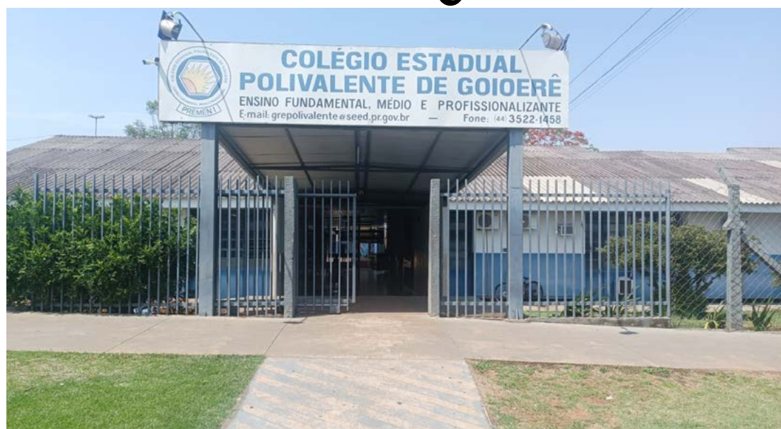
As obras serão iniciadas assim que assinada a ordem de serviços na próxima quinta-feira, dia 21

A iniciativa visa melhorar a infraestrutura do colégio, que é um dos mais antigos e maiores da cidade, por meio da construção de novos banheiros, troca de telhado, pintura nova, troca de piso, mudança da fachada e acessibilidade, entre outras melhorias.