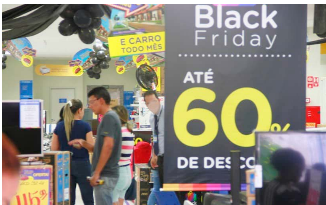
A promoção do comércio será nos dias 29 e 30 de novembro

mil pessoas de todo o país mostra que produtos de alimentação e eletrônicos são os mais desejados nesta Black Friday, citados por 18,2% e 18,1%, respectivamente. Em seguida vem os artigos para casa (15,3%), vestuário (7,4%), higiene