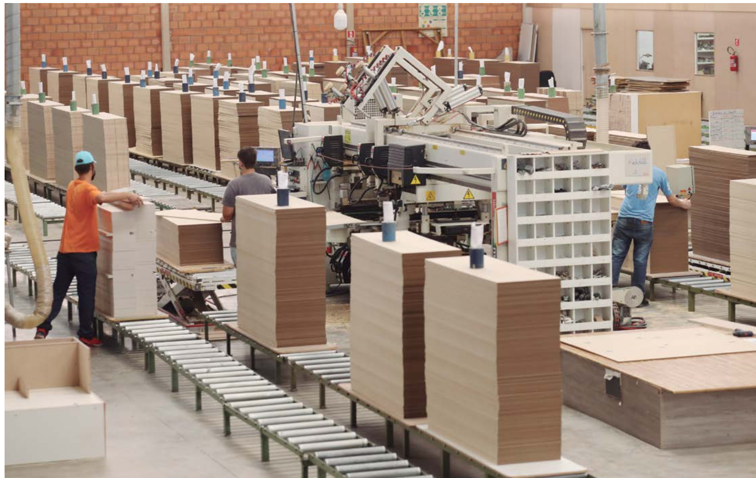
A indústria paranaense vem se destacando em diversos ramos em 2024

Esses resultados da produção vêm acompanhados de bons números em termos de emprego. De acordo com estatísticas do Cadastro Geral de Empregados e Desempregados (Caged), do Ministério do Trabalho,