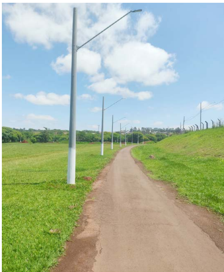
os super postes foram colocados em toda a extensão do Parque do Povo

um trabalho diferenciado no Parque do Povo, que ainda vai ganhar outras melhorias", destaca o prefeito, acrescentando que com a iluminação que está sendo implantada no local, a prática esportiva poderá ser feita à noite. "A iluminação traz muita segurança", disse.