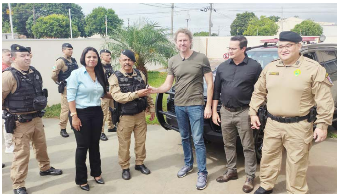
A viatura foi entregue na manhã da última segunda-feira dia 4