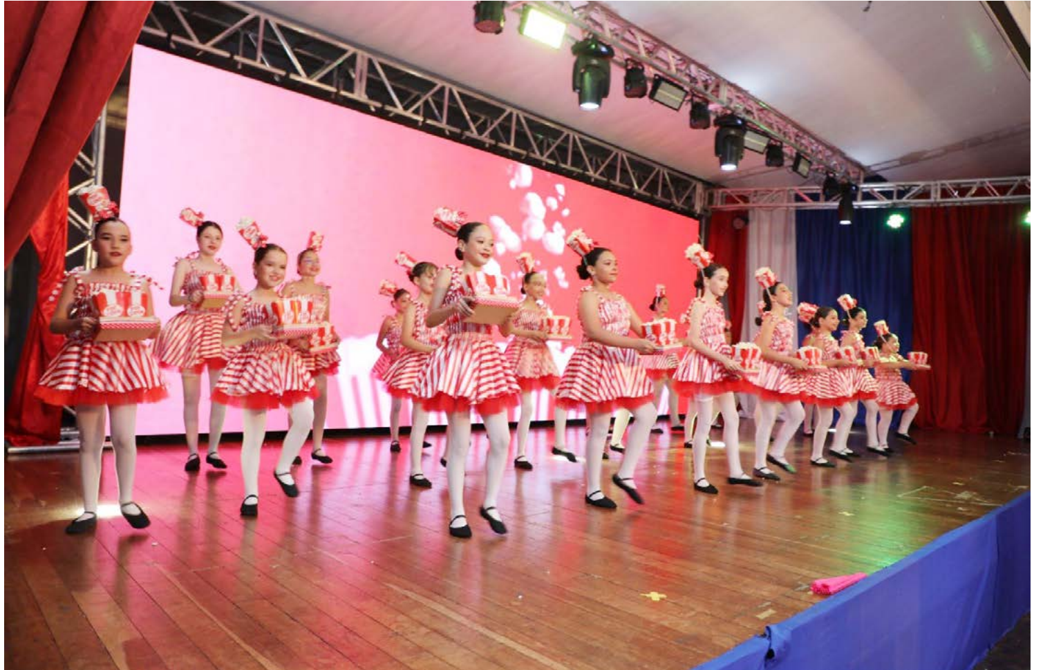
Entre palhaços, domadores de leão e equilibristas, os pequenos se apresentaram para pais e a comunidade.

apresentação de encerramento das atividades do ano: a peça Circo Tempo de Alegria. Entre palhaços, domadores de leão e equilibristas, os pequenos se apresentaram para pais e a comunidade.