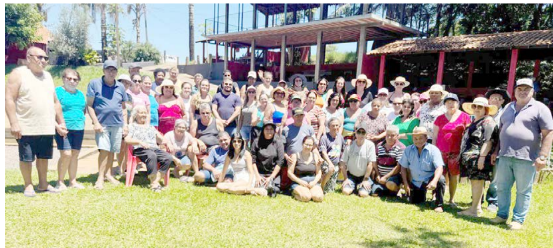
O grupo encerrou o ano comemorando diversas conquistas em 2024

A confraternização encerra um ano de muitas conquistas para o grupo, reafirmando o compromisso de Rancho Alegre do Oeste com o bem-estar e a valorização da terceira idade.