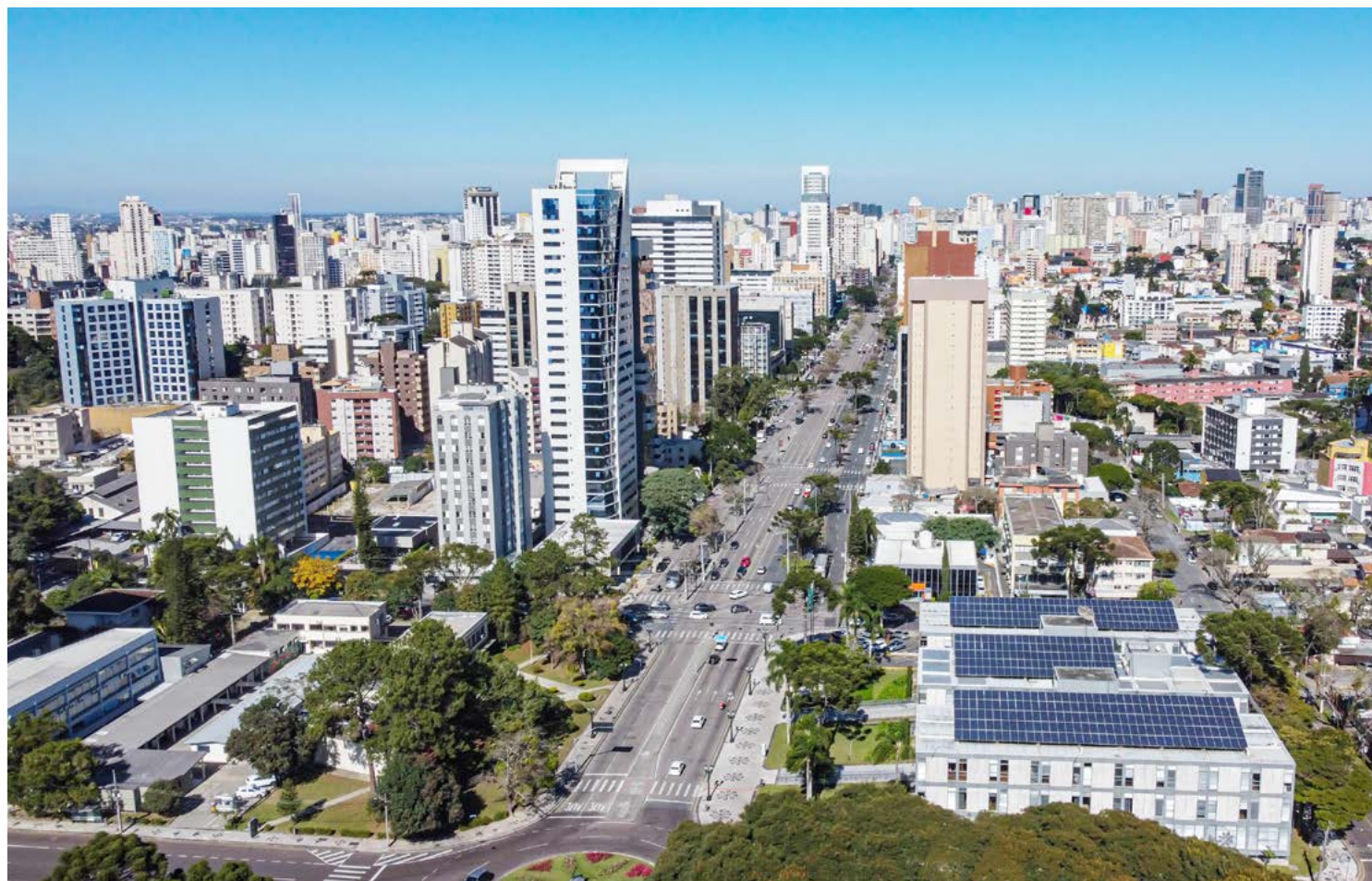
Espécie de IDH municipal, o Índice IparDES de Desempenho Municipal avalia o desenvolvimento socioeconômico dos 399 municípios paranaenses nas dimensões de Renda, Educação e Saúde, formando um indicador Geral.

Na outra ponta, a quantidade de cidades classificadas como médio-baixo