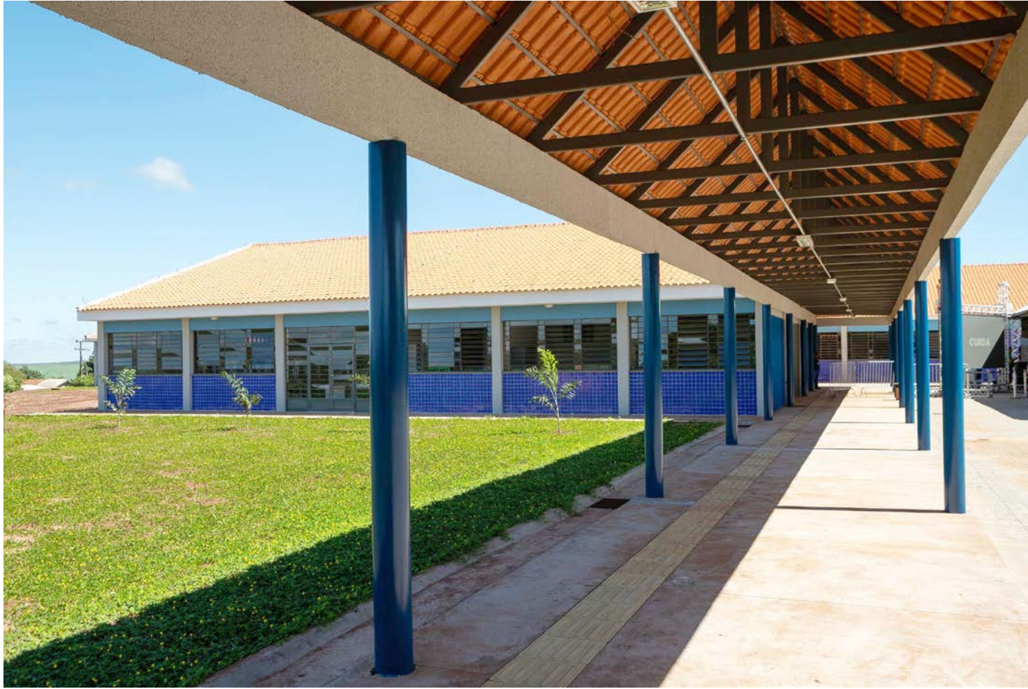
As inscrições se encerram no dia 10 de janeiro de 2025: oportunidade

Ainda conforme Ademir, a expectativa é grande, com o número de interessados superando as previsões iniciais. “Estamos confiantes e acreditando que formaremos duas turmas com tranquilidade”, comenta.