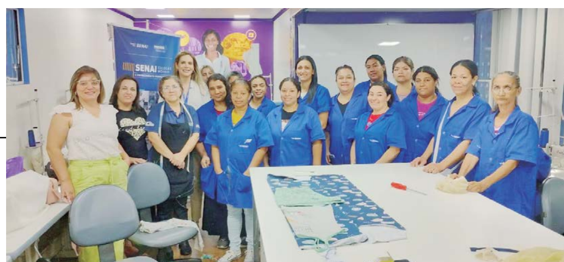
O Senai foi uns dos grandes parceiros na realização dos cursos em Goioerê

VAGAS DE TRABALHO: - Em relação às vagas de trabalho, Agência o Trabalhador, que está no guarda chuva da Secretaria de Indústria e Comércio, está deixando cerca de 200 vagas