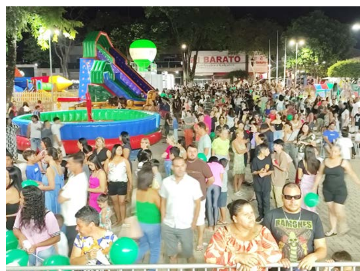
Muita gente esteve na praça da Matriz para ver o show

“Sem dúvida, uma iniciativa necessária, já que a ampliação do horário permite que nossos comerciantes ofereçam um atendimento diferenciado e recebam os visitantes com mais conforto, além de contribuir para o crescimento das vendas e da economia local”, afirma.