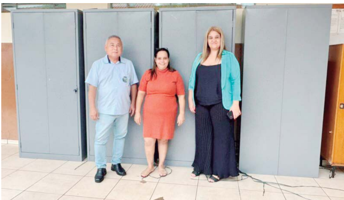
Os novos mobiliários estão sendo entregues nas secretarias municipais

Os novos móveis incluem cadeiras, mesas, armários e outros itens essenciais, que serão distribuídos entre as secretarias que mais necessitam da substituição dos equipamentos antigos.