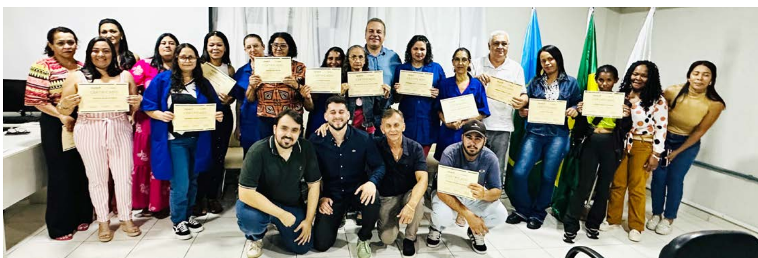
No total 1.230 pessoas foram qualificadas durante todo o ano de 2024

MEI – Em relação ao MEI – Micro Empreendedor Individual, os números mostram o setor foi dos mais produtivos, registrando 7.008 atendimentos em 2024.