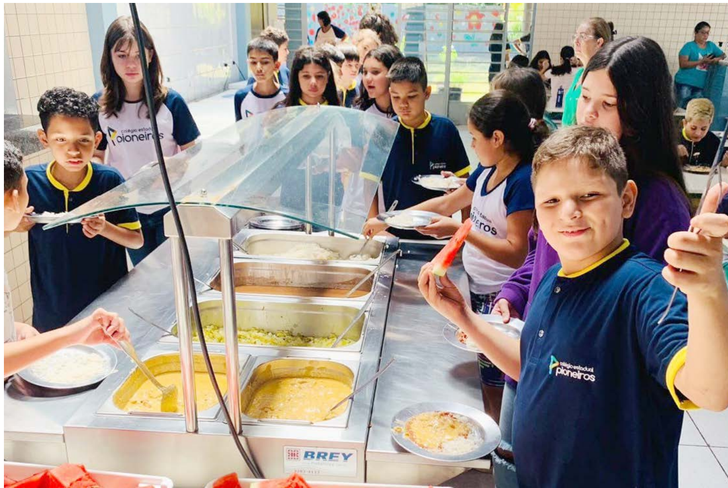
Montante será destinado para a aquisição de alimentos provenientes da agricultura familiar, mediante chamada pública.

Desta forma, o Governo Estadual investiu R$ 175 milhões a mais nesse ano, valor que representou aumento de 175% nos