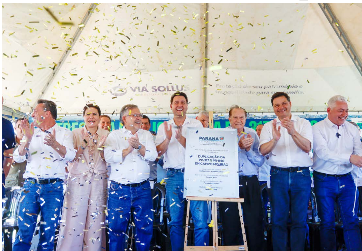
Governador inaugura a duplicação da PR-317 e PR-840 em Campo Mourão

Em sua fala, o atual gestor do município disse que a duplicação das duas rodovias estaduais que