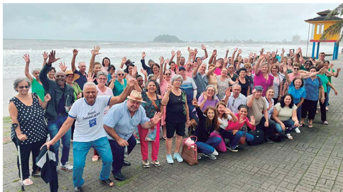
O grupo de idosos de Moreira Sales que participou da excursão