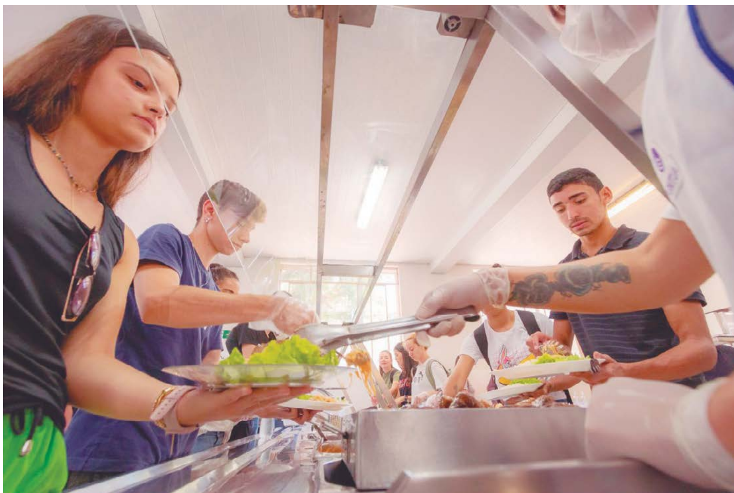
Projeto de lei busca subsidiar alimentação para estudantes das universidades estaduais

O projeto não gera impacto orçamentário-financeiro para o Estado, uma vez que o custeio dos programas de alimentação será proveniente das dotações orçamentárias das universidades, decorrentes da Lei Orçamentária