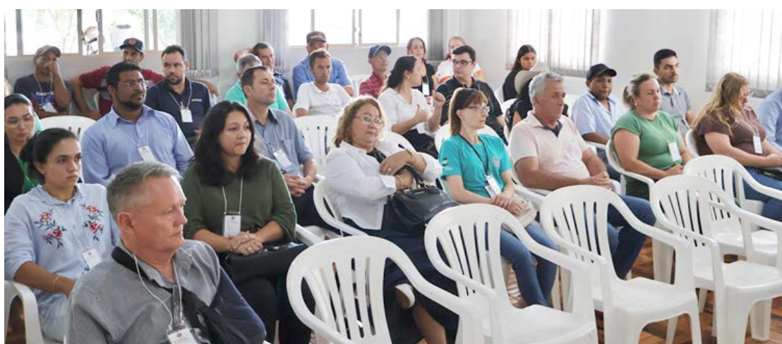
No total quatro municípios tiveram representantes na conferência realizada em Janiópolis

A conferência Intermunicipal que antecede as atividades da 5ª Conferência Nacional do Meio Ambiente, que será realizada ano que vem, após a etapa Estadual reforçou o compromisso dos municípios envolvidos com a preservação ambiental, mostrando que, unidos, é possível construir um futuro mais sustentável.