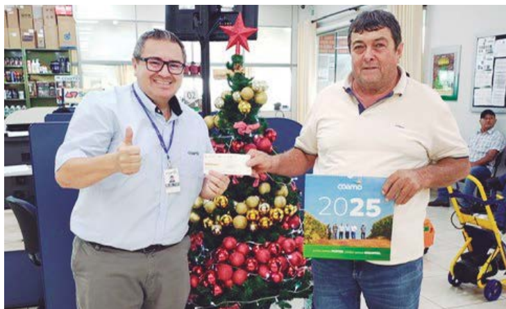
O pagamento das sobras foi feito em todas as unidades da Coamo no Paraná, Mato Grosso do Sul e Santa Catarina: 13º dos cooperados