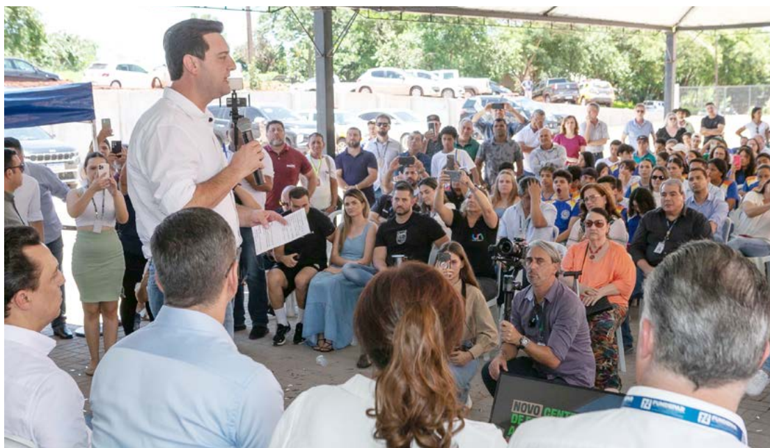
O governador fala durante o evento realizado ontem em Goioerê

O próprio NRE, que abrange os municípios de Goioerê, Boa Esperança, Janiópolis, Juranda, Mariluz, Moreira Salles, Quarto Centenário, Rancho Alegre d'Oeste e Ubitatã, vai ganhar uma sede própria. O governador autorizou o repasse de R$ 3,7 milhões para a construção da sede do núcleo na cidade.