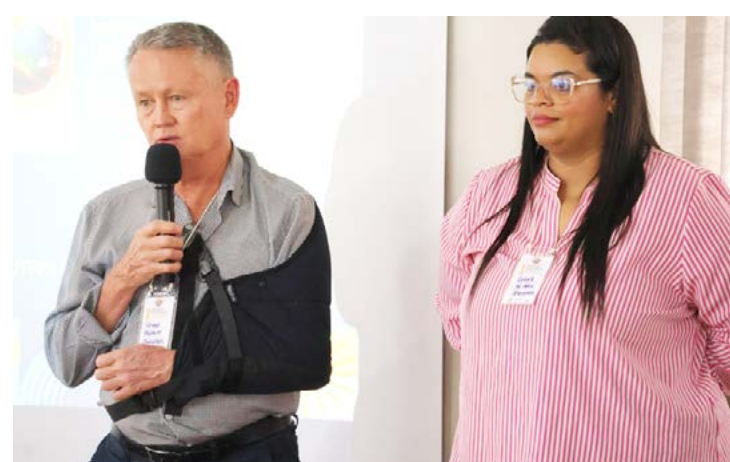
O evento contou com várias palestras e participação de convidados

Após a palestra, os participantes se dividiram em grupos para debater os principais eixos