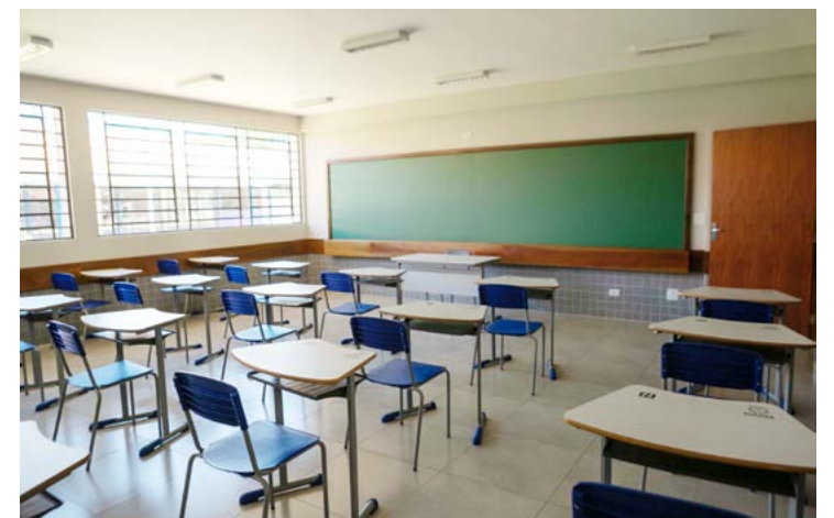
No total são 10 salas de aulas