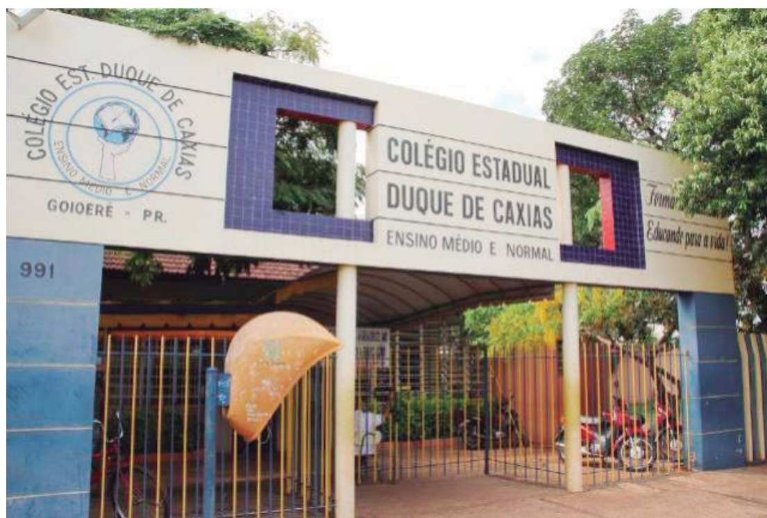
As matrículas podem ser feitas na secretaria do colégio, de segunda a sexta-feira, das 7h30 às 11h30 e das 13h às 21h.

Para a efetivação da matrícula é necessário apresentar documentos pessoais, comprovante de endereço, histórico do ensino fundamental e uma declaração de trabalho.