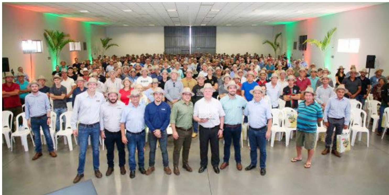
Copacol é reconhecido pelo desempenho que vai muito além do laboratório e gera impactos positivos na agricultura nacional

A homenagem destacou a parceria no desenvolvimento da molécula Revysol, criada pela BASF em 2021 para combater doenças que afetam os principais cultivos bra-