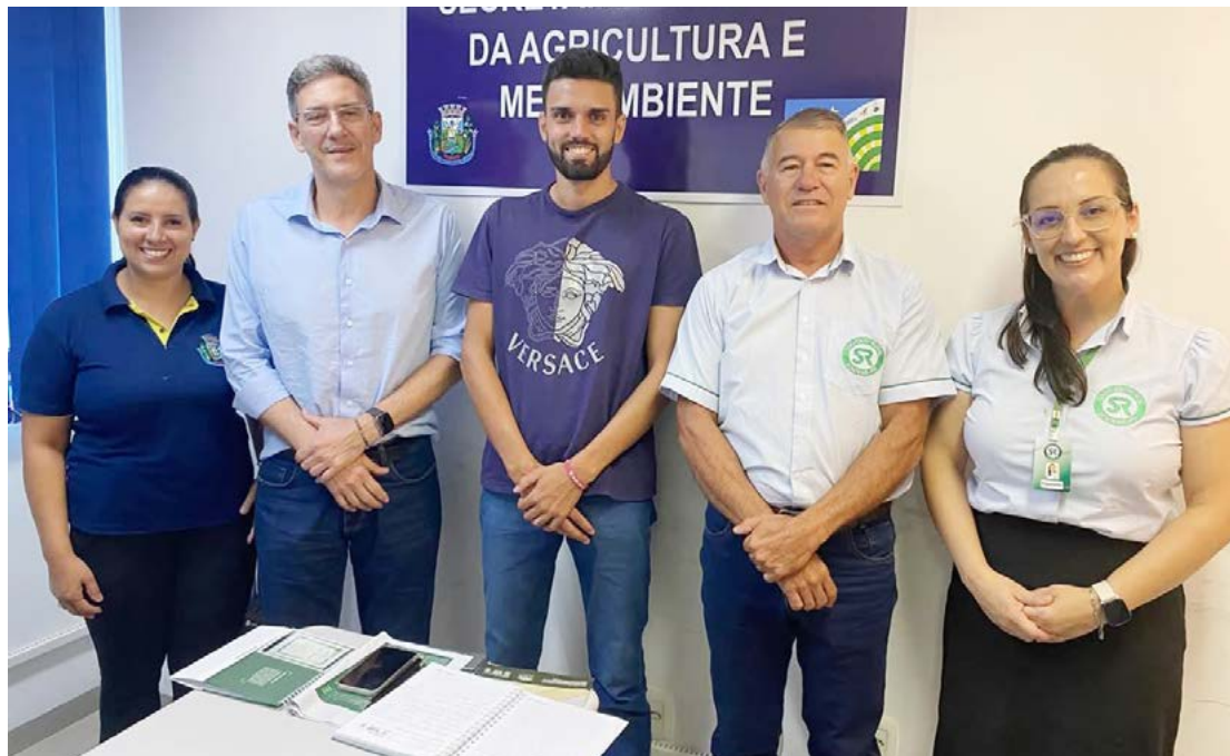
Em Quarto Centenário a reunião foi para definir os cursos a serem realizados em 2025

O presidente do Sindicato Rural de Goioerê,