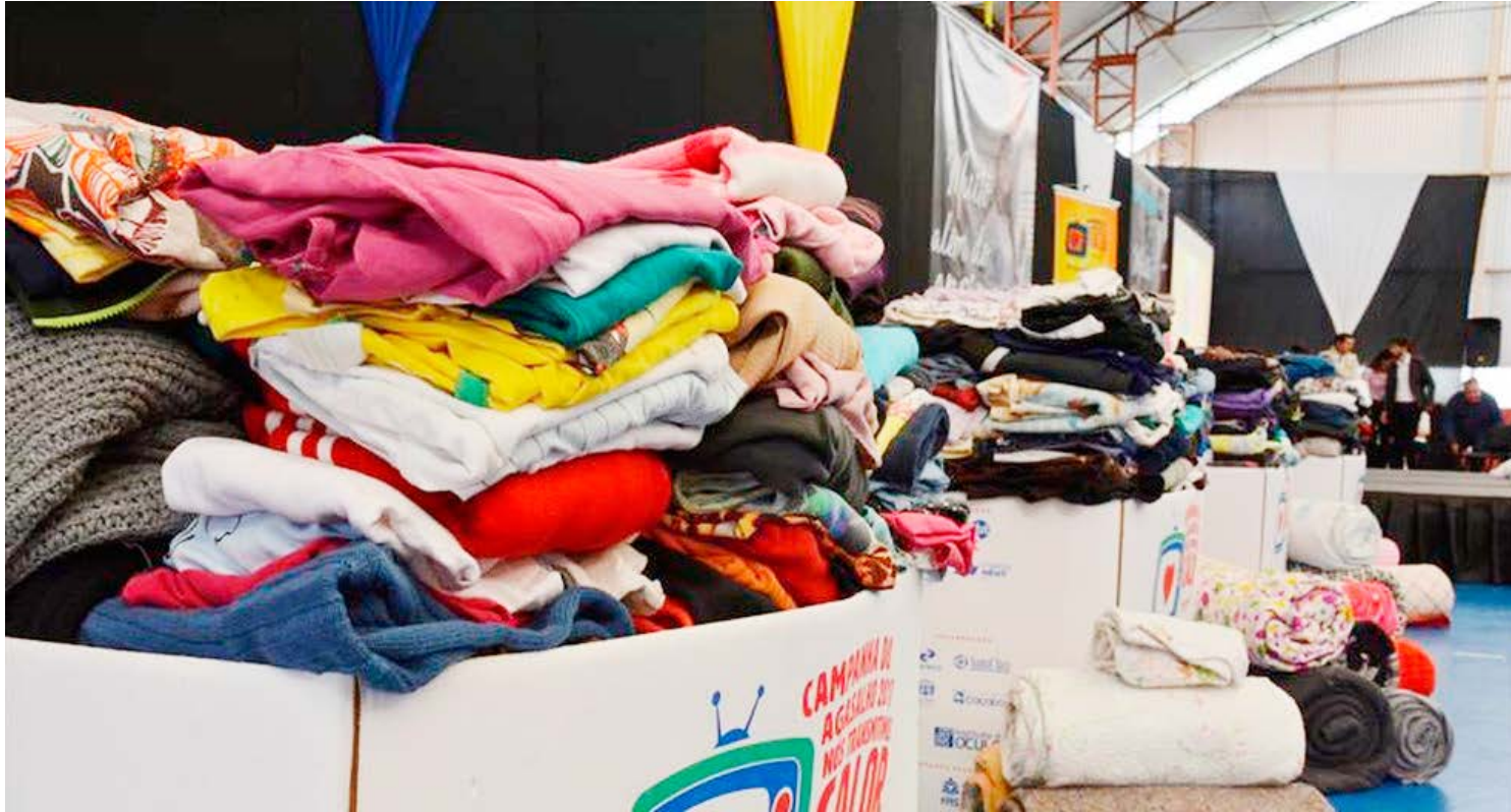
As roupas e calçados serão distribuídos para os envolvidos no projeto social Viva Vila