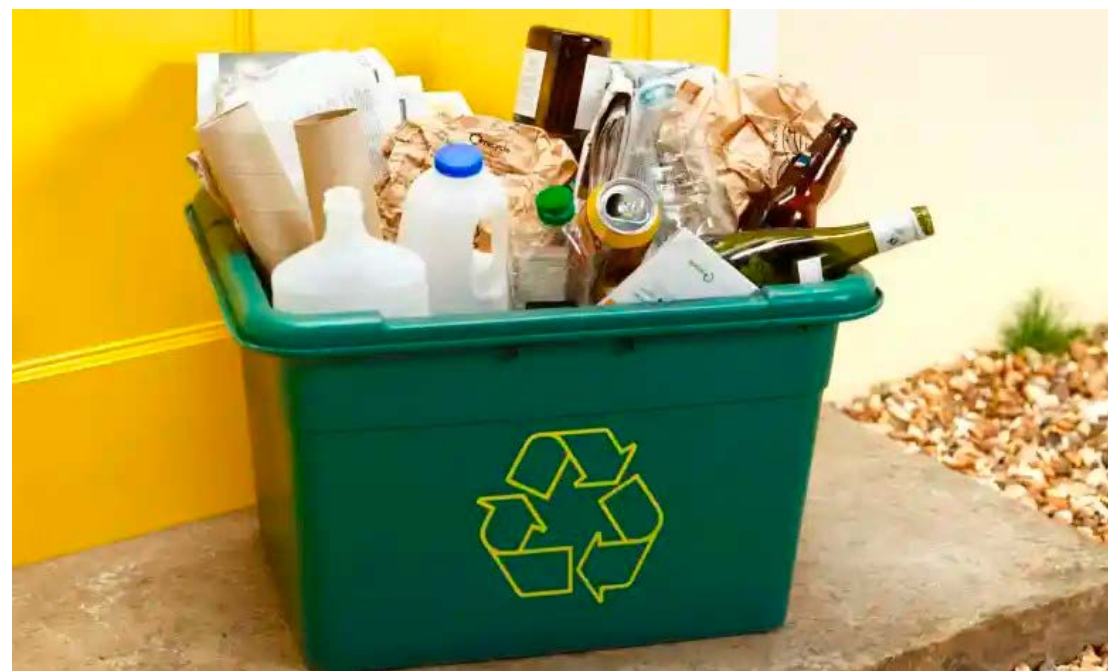
Foi divulgado pela Prefeitura de Goioerê, as novas rotas da coleta seletiva na cidade

Ambiente, cita que a iniciativa pretende envolver toda a comunidade na separação dos resíduos em duas categorias principais, sendo reciclável e orgânico. Para que haja sucesso na realização da coleta, a prefeitura reforça que a colaboração da população é fundamental, inclusive promovendo a separação adequada dos resíduos, fazendo de Goioerê uma cidade mais limpa, sustentável e com maior qualidade de vida para todos os moradores.