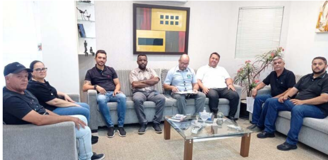
Os vereadores se reuniram no início desta semana: definição das comissões

Coluna publicada simultaneamente em 22 jornais e portais associados. Saiba mais em www.adipr.com.br