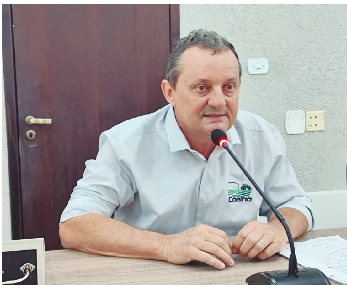
O novo prefeito herda um 'pacote' de projetos com recursos garantidos para várias obras, além de dinheiro em caixa