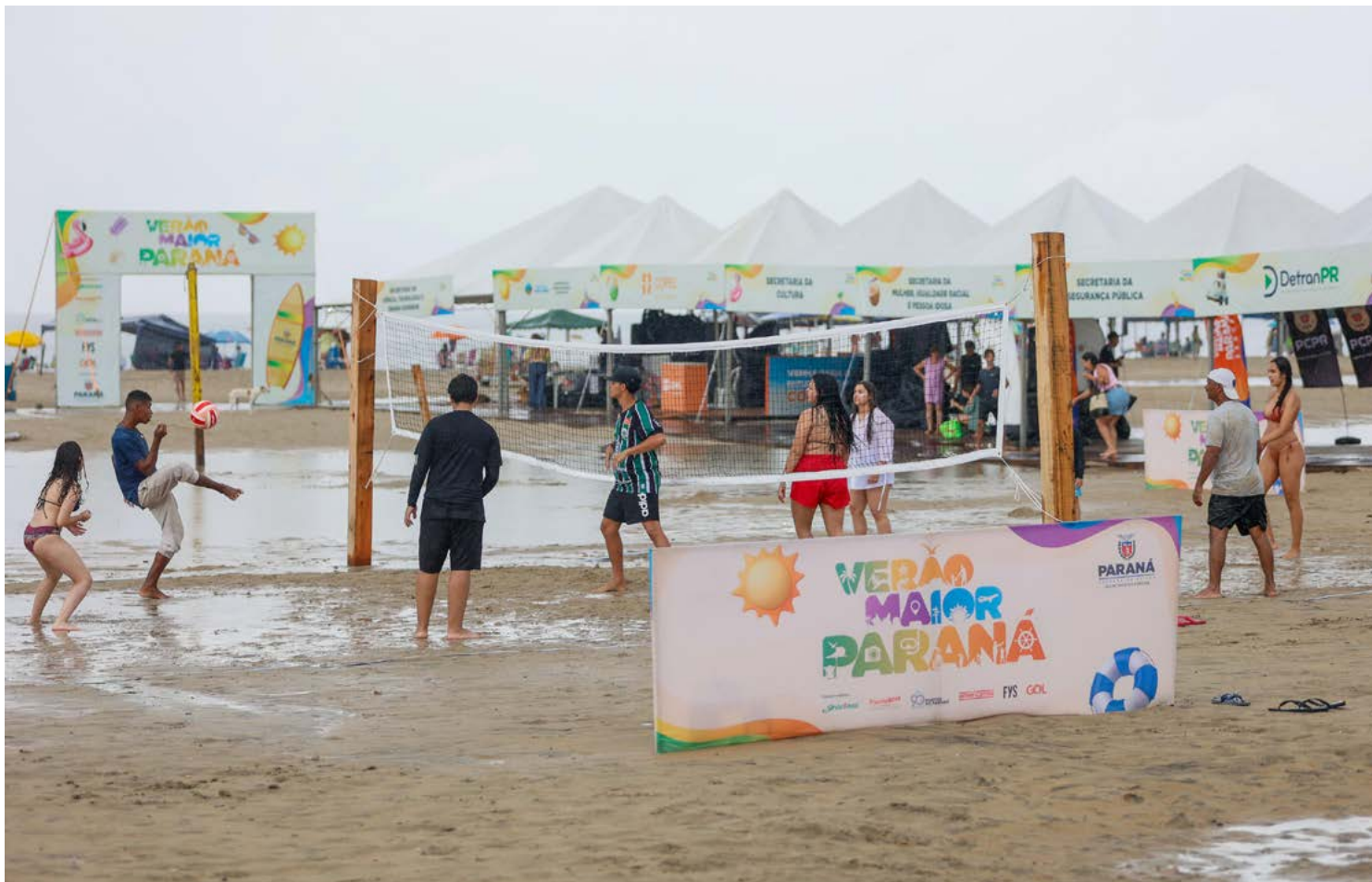
Embora a chuva não seja necessariamente um impeditivo para frequentar a praia, é essencial redobrar a atenção, especialmente em caso de tempestades ou descargas elétricas, já que durante os dias de chuva o risco de raios exige atenção especial.

Durante os dias de chuva, o risco de raios exige atenção especial. “Em caso de descarga