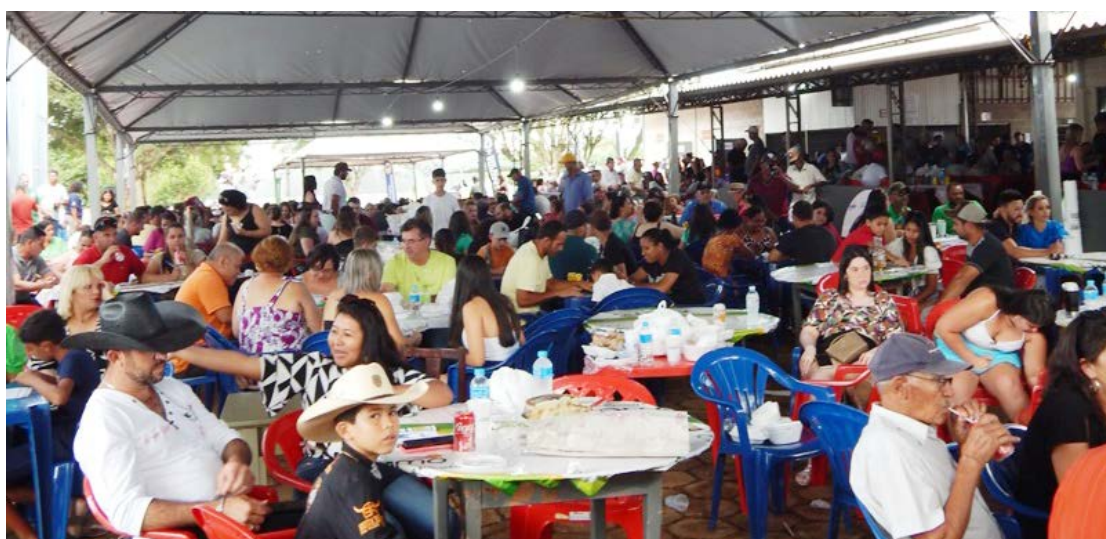
A festa é tradicional e todos os anos reúne uma grande quantidade de pessoas

À tarde, as atividades continuam com o leilão, às 13h, e o aguardado show de prêmios, marcado para as 17h30. Este ano, o bingo distribuirá R$ 8 mil em dinheiro, e as cartelas já estão à venda na comunidade.