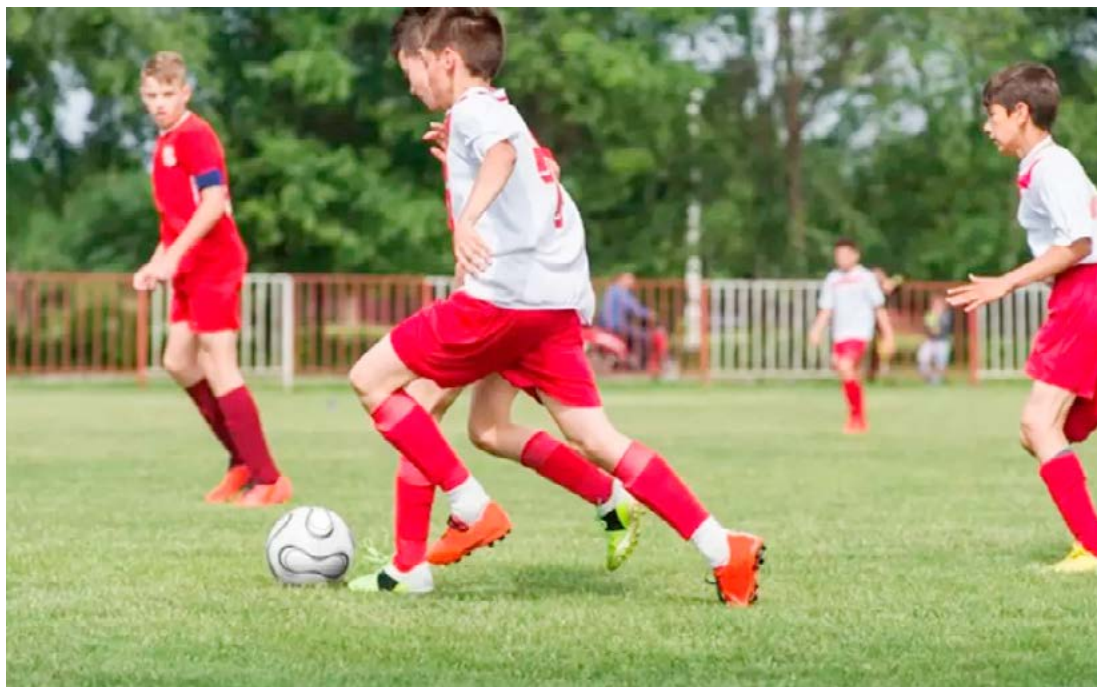
A competição será aberta no dia 19 de janeiro em Goioerê

INSCRIÇÕES ABER-TAS: - As equipes interessadas ainda podem garantir sua participação. Não perca a chance de competir nesse grande evento do futebol de base! Para mais informações, entre em contato pelos telefones (44) 99956-5650 ou (44) 99820-7772. (Informações: Manacialnews).