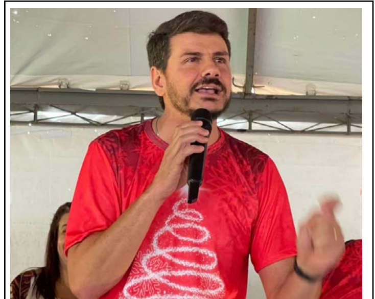
Rafael Bolacha está encerrando seu mandato com aprovação de 87,3% Rafael Bolacha conclui mandato com 87,3% de aprovação em Moreira Sales

valor do IPTU – Imposto Predial e Territorial Urbano em 50% e ainda implantar um vale alimentação de R$ 500,00 para os servidores.