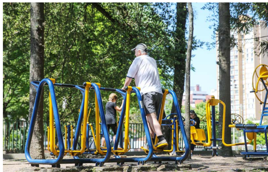
Esse público é mais vulnerável aos efeitos indesejados do calor, pois os mecanismos que regulam a temperatura corporal, a pressão arterial e a sede podem perder eficiência com o envelhecimento.

- O calor traz também risco aumentado de intoxicações alimentares. Manter os alimentos refrigerados e ficar atento aos cuidados de higiene na sua manipulação. Lavar sempre as mãos e evitar consumir alimentos e bebidas de origem duvidosa.