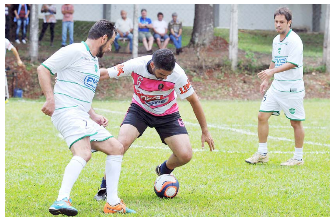
O torneio está agendado para acontecer no próximo domingo (23)

responsáveis pela organização, reforça que o Torneio da Amizade tem o intuito de fortalecer os laços entre as