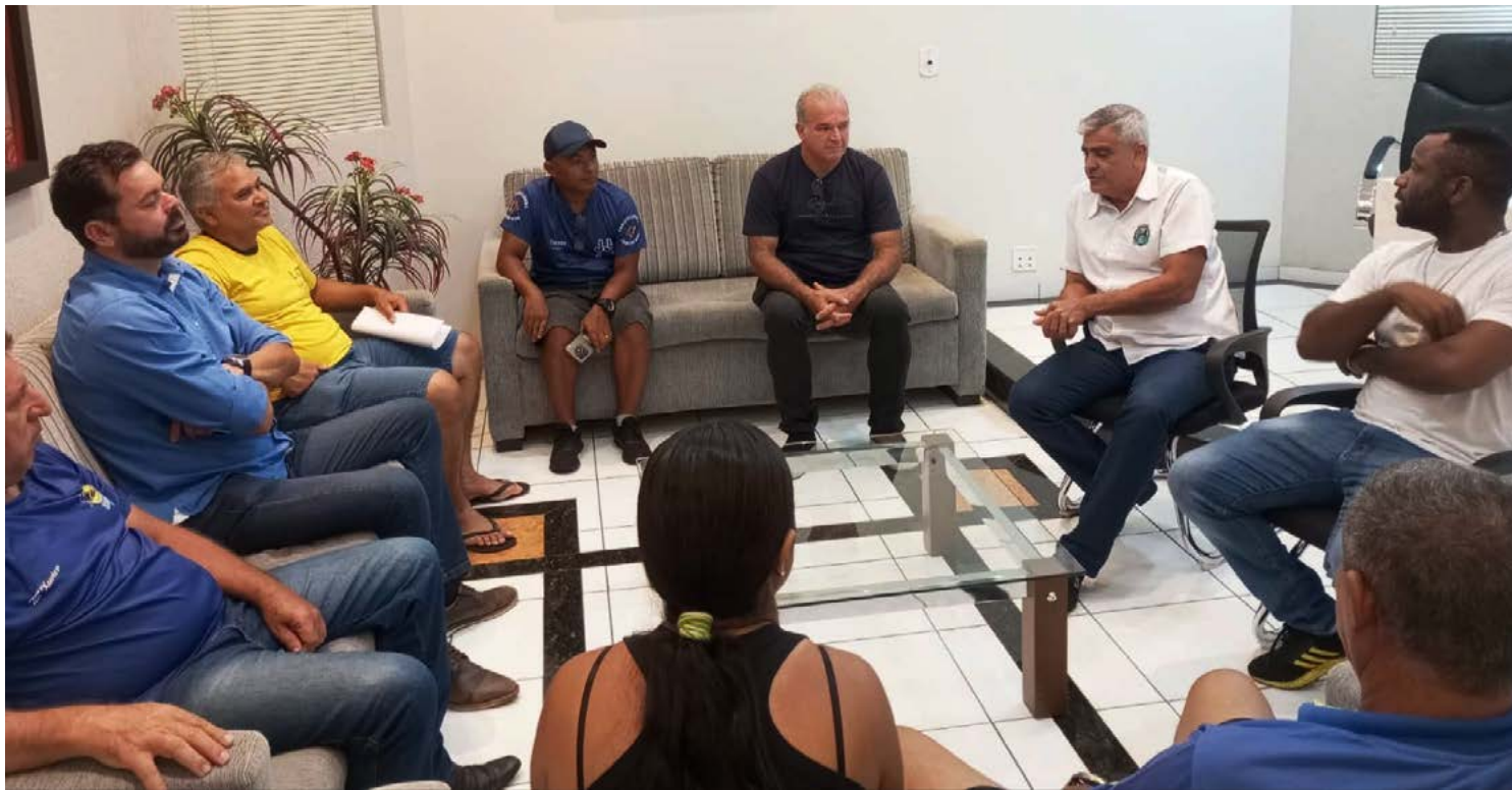
A reunião foi realizada no gabinete do presidente da Câmara de Goioerê

A iniciativa veio em resposta a inúmeras reclamações dos pais, que apontam dificuldades na rotina de chegada e saída dos alunos. “Reunimos os