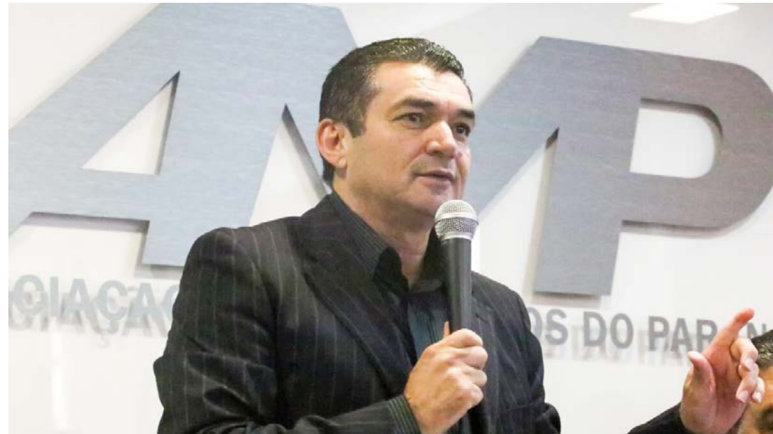
A reunião acontecerá nesta quarta-feira (19) em Curitiba

O evento será na Fesp – Fundação de Assuntos Sociais do Paraná, no centro de Curitiba. O início está previsto para às 9 horas.