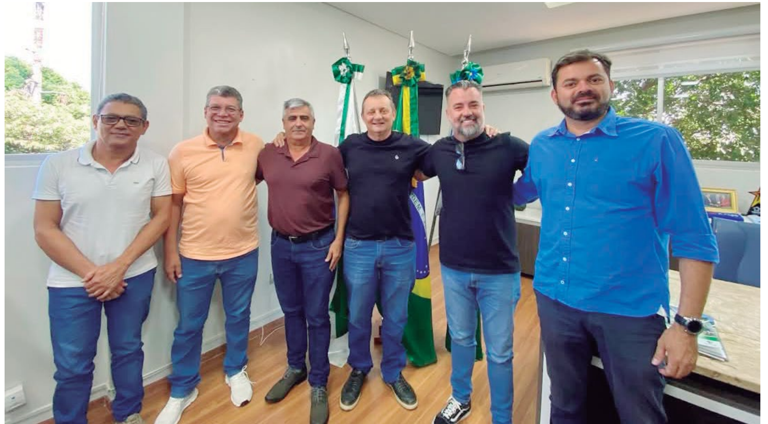
O encontro aconteceu nesta segunda-feira no gabinete municipal

Coluna publicada simultaneamente em 22 jornais e portais associados. Saiba mais em www.adipr.com.br