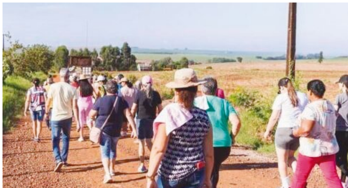
A caminhada esta marcada para o dia 13 de de abril

Ainda em abril está prevista a segunda caminhada, desta vez na cidade de Roncador,