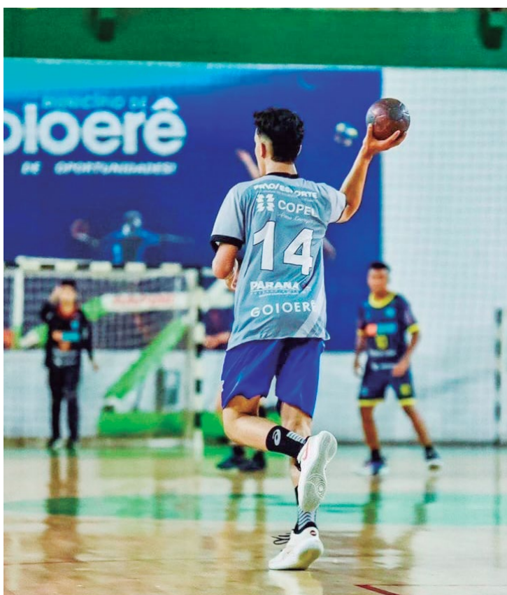
A competição será aberta na sexta-feira: maior evento de handebol do estado

A competição será disputada em cinco pra-