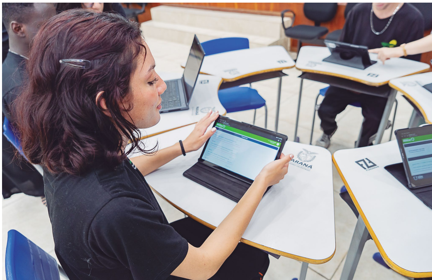
Atualmente, mais de 500 mil estudantes paranaenses dos últimos anos do ensino fundamental e do ensino médio já utilizam diferentes ferramentas com esta tecnologia em sala de aula para facilitar o processo de aprendizagem.

Segundo o governador Carlos Massa Ratinho Junior, a implantação da IA no currículo educacional, tanto para os estudantes quanto para os professores, faz parte de uma estratégia mais ampla do Governo do Estado que busca utilizar tecnologias inovadoras para manter o Paraná no topo do ranking do Índice de Desenvolvimento da Educação Básica (Ideb). Ele apresentou esse panorama no Encontro Anual Educação Já, promovido pela ONG To-