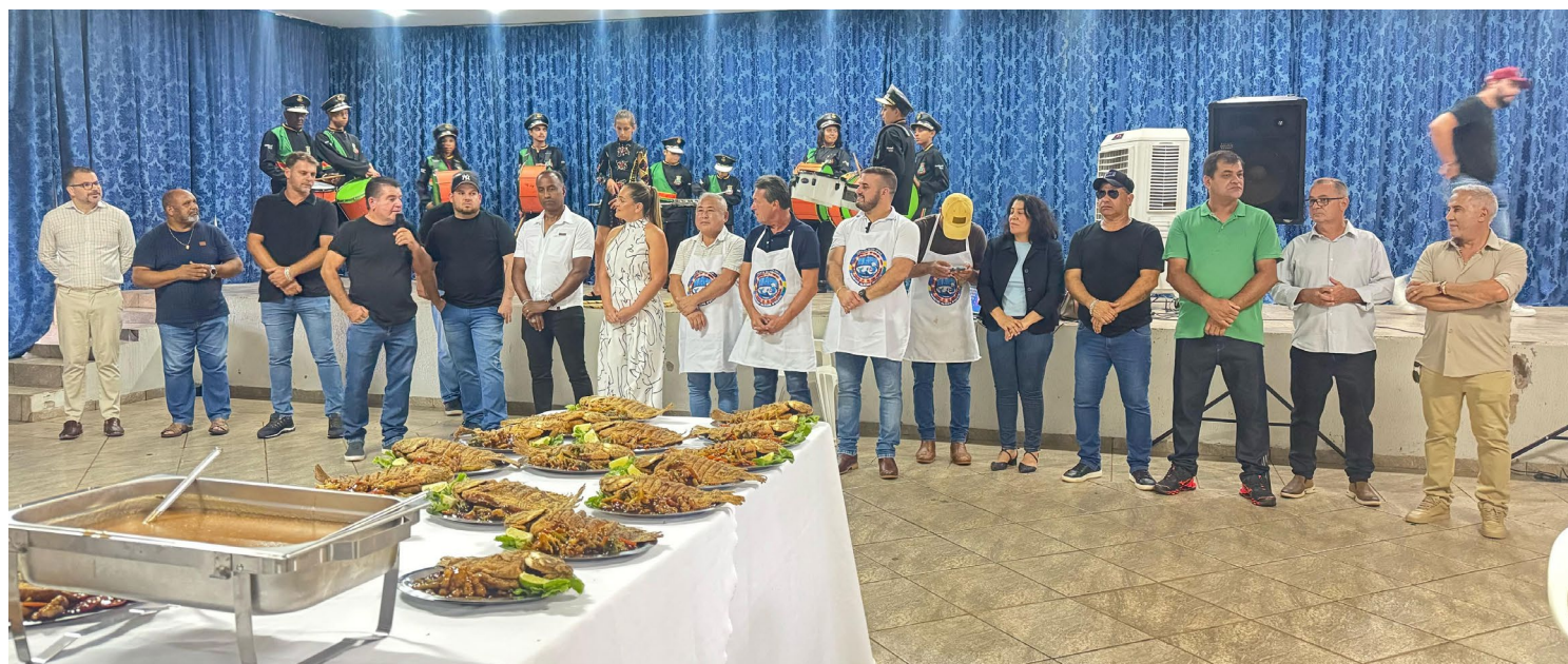
A segunda edição da festa foi lançada no último domingo: prato típico

o anúncio dos shows foram feitos no último domingo, durante evento que contou com a presença de vários prefeitos, vereadores e também do deputado estadual e secretário do Turismo, Márcio Nunes.