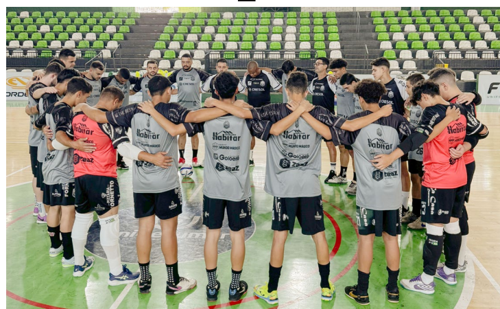
A equipe voltou aos treinos de olho no próximo embate

De acordo com a comissão técnica, a partir de agora o time goioerense enfrentará uma sequência difícil de jogos, com compromissos importantes fora de seus domínios, exigindo foco, regularidade e determinação dos atletas para garantir