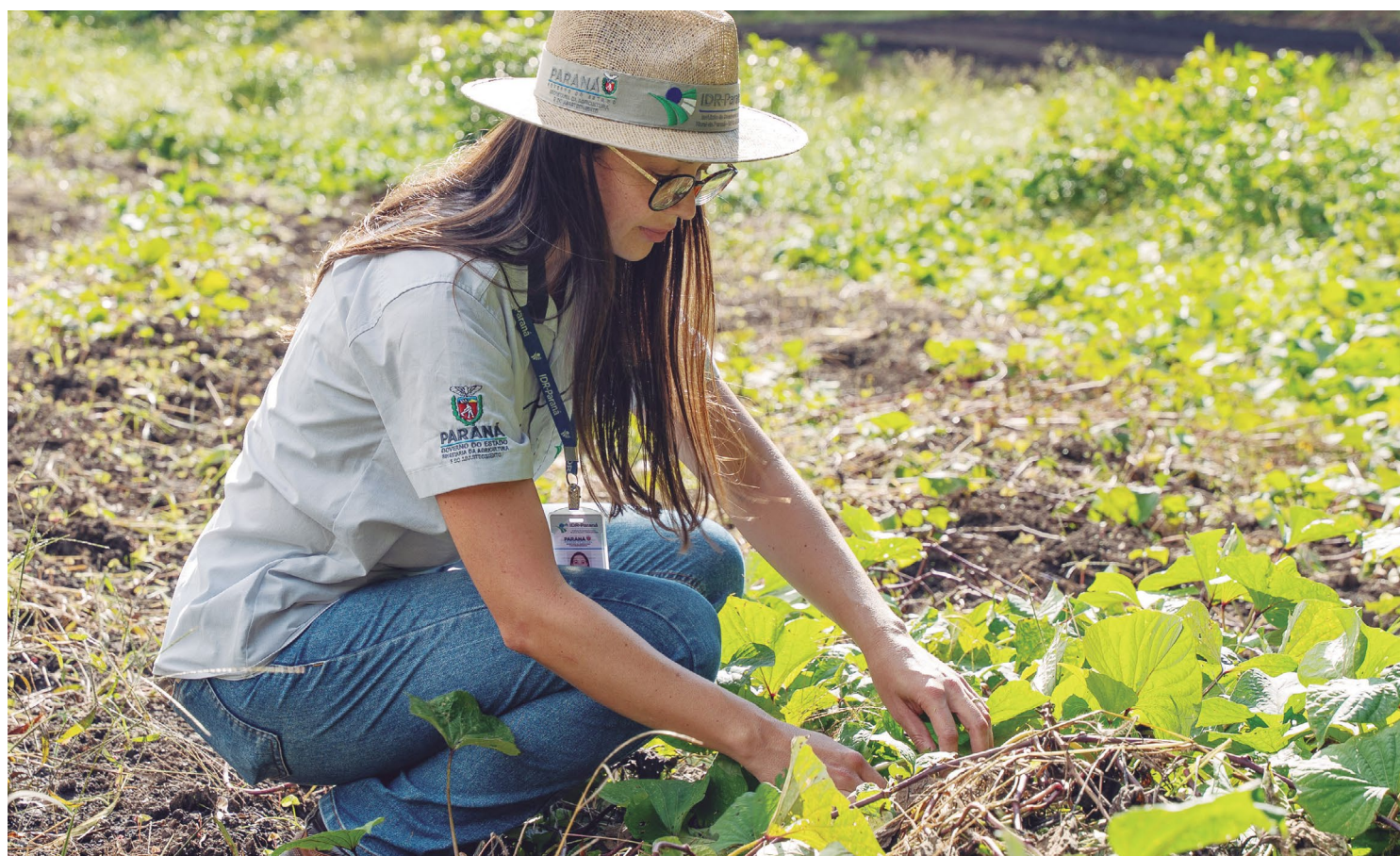
Produtos adquiridos são entregues a entidades da rede socioassistencial

Desde seu lançamento, o Compra Direta Paraná quase quadruplicou os investimentos, saltando de R$ 18,3 milhões em 2020 para R$ 70 milhões neste ano. Cerca de 19 mil toneladas de alimentos já foram