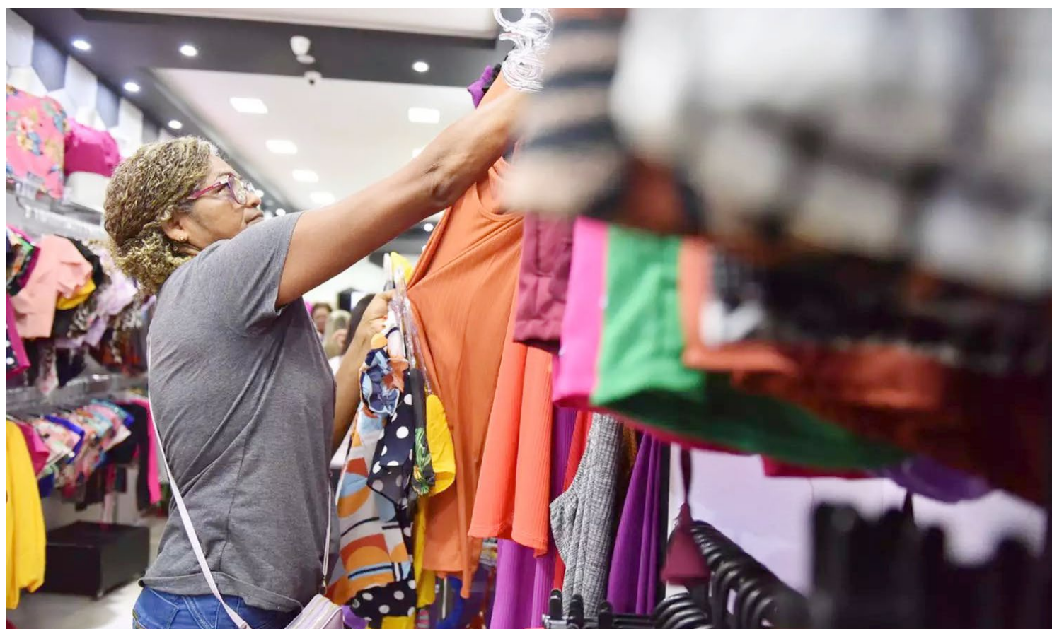
Para participar dos sorteio de prêmios, consumidores devem exigir o cupom na hora da compra

Considerada a segunda melhor data para o comércio depois do Natal, o Dia das Mães, que este ano será celebrado no dia 11 de maio, vem gerando muita expectativa para os lojistas da cidade.