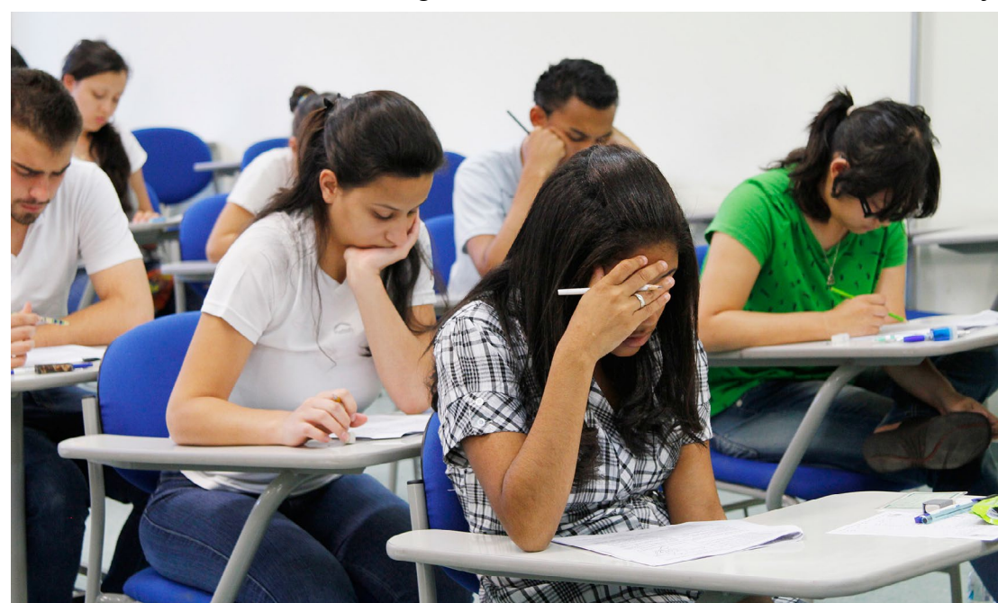
As inscrições para o exame poderão ser feitas até o dia 2 de maio

Além de contribuir para a retomada da trajetória educacional de milhares de brasileiros, o Encceja também orienta políticas públicas voltadas à educação de jovens e adultos (EJA). O exame permite ainda a elaboração de estudos e indicadores sobre o sistema educacional, sendo um importante instrumento de avaliação e referência nacional.