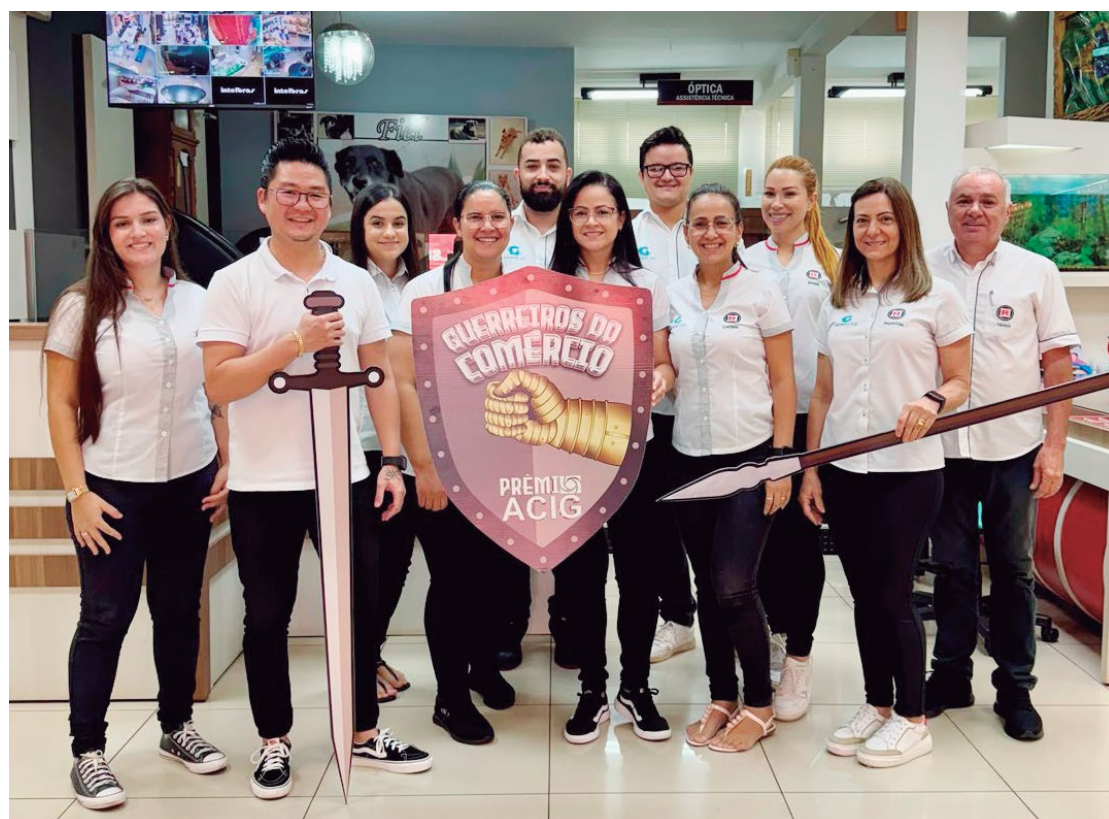
O prêmio contempla as empresas e profissionais mais lembrados pela população

O presidente da ACIG destaca a importância da participação da classe empresarial e os mais diversos profissionais, pois será uma noite para ficar marcada na história da cidade e na memória de cada um.