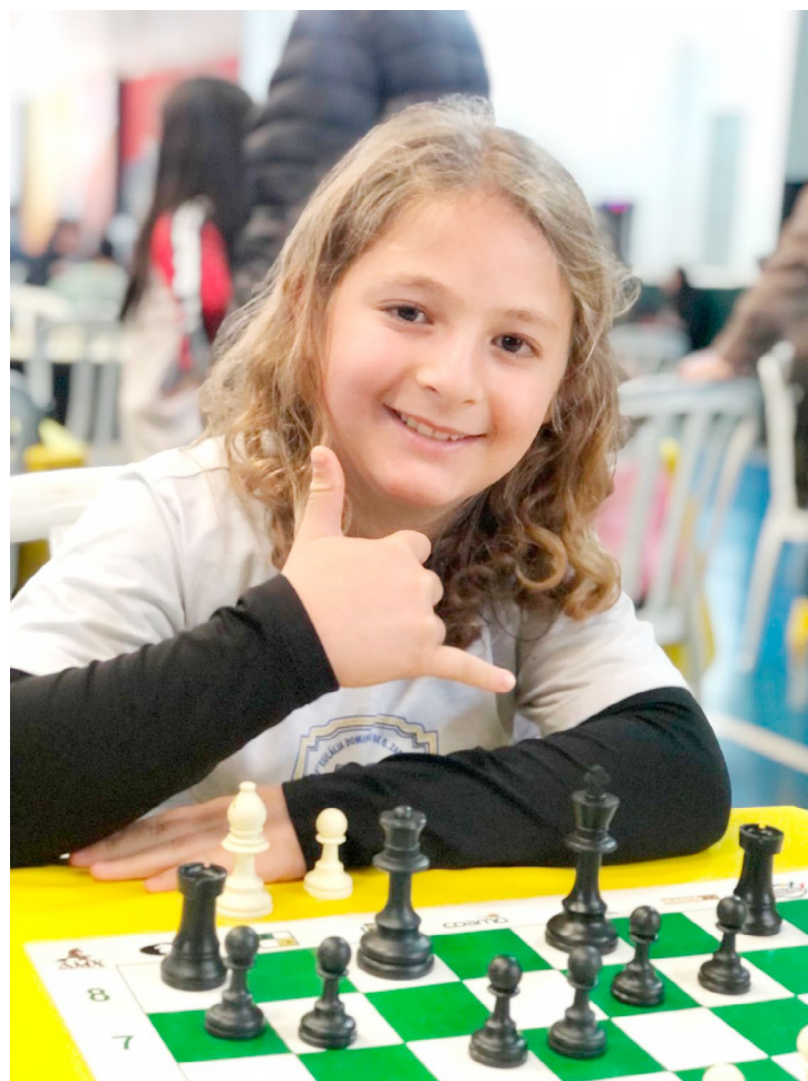
Estudantes de Moreira Sales estiveram presentes no evento em Campo Mourão