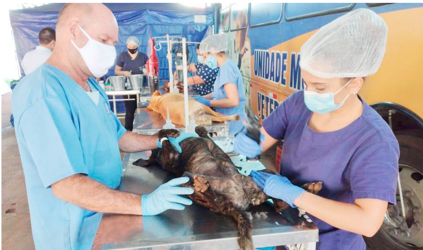
O município de Goioerê irá receber uma nova edição do CastraPet Paraná

De acordo com a Prefeitura, o município de Goioerê já participou de edições anteriores do programa, sendo que no 3º ciclo foram realizadas 217 castrações entre cães e gatos e no