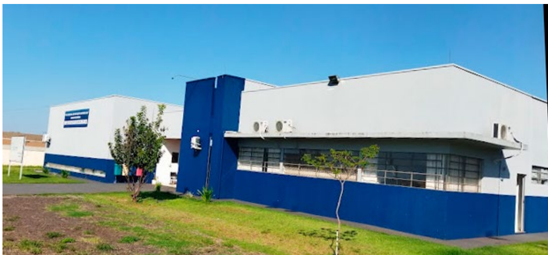
As inscrições já estão abertas e podem ser feitas até o dia 16 deste mês

A seleção dos candidatos será feita através de análise do histórico escolar do Ensino Médio, sem aplicação de provas. O curso funciona com até