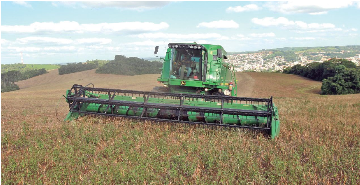
o bom desempenho da primeira safra fez com que o Estado mantivesse a participação de quase um quarto da produção nacional

De acordo com o agrônomo, um dos reflexos da