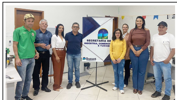
A reunião foi das mais importantes para definir os eventos que serão realizados na cidade

de casa cheia, preveem os coordenadores e dirigentes da equipe goioerense.