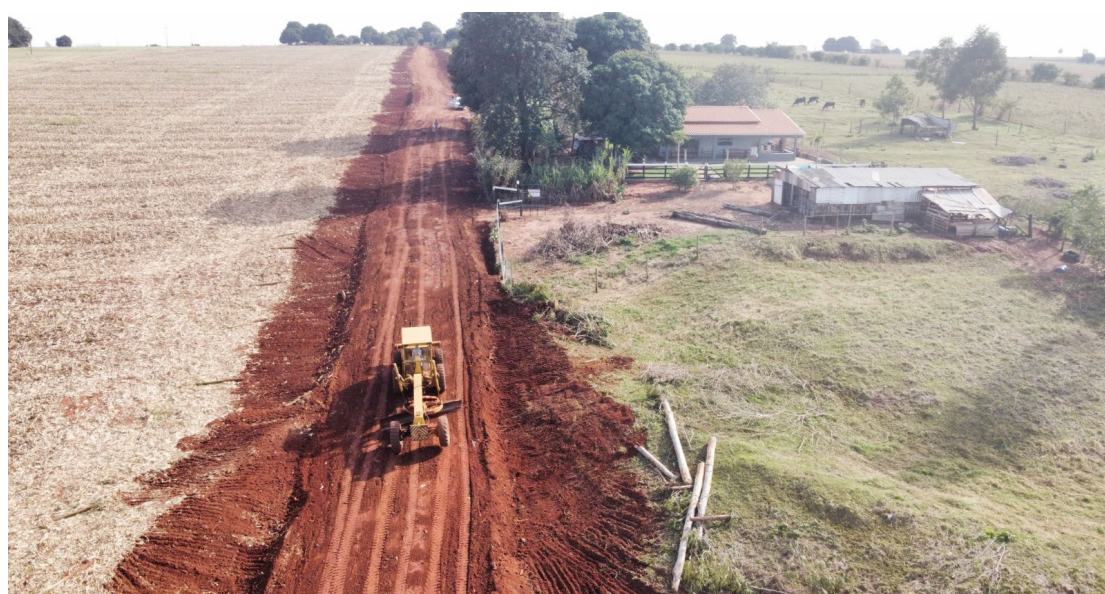
Os serviços estão sendo realizados na Estrada do Aeroporto: melhorias

Ao todo, o projeto prevê 21 etapas de readequação, abrangendo uma extensão de 43 quilômetros. A primeira etapa já foi concluída no bairro Venda Branca e atualmente os serviços estão sendo realizados na