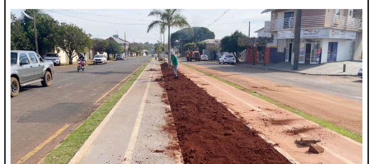
A grama de toda a extensão da pista foi trocada: padronização