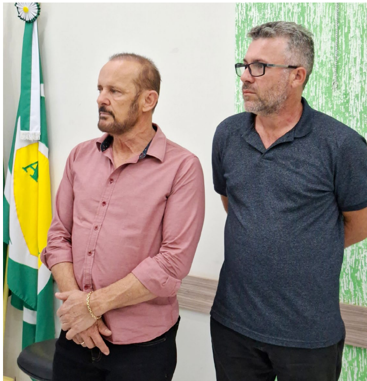
O prefeito Luiz Volpato participou do evento e reforçou o compromisso da gestão em valorizar os comerciantes locais

A palestra faz parte de uma série de ações que visam capacitar e aproximar os empreendedores das oportunidades geradas pelo poder público, fortalecendo o desenvolvimento local por meio do empreendedorismo e da transparência nos processos de compras governamentais.