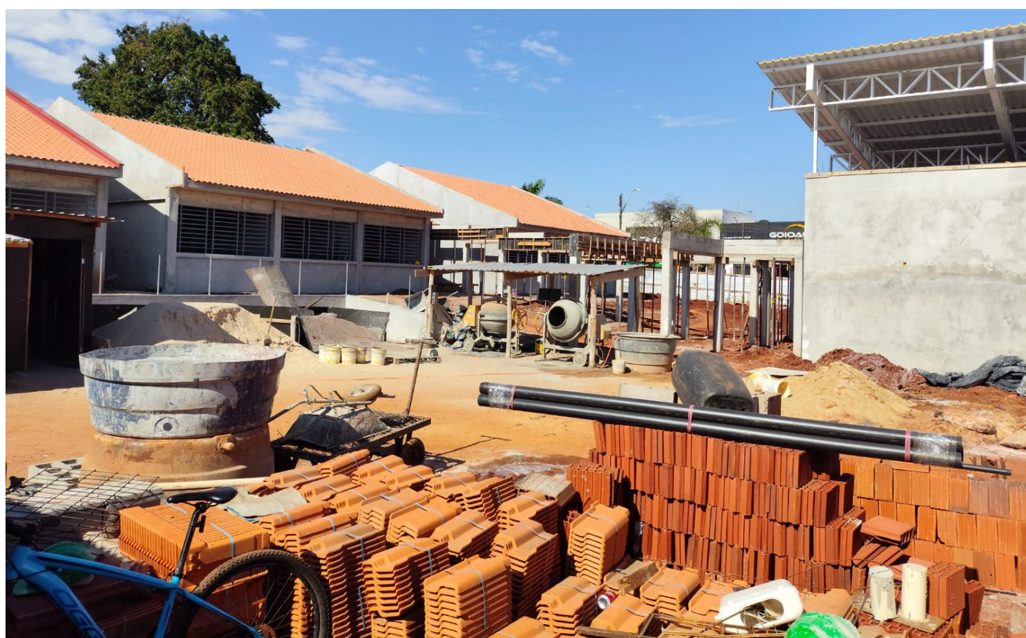
Com um investimento de R$ 3,8 milhões, a nova sede promete trazer modernidade e eficiência ao atendimento das demandas educacionais

Segundo dados do Governo Estadual, que realiza a obra, a estrutura terá 1.000 metros quadrados de área construída, com o projeto contemplando um setor administrativo, salas para professores, estacionamento e espaços planejados para atender com qualidade tanto os profissionais da educação quanto os estudantes da