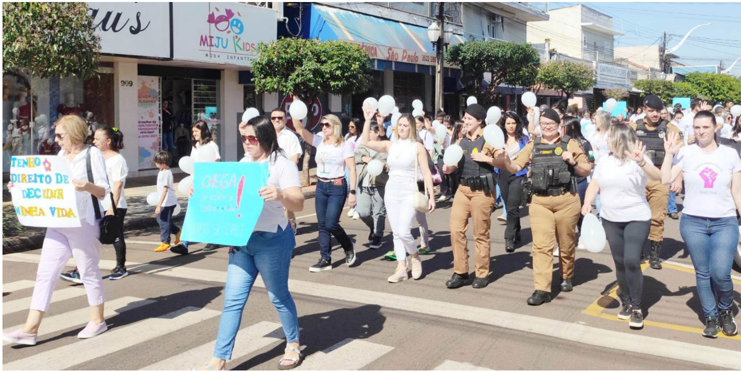
Esta será a terceira caminhada a ser realizada em Goioerê: ação contra o feminicídio

A ação integra a mobilização estadual “Paraná Unido Contra o Femicídio”, que reúne municípios de todo o estado em um chamado coletivo contra a violência de gênero. Às 12h em ponto, cidades de todas as regiões caminharão