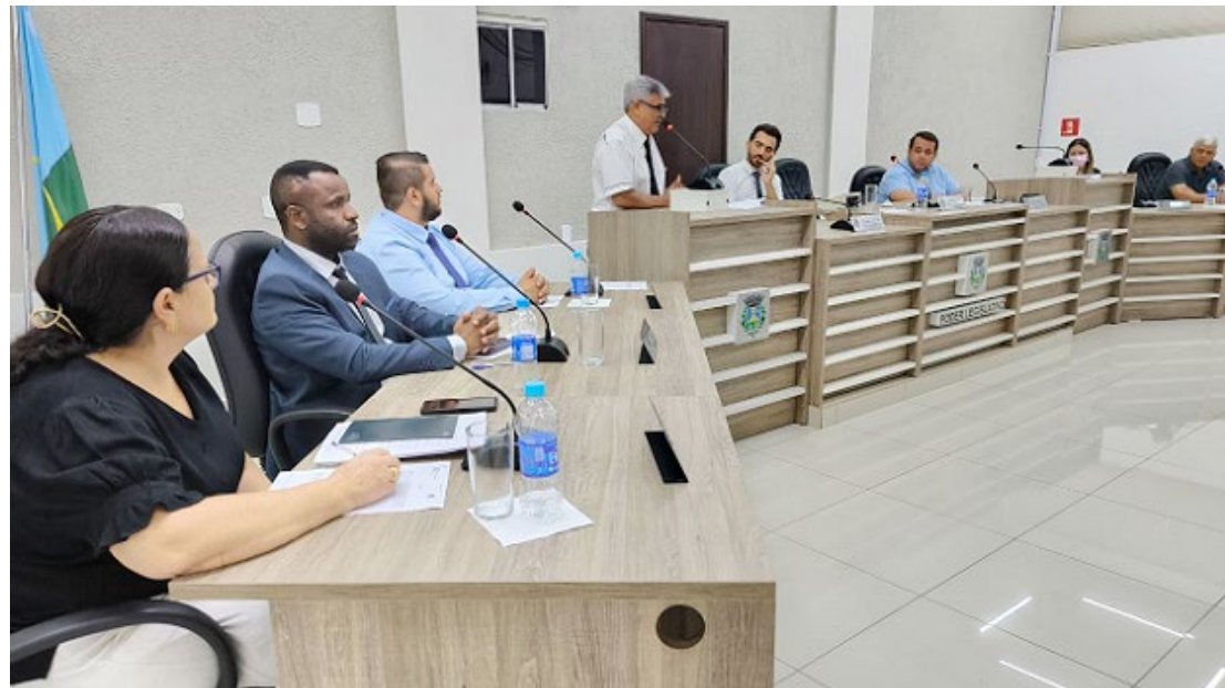
Os nomes dos homenageados foram aprovados pelos vereadores

Ele lembra que a escolha dos nomes teve como critério homenagear os pioneiros vivos, levando-se em consideração que Goioerê perdeu muitos dos seus pioneiros nos últimos anos e a proposta é que eles