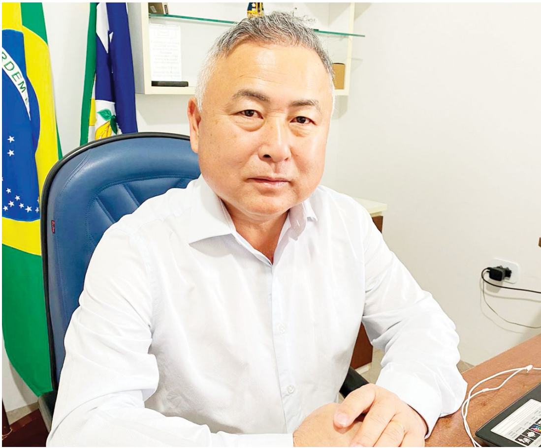
O prefeito Akio Abe cita que é importante a participação dos proprietários dos imóveis

A ação será realizada neste sábado (19), no CRAS de Quarto Centenário, das 8h às 18h. “Vamos estar atendendo o dia todo e assim facilitar para que todos os proprietários possam apresentar a documentação necessária para as novas fases do processo”, diz o prefeito.