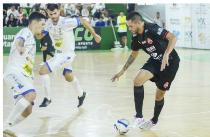
A equipe da ADGG volta à quadra neste sábado: confronto contra o Itapejara

A presença da torcida será fundamental para incentivar