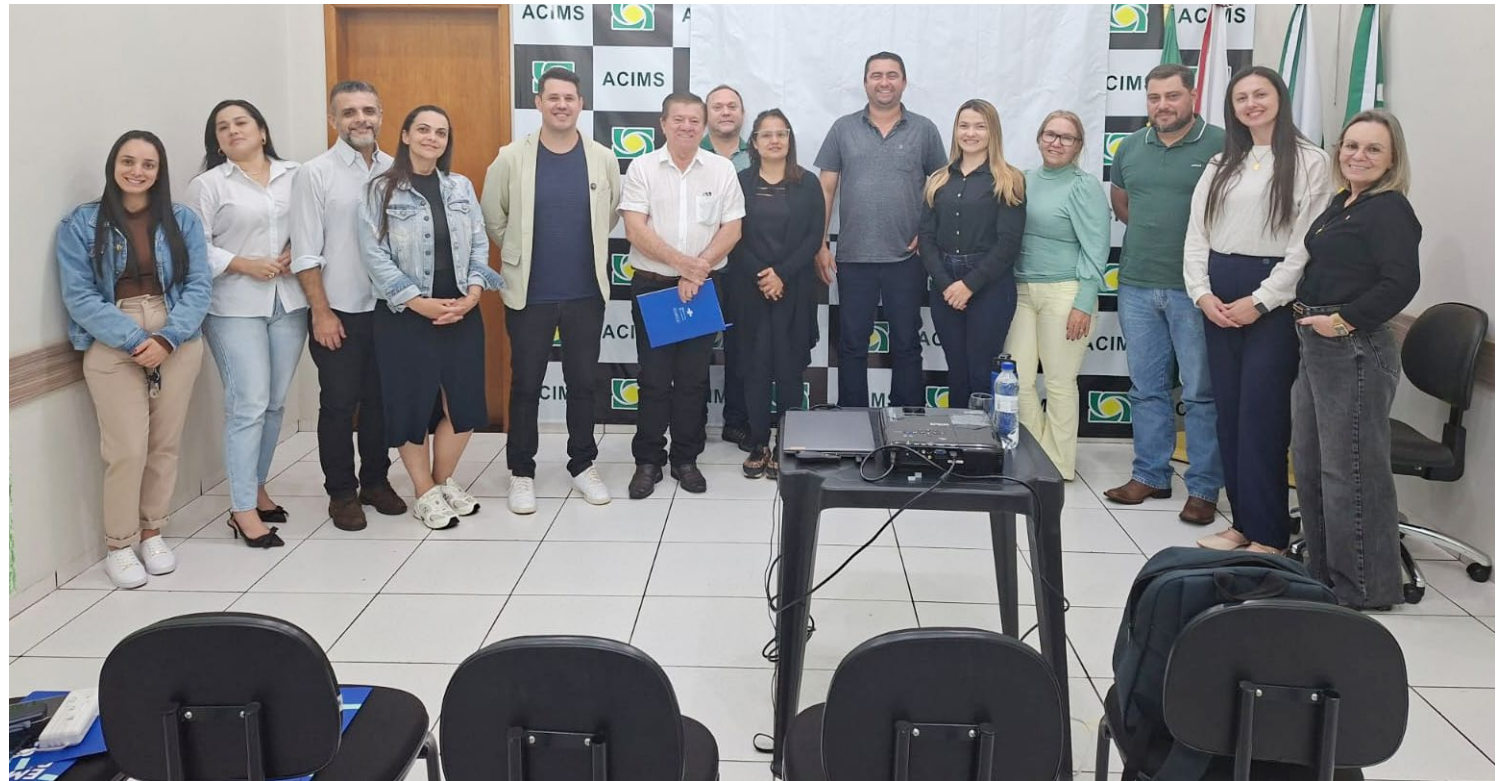
A palestra reuniu empresários de diversos setores do comércio de Moreira Sales