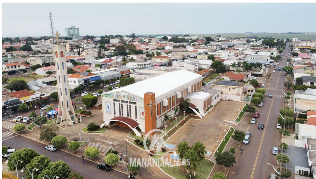
A cidade de Goioerê vai completar 70 anos no próximo dia 10 de agosto

"Fizemos essa mudança de forma planejada, atendendo a pedidos da comunidade, pois desta forma a população poderá participar dessa grande festa que é a Expo-Goio e assistir ao