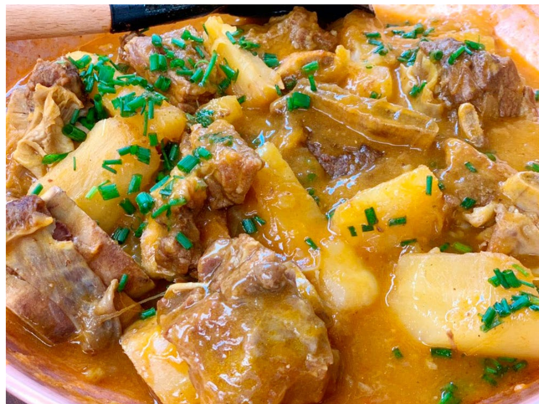
O evento, que promete movimentar a cidade, está agendando para acontecer neste domingo, dia 27

PARCEIROS: A Festa da Vaca Atolada conta com a participação de vários parceiros, inclusive do Rotary Clube, que participará do evento com cerca de 80 voluntários. Além disso foram contratados 350 diaristas que atuarão para manter o espaço limpo e organizado.