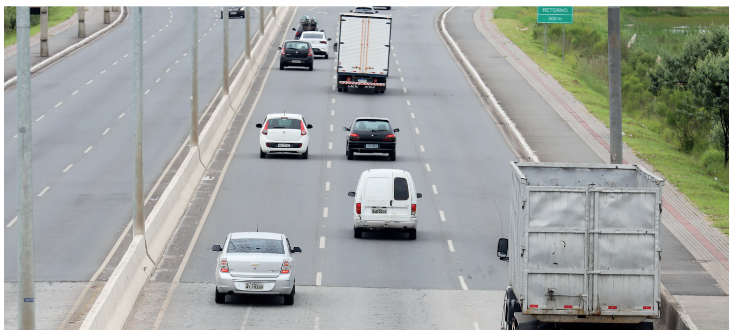
IPVA teve redução de 45% na alíquota, cesta básica tem o maior número de produtos isentos do Brasil e pequenos negócios têm a menor tributação

Além da saúde das contas estaduais, a medida é respaldada por outras ações compensatórias, como o aumento da multa por atraso do pagamento do imposto, que passará de 10% para 20%, e a expectativa de aumento da repatriação de veículos que