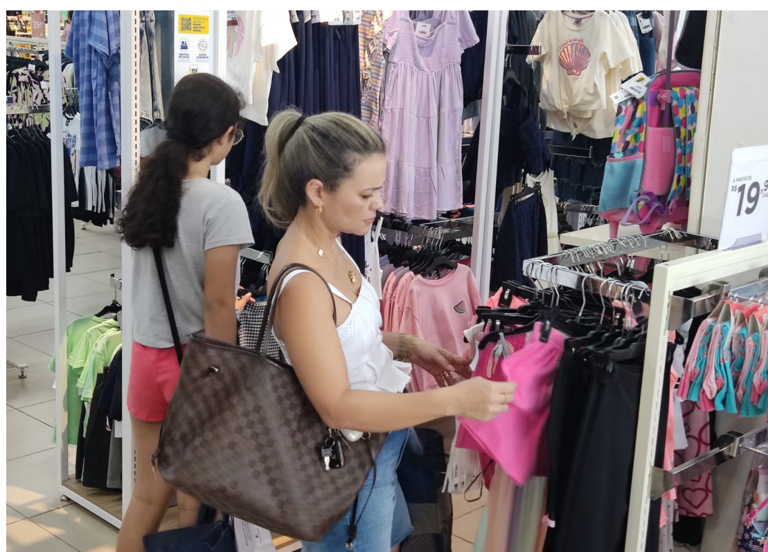
As datas em que o comércio funcionará à noite já foram todas definidas

Pelo que ficou definido, nos dias 6, 13 e 20 de dezembro – sábados – o comércio vai funcionar das 9 às 17 horas. Já no domingo, dia 21 de dezembro, o funcionamento será das 9 às 18 horas. Na quinta e sexta-feira, dias 11