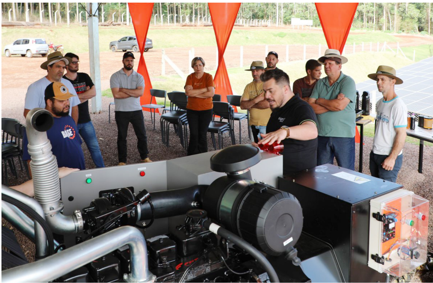
cooperados aprofundaram o conhecimento sobre o uso de geradores de energia, equipamento indispensável para garantir a segurança dos aviários