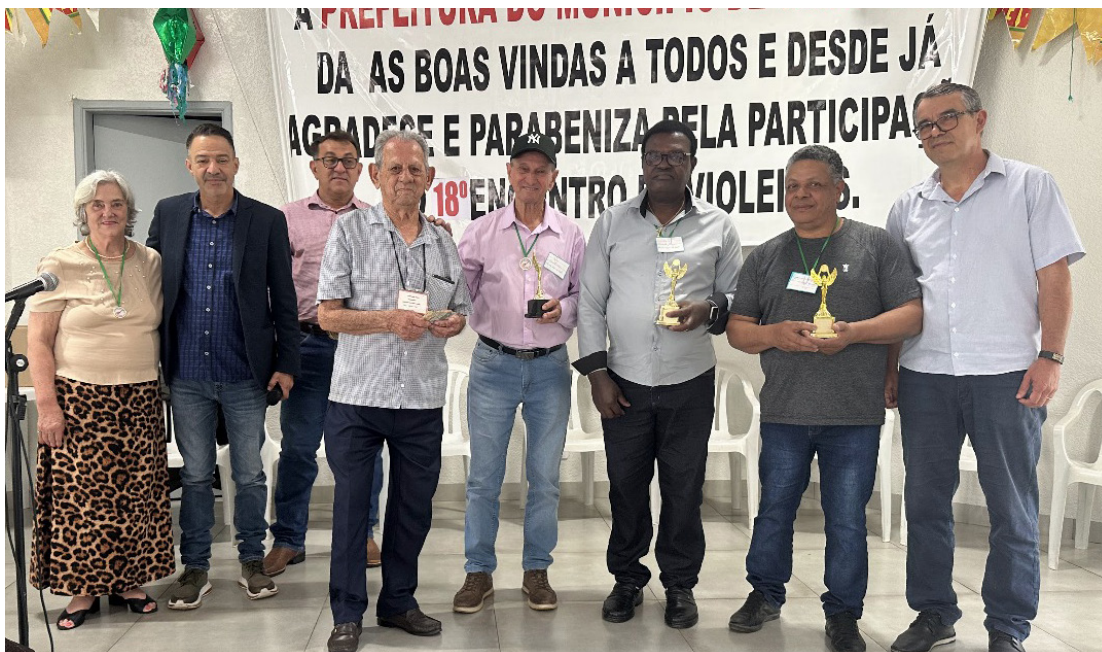
Representantes de Rancho Alegre fizeram bonito durante os festivais

Outro momento de destaque foi a participação da fanfarrinha municipal no 1º Festival de Bandas e Fanfarras de Palotina. Com uma performance marcada por ritmo, harmonia e disciplina, o grupo conquistou o público presente e demonstrou a força da música instrumental como expressão cultural e de integração comunitária.