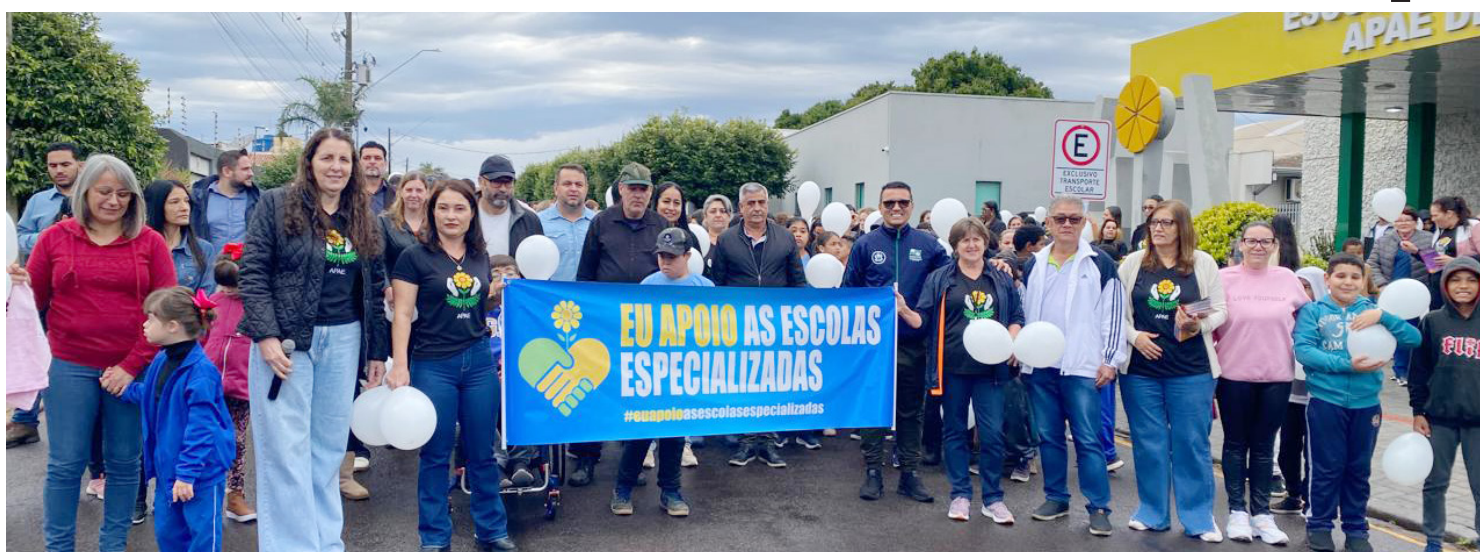
A caminhada percorreu a área central da cidade: mobilização em favor das Apae's

De 21 a 28 de agosto é celebrada a Semana Nacional da Pessoa com Deficiência Intelectual e Múltipla. A data foi instituída pela Lei nº 13.585/2.017, e visa ao desenvolvimento de conteúdos para conscientizar a sociedade sobre as necessidades específicas de organização social e de políticas públicas para promover a inclusão social desse segmento populacional e para combater o preconceito e a discriminação.