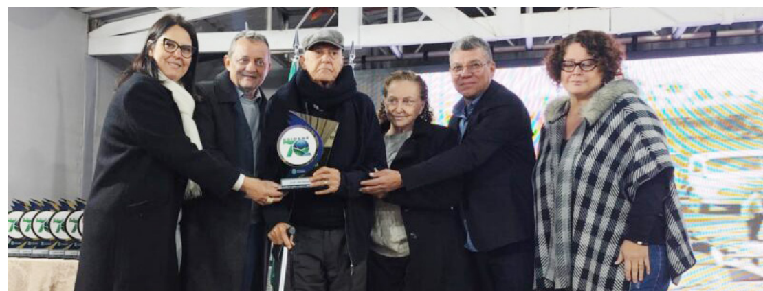
a Prefeitura de Goioerê prestou uma linda homenagem aos pioneiros que marcaram a história do município nos seus 70 anos

menagear os 70 pioneiros, é uma reverência aos que, entre desafios e conquistas, deram os primeiros passos para transformar o município nessa referência que