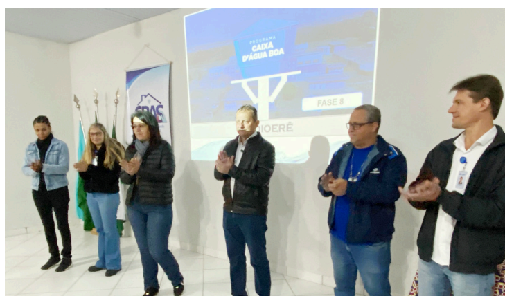
As caixas serão doadas pela Sanepar: Parceria com a prefeitura municipal

O programa tem como objetivo garantir o acesso à água potável mesmo em situações de interrupção no fornecimento, promovendo melhores condições de moradia e incentivando o uso consciente da água.