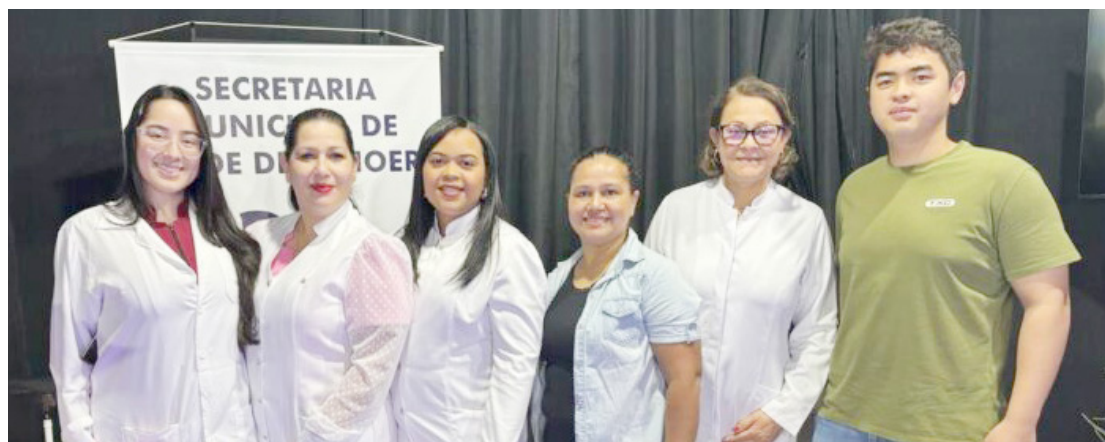
Durante os cinco dias de Expo-Goio a saúde marcou presença na feira

A Secretaria de Saúde de Goioerê foi um dos destaques da Expo-Goio deste ano, oferecendo serviços e atendimento para o público presente na festa e reforçando o compromisso da administração municipal com o bem-estar da