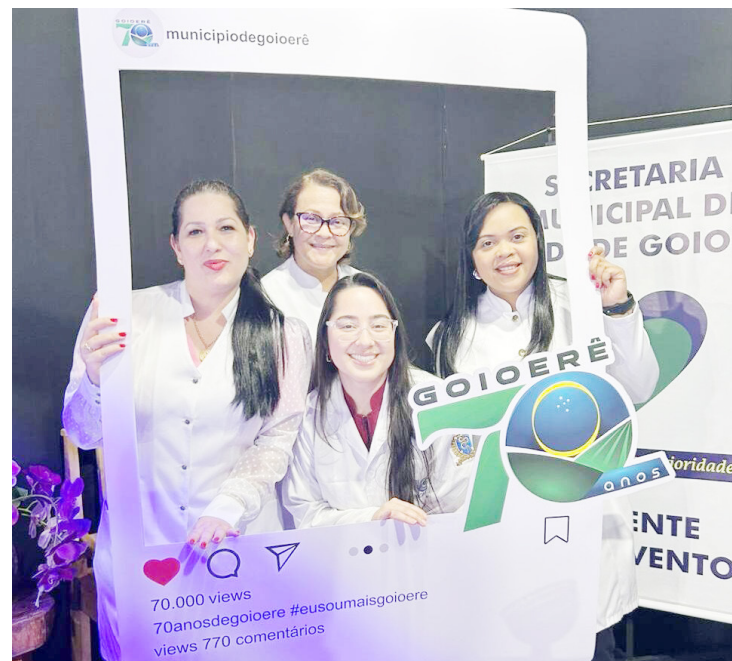
Diversos serviços foram oferecidos à população que esteve na Expo-Goio