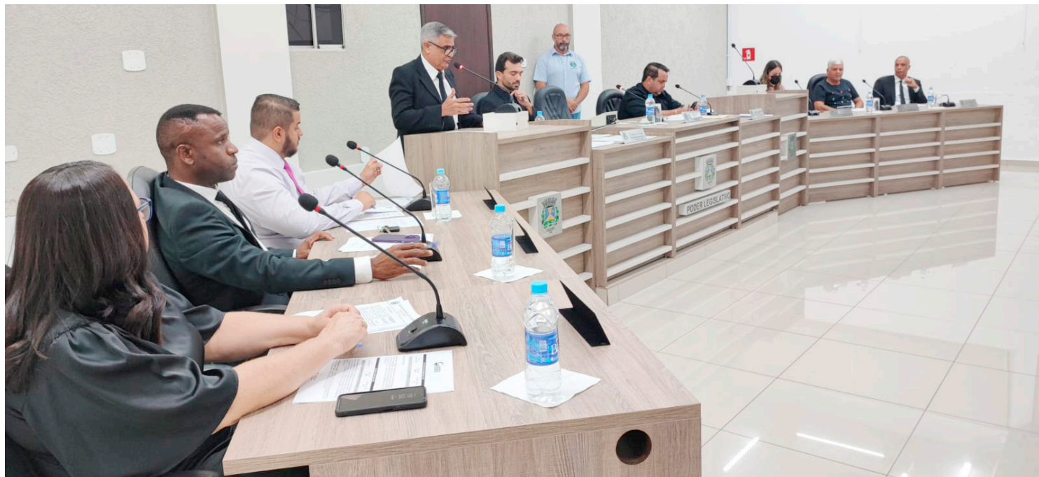
A sessão da Câmara foi realizada na noite de ontem: Indicações e projetos aprovados

Coluna publicada simultaneamente em 22 jornais e portais associados. Saiba mais em www.adipr.com.br