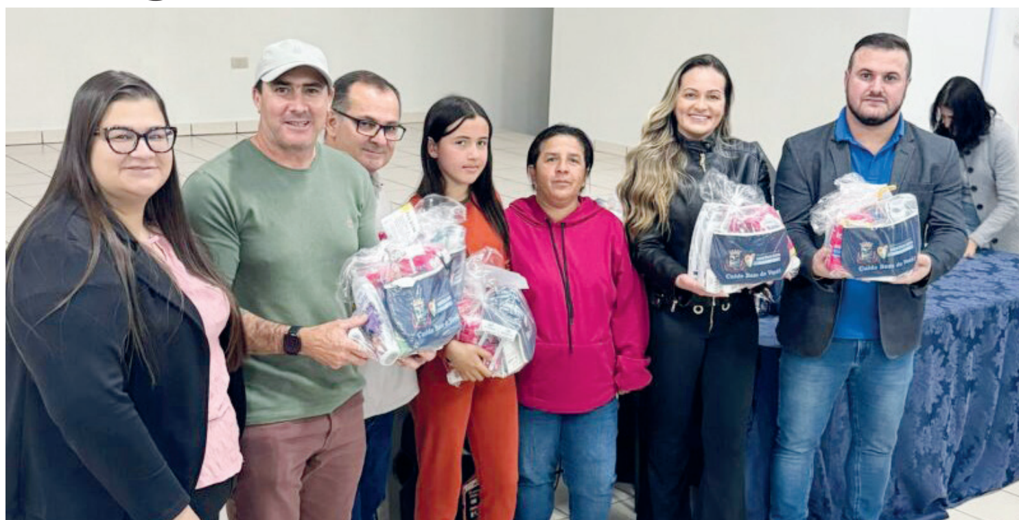
A entrega dos kits aconteceu segunda-feira, dentro da programação do Agosto Lilás

Além do prefeito, quem esteve presente na entrega foi a vereadora e presidente da Câmara Municipal, Va-