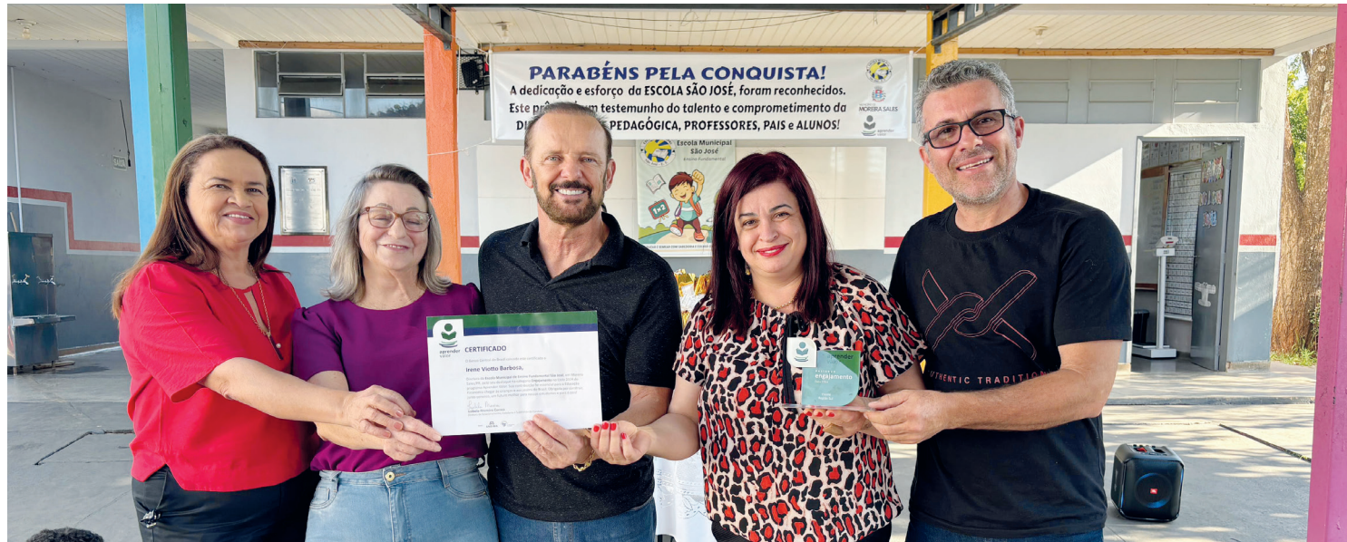
Escola São José ganhou prêmio a nível nacional

O programa tem como objetivo fortalecer a educação financeira e promover o desenvolvimento de competências fundamentais para a formação cidadã dos estudantes. A premiação representa o reconhecimento do trabalho pedagógico realizado com excelência e o comprometimento da escola com a formação integral