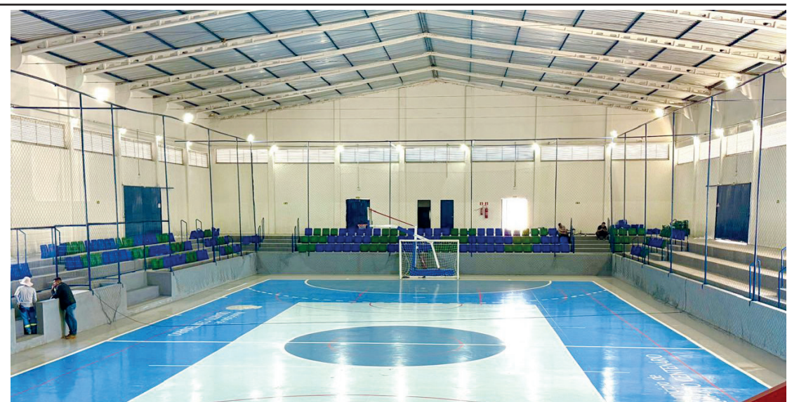
O ginásio foi totalmente revitalizado, inclusive ganhou piso novo