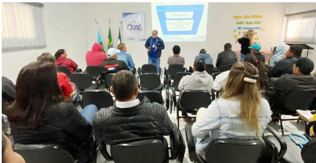
Programa vai atender 23 famílias em Goioerê com instalação de caixas d’água

“Uma ação espetacular do Governo do Paraná e Sanepar, que vai garantir melhores condições às famílias que não possuem caixas d’água em Goioerê”, disse o prefeito. No total o município foi contemplado com 23 kits completos.