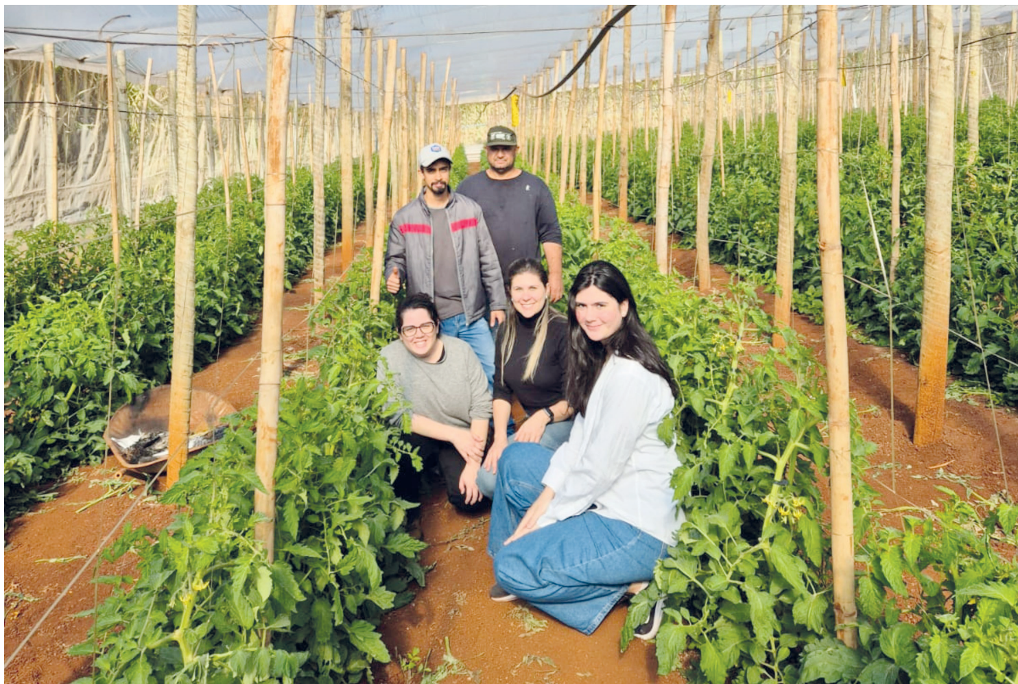
A primeira etapa da edição 2025 do programa Propriedade Intelectual com Foco no Mercado (Prime) começou em maio, com 150 participantes

Nesta segunda etapa, ao término dos conteúdos, uma banca de avaliação técnica vai escolher dez finalistas para a última etapa da edição. Esse grupo receberá um aporte individual de R$ 200 mil do Estado, totalizando R$ 2 milhões, para viabilizar o desenvolvimento e a implementação dos projetos. Os recursos são do Fundo Paraná de fomento científico e tecnológico, uma dotação constitucional administrada pela Secretaria da Ciência, Tecnologia e Ensino Superior (Seti), pasta responsável pelas atividades do Prime.