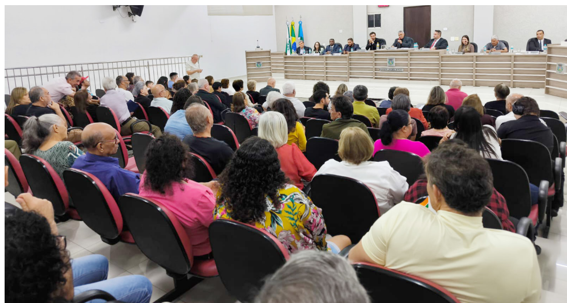
A homenagem aconteceu na segunda-feira (18), para os pioneiros do município