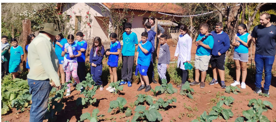
Os alunos receberam orientações importantes durante a visita feita à propriedade rural

A ação, promovida pela Administração Municipal, por meio da Secretaria de Educação, teve como objetivo mostrar na prática como os alimentos chegam até a escola — desde o plantio até o prato dos alunos. A visita também foi