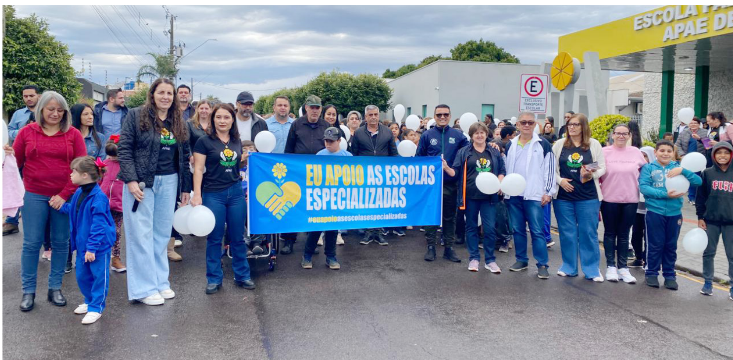
A caminhada aconteceu nesta quarta-feira (20), em protesto contra à Ação Direta de Inconstitucionalidade (ADI) 7796

A mobilização teve como foco a defesa de um modelo de ensino que respeita as diferenças e assegura o atendimento adequado e individualizado aos estudantes com defici-