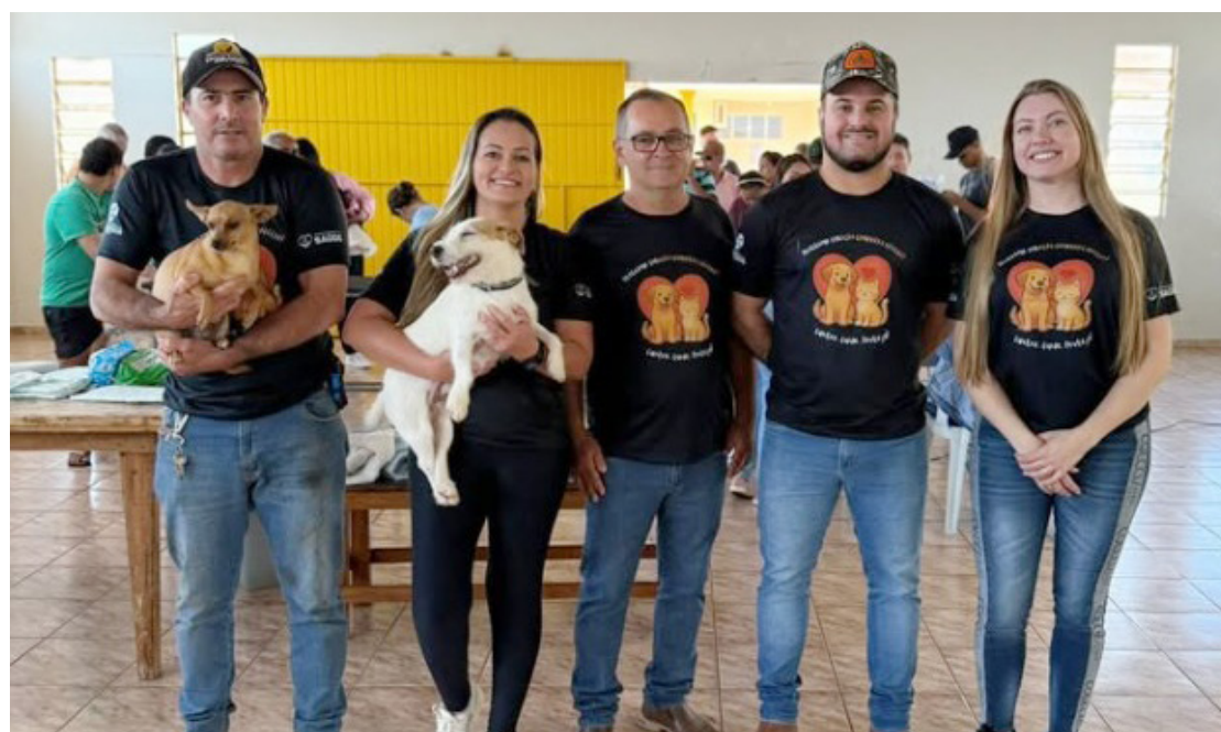
O programa foi iniciado no último sábado e envolve várias secretarias