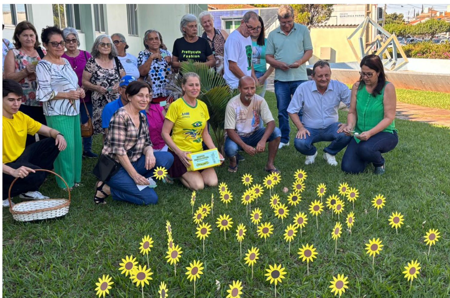
O programa foi encerrado quarta-feira, com ações no Paço Municipal

Como forma de agradecimento, os participantes entregaram lembranças produzidas artesanalmente por eles aos servidores do Paço Municipal. Além disso, em um gesto simbólico e emocionante, os membros do grupo fixaram