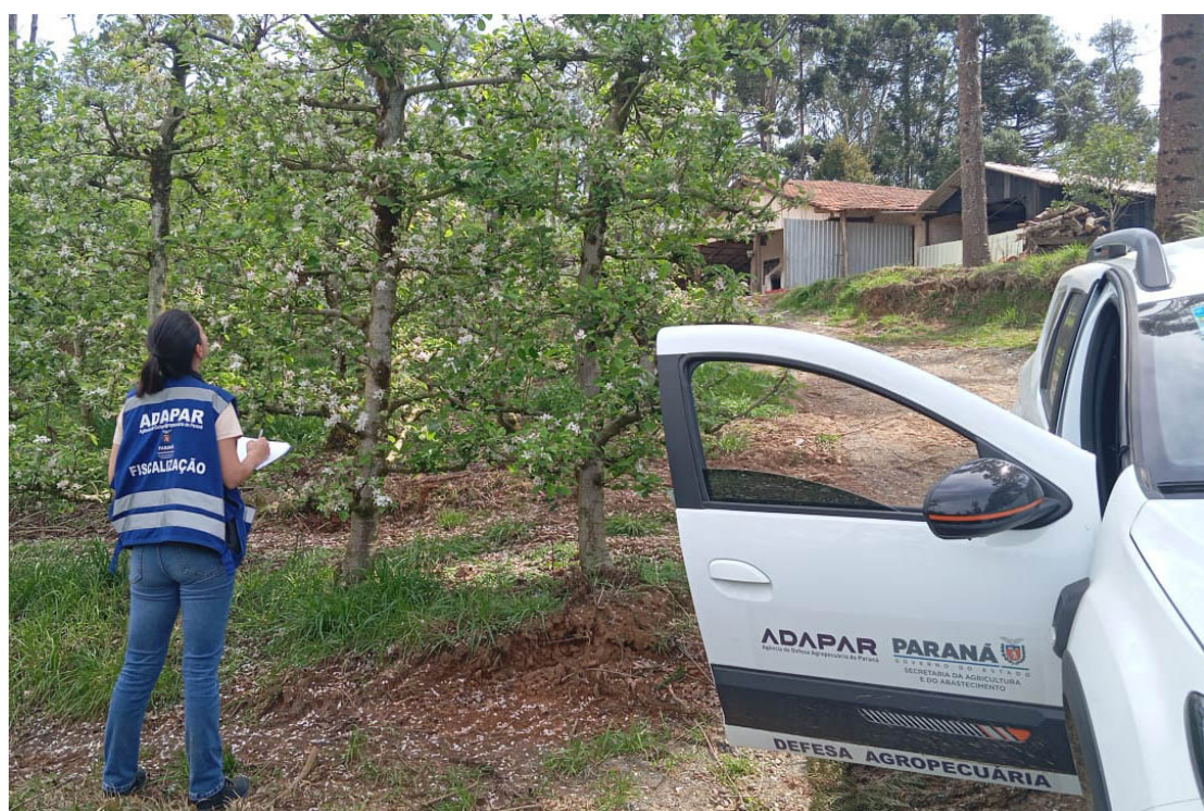
As inscrições começam na próxima segunda-feira, dia 29

O secretário de Estado da Agricultura e Abastecimento, Marcio Nunes, destacou a importância das vagas ofertadas para fortalecer a defesa agropecuária do Paraná. “Esse novo edital não é apenas para suprir a defasagem, mas para garantir que a agência siga avançando, ampliando sua capacidade