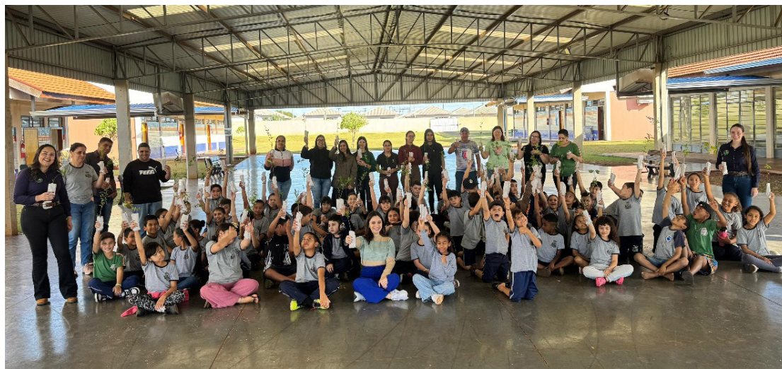
Alunos da Escola Municipal Manoel Medina Martins celebraram o Dia da Árvore com o plantio de mudas e atividades de educação ambiental em Rancho Alegre D'Oeste

Segundo a direção da escola, atividades como essa fortalecem o aprendizado na prática e mostram que cada gesto, por menor que pareça, pode gerar grandes mudanças