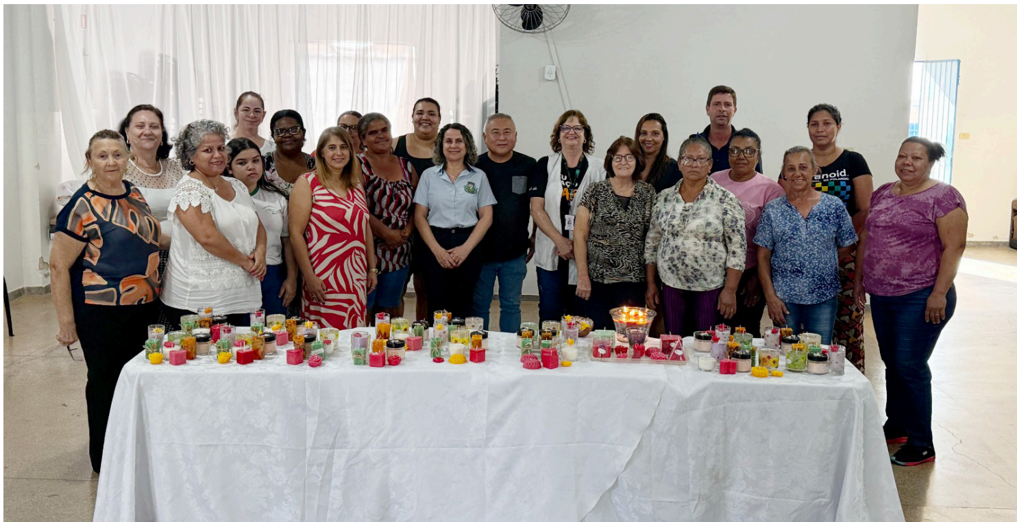
Parceria entre Prefeitura e Senac leva conhecimento e criatividade à comunidade

A capacitação contou com a participação de 15 alunos, que durante 6 dias de curso, com carga horária de 3 horas por dia, totalizando 18 horas, tiveram a oportunidade de aprender técnicas para produção de velas artesanais, unindo criatividade, decoração e aromas. Essa iniciativa contribui para o desenvolvimento de