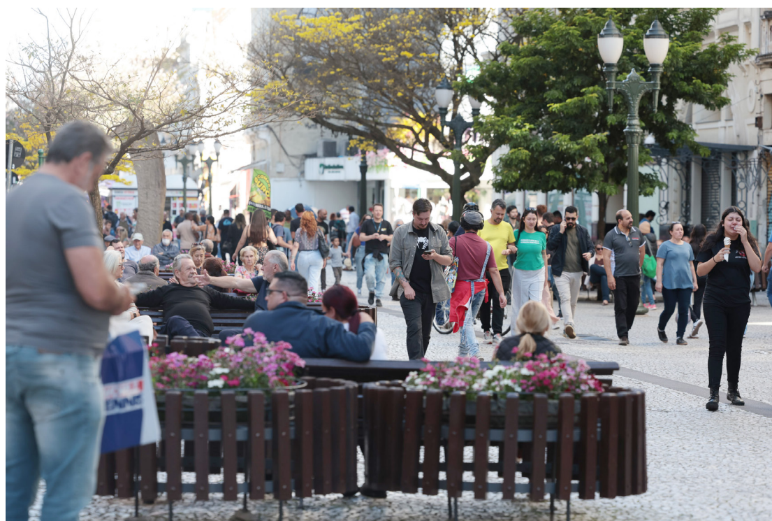
Paraná se destaca no mercado de trabalho: mais de 108 mil empregos formais gerados até agosto, o 3º melhor saldo do Brasil e o melhor da Região Sul.

Em agosto, foram criados mais de 6 mil novos empregos com carteira assinada no