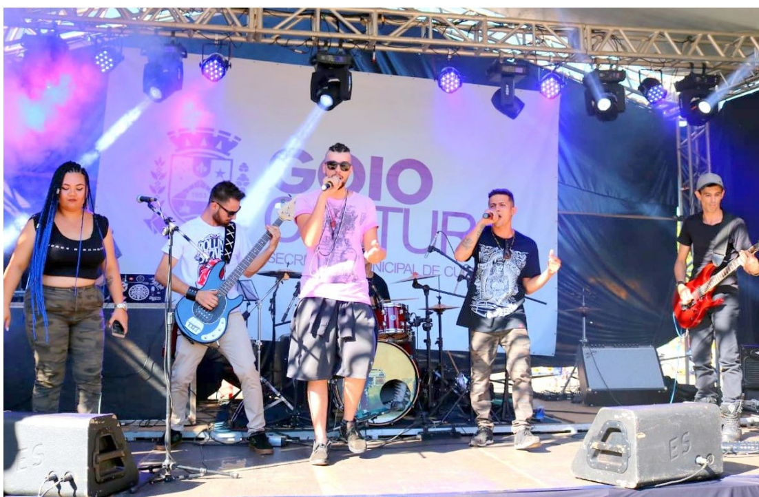
O evento é tradicional e vai reunir dezenas de bandas da cidade, além de carros antigos

apresentações musicais, cujos nomes e horários serão divulgados nos