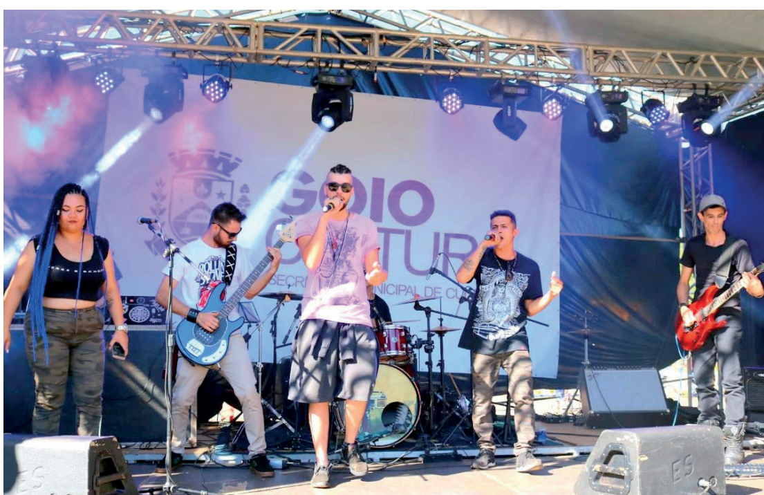
O evento é tradicional e vai reunir dezenas de bandas da cidade, além de carros antigos

Ao todo, serão 10 apresentações musicais, cujos nomes e horários serão divulgados nos próximos dias. A orga-