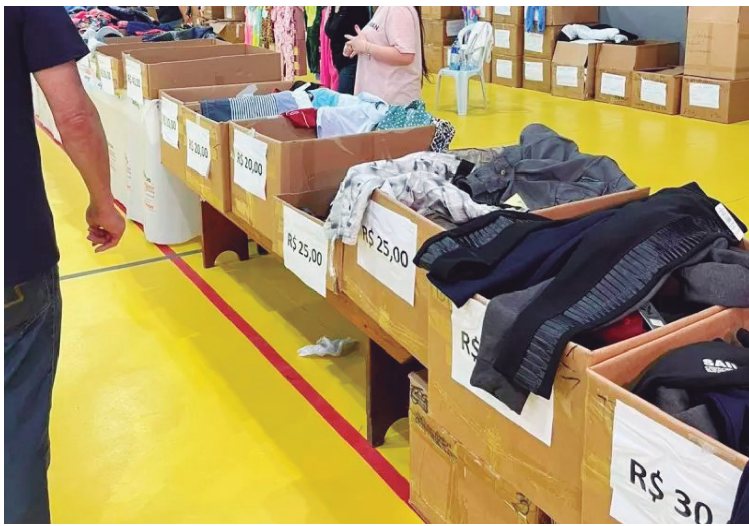
O bazar acontece neste fim de semana nos dias 04 e 05, com produtos doados pela Receita federal

De acordo com a direção da Apae, a iniciativa tem como principal objetivo reforçar o caixa da Escola Rodrigo Barbato, garantindo recursos para investimentos futuros e o custeio da entidade, que realiza um trabalho fundamental na educação e inclusão de pessoas com