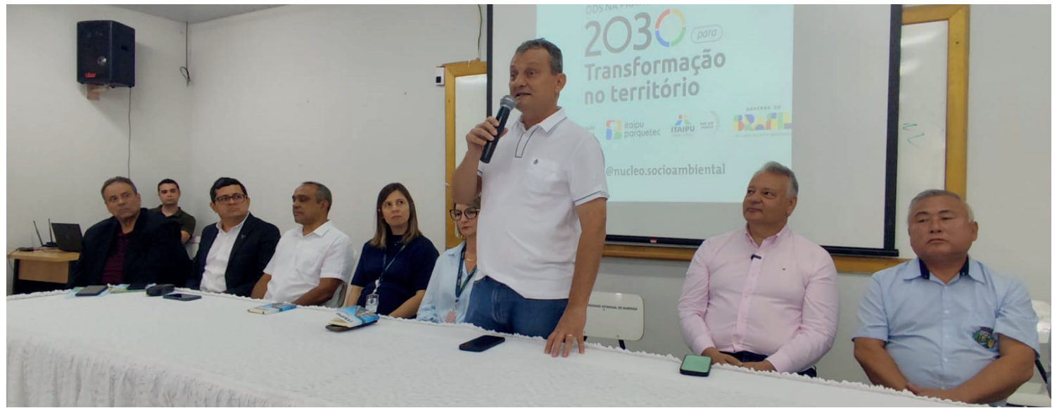
Ao centro, o prefeito Pedro Coelho, durante a abertura do seminário realizado nesta quinta-feira em Goioerê