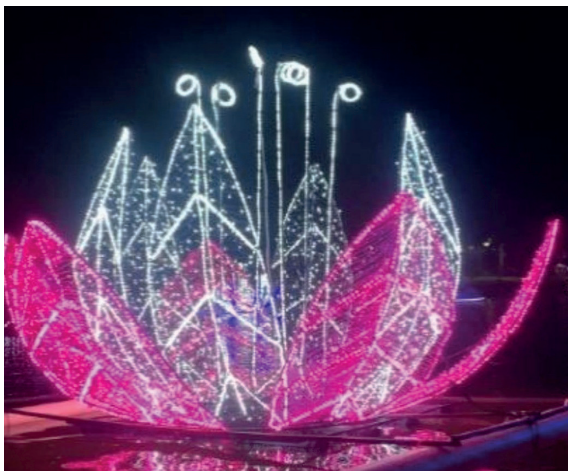
Com a proposta de transformar Goioerê em uma cidade iluminada e atrativa, serão instalados enfeites natalinos em pontos estratégicos

Com a proposta de transformar Goioerê em uma cidade iluminada e atrativa, serão instalados enfeites natalinos em pontos estratégicos, resgatando o espírito natalino e tornando o município referência na região durante as festividades de final de ano. A ideia é atrair não apenas os moradores, mas também consumido-