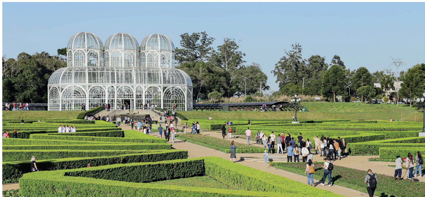
O turista que visitou o Paraná em 2024 ficou em média 5,8 pernoites hospedado, número muito próximo da média nacional, que foi de 6,9 pernoites.

O governador Carlos Massa Ratinho Junior destacou que os números confirmam o esforço do Estado em fortalecer o turismo. “Esse resultado mostra o trabalho realizado nos últimos anos para potencializar e informar sobre os atrativos do Paraná. O Estado oferece experiên-