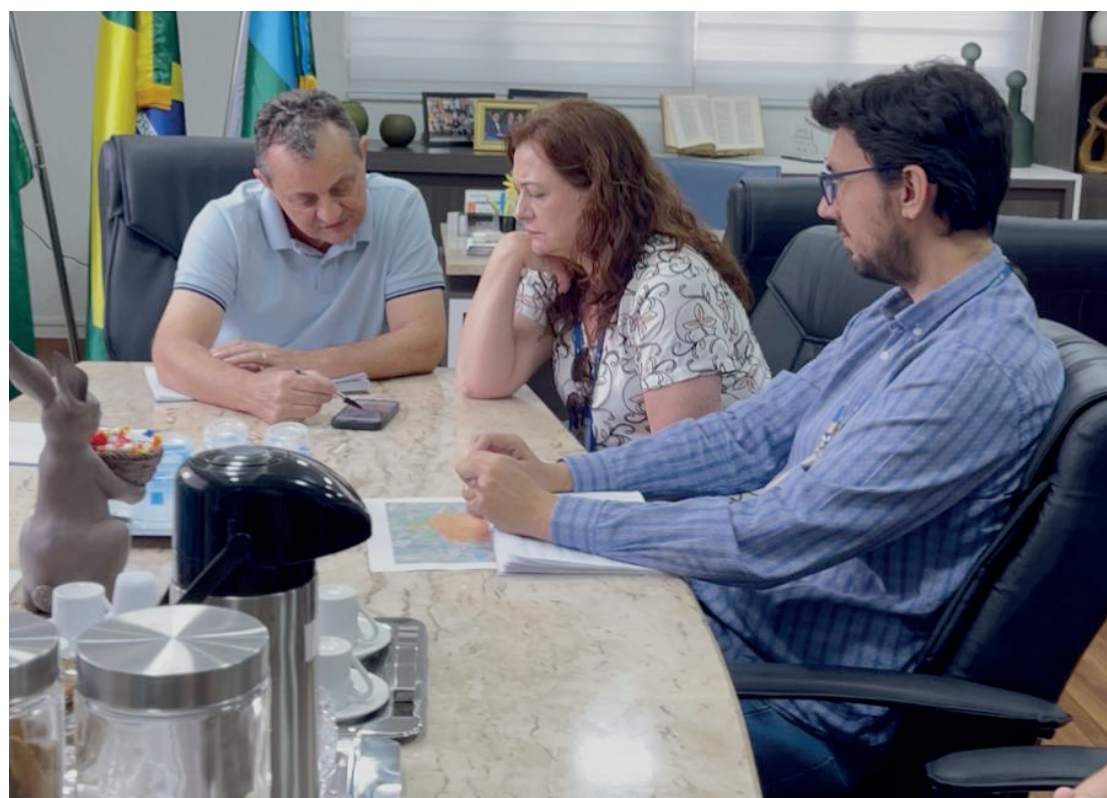
A reunião foi realizada na última terça-feira: ampliação da rede de esgoto

Durante a reunião, o prefeito destacou a meta ambiciosa da gestão: “Nosso objetivo é alcançar 90% de cobertura de esgoto em todo o município até 2032, com 100% no bairro Jaracatiá. Para isso, seguimos em parceria com a Sanepar, estudando a viabilidade de novos pontos e soli-