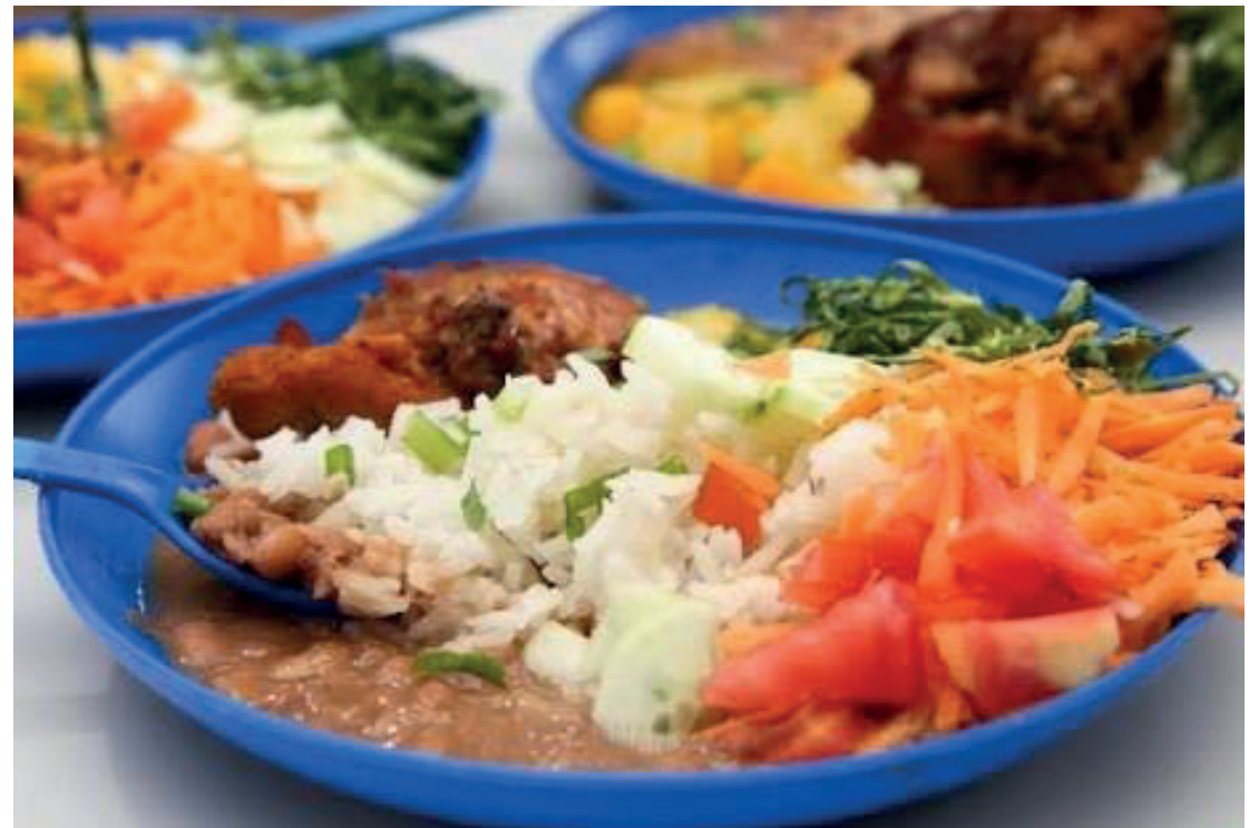
Goioerê se destaca na alimentação escolar, com equipe especializada e refeições saudáveis preparadas