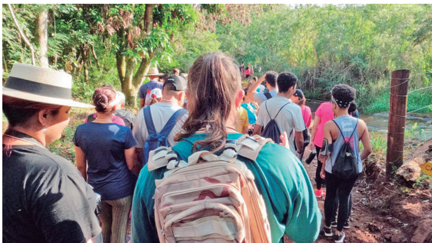
A caminhada entra na sua sexta edição e promete movimentar a cidade neste domingo

Com um trajeto de 10 km, o circuito oferece paisagens deslumbrantes e um percurso que atravessa áreas de reservas naturais, riachos, plantações e trilhas em meio à vegetação nativa. A iniciativa é uma realização da Prefeitura de Janiópolis, em parceria com o IDR-Paraná (Instituto de Desenvolvimento Rural do Paraná – Iapar-Emater).