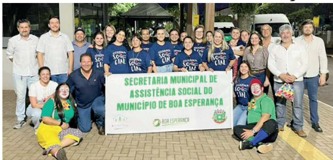
A festa foi um grande sucesso, com distribuição de brinquedos para as crianças

Dentro da programação, a prefeitura fez a distribuição de bolas de futebol para todas as crianças participantes, numa demonstração de incentivo ao esporte e