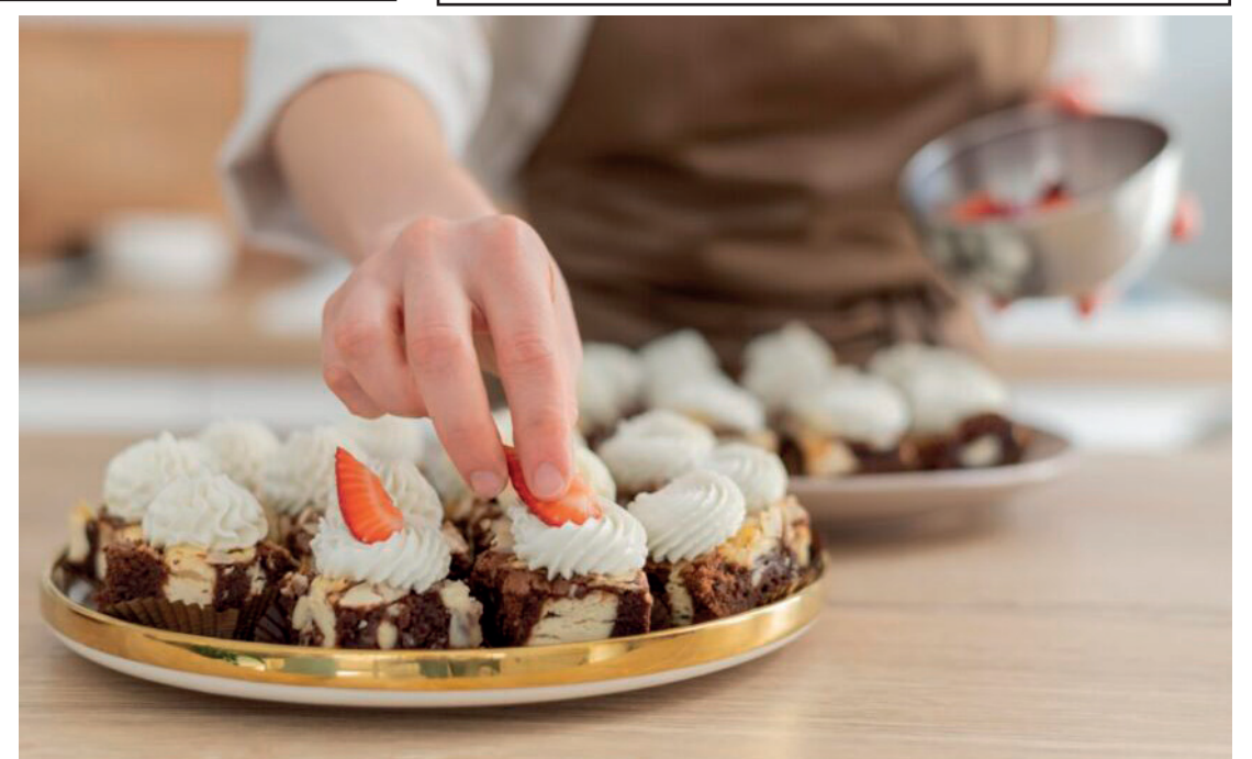
O curso tem início previsto para o dia 12 de novembro

compromisso do município em oferecer educação profissional gratuita e de