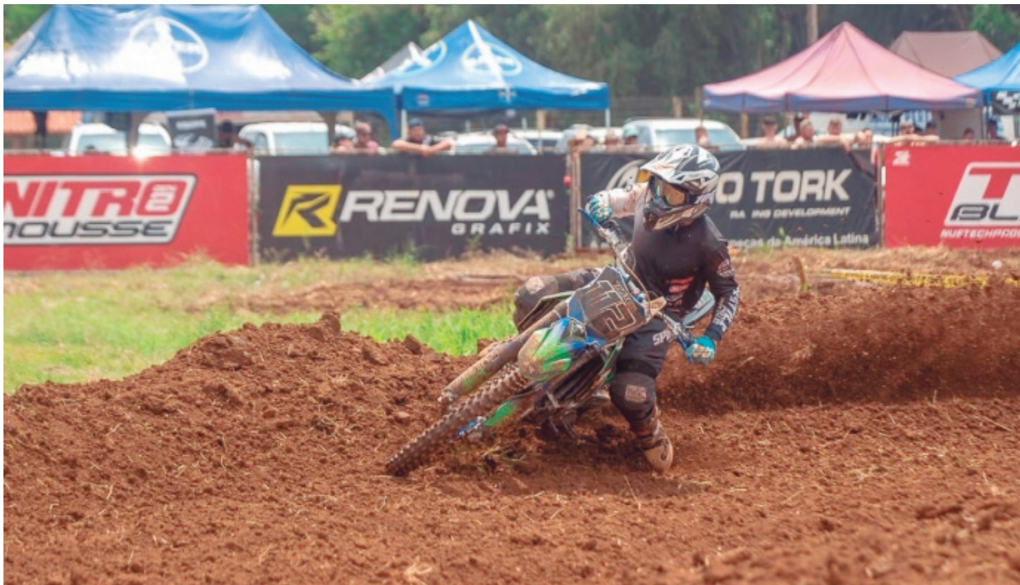
O Velocross será realizado neste sábado, dia 1º de novembro, ao lado do Conjunto Novo Horizonte, com entrada gratuita.

A entrada é gratuita, e a programação começa às 8h30, seguindo até o final da tarde. As provas oficiais terão início a partir das 12h30, reunindo pilotos de várias cidades da região em diversas