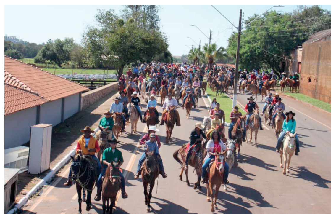
Muita expectativa para a 3ª Cavalgada de Nossa Senhora Aparecida, que será realizada neste domingo, dia 19

Durante o evento, também haverá premiação para as seguintes ca-