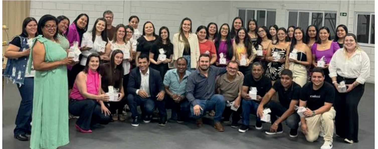
As homenagens foram em reconhecimento ao trabalho dos professores no município

Coluna publicada simultaneamente em 22 jornais e portais associados. Saiba mais em www.adipr.com.br