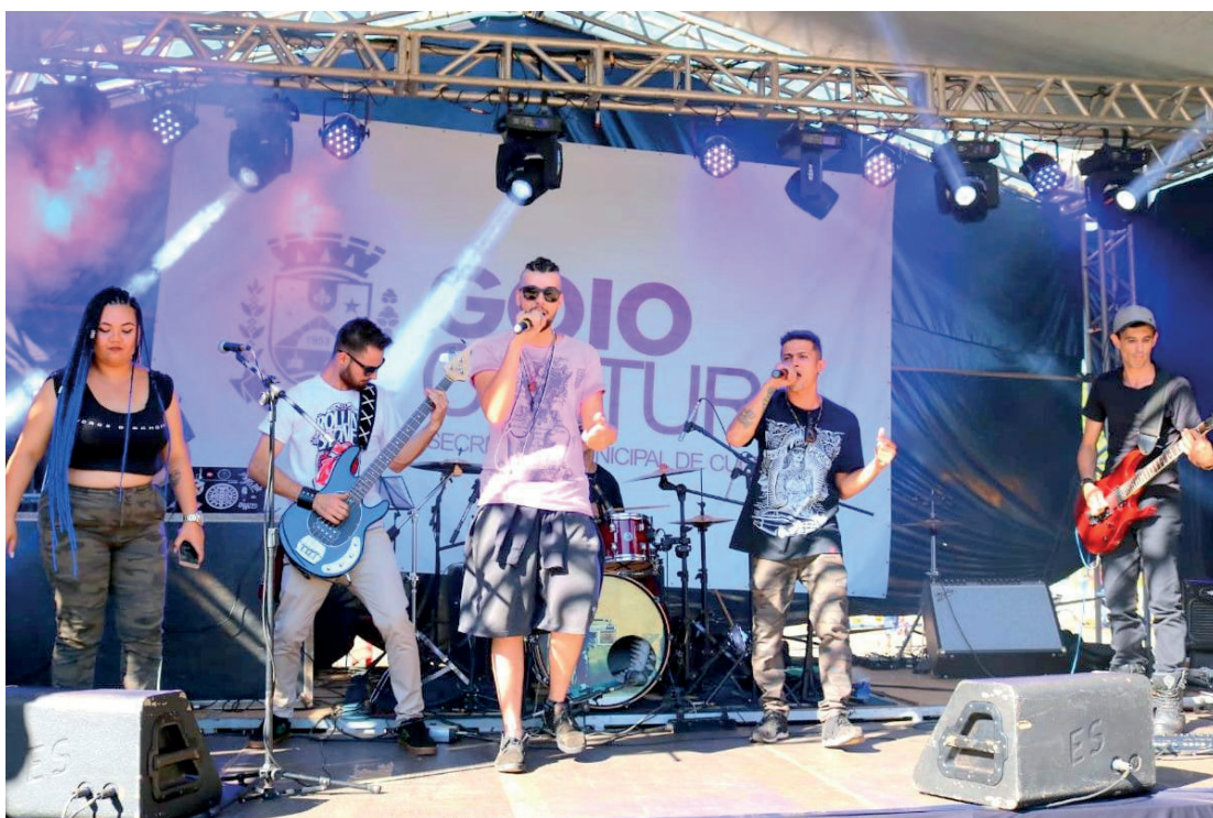
O evento está programado para acontecer neste domingo em Goioerê

Já a partir das 15h, o público poderá curtir