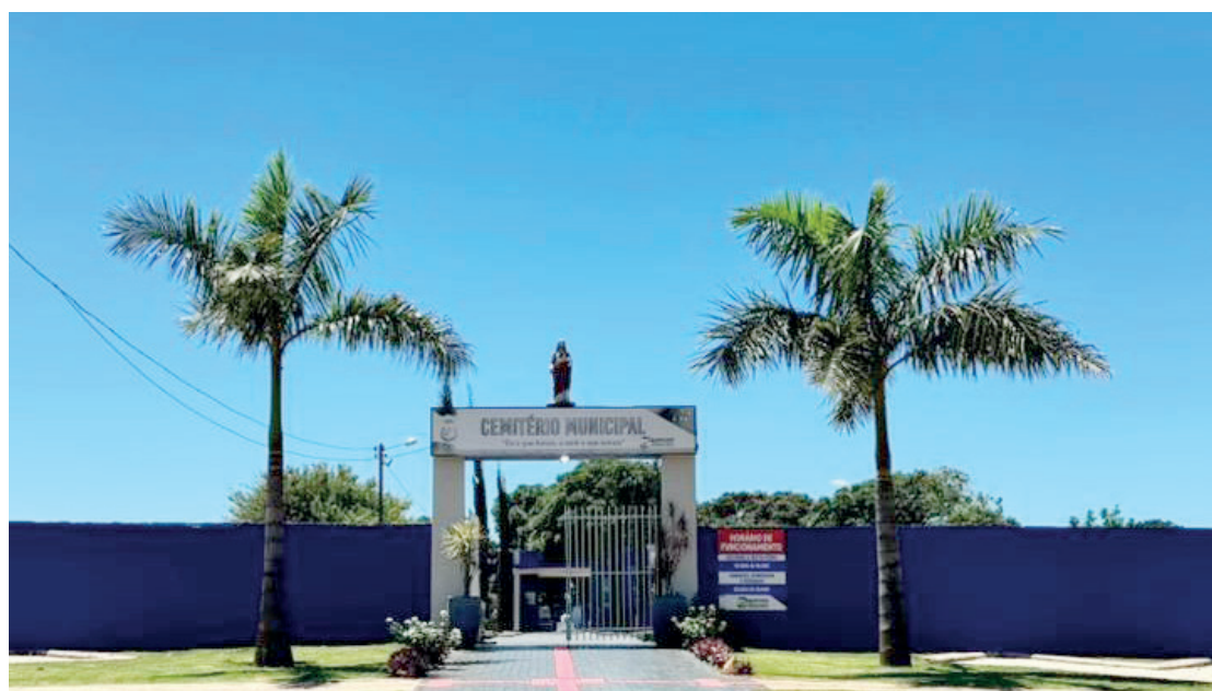
Termna hoje dia 30, o prazo de limpeza

A prefeitura reforça que os serviços de manutenção fazem parte de um esforço conjunto para oferecer um ambiente limpo, acolhedor e digno para as homenagens