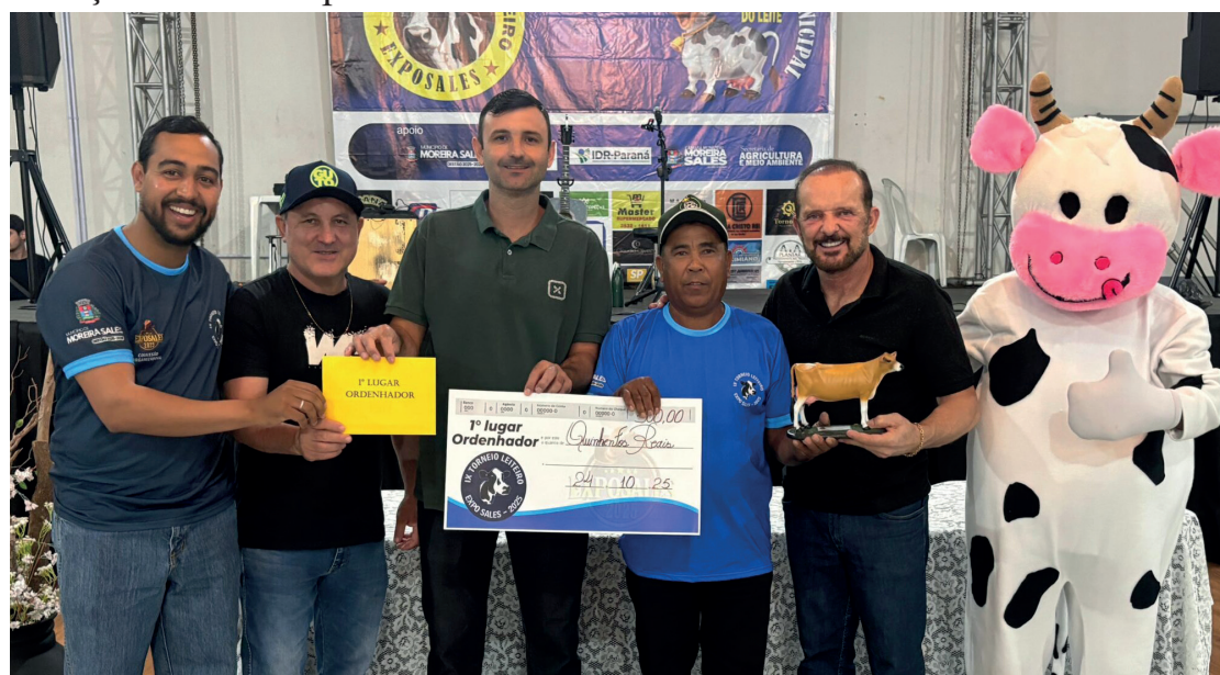
A premiação para o melhor ordenhador foi de 500 reais