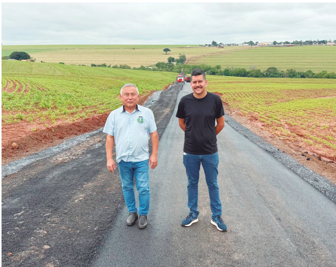
A Prefeitura de Quarto Centenário iniciou as obras de pavimentação asfáltica do trecho restante de 1,7 quilômetro de estrada, ligando a cidade à Vila Rural Porta do Céu

“É mais uma obra que demonstra o compromisso da administração municipal com o desenvolvimento e o bem-estar da nossa