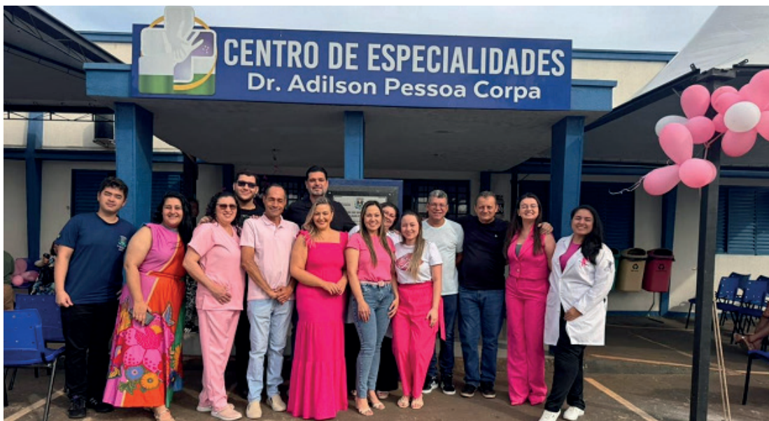
As ações foram realizadas no Centro de Especialidades: cuidado com a saúde da mulher

Durante a ação, foram realizados atendimentos médicos, coleta