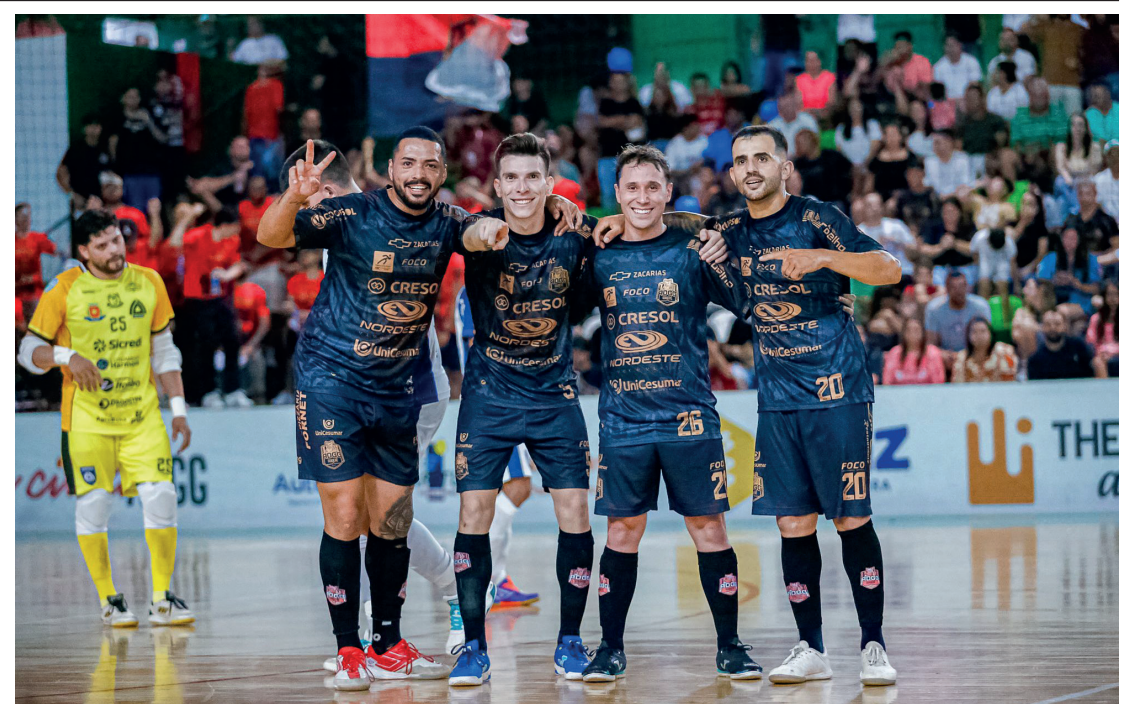
O time goioerense precisa apenas de um empate no tempo normal para se classificar sábado não deverá ser diferente. A direção da equipe está convidando os torcedores goioerenses para que participem da partida incentivando o time nessa fase que é das mais decisivas.

O time goioerense vem garantindo a alegria dos torcedores e para o jogo deste