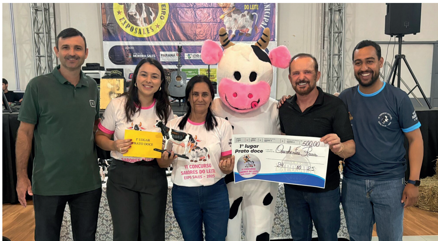
O melhor prato doce levou um prêmio de 500 reais

O evento aconteceu no Centro de Convivência do Idoso e reuniu autoridades, convidados e produtores rurais do município, além de familiares dos vencedores do torneio que já é tradição no município.