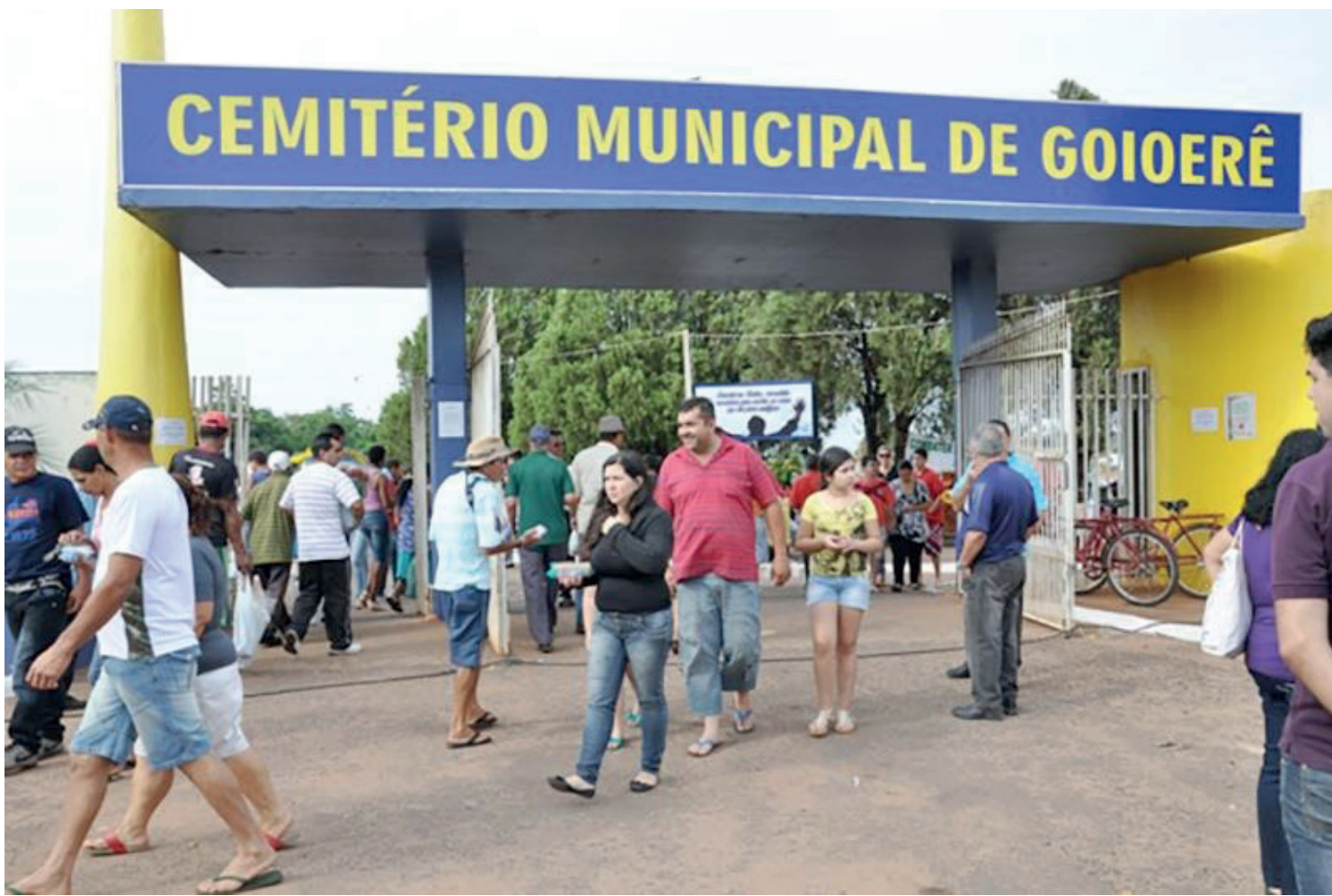
Os serviços de pintura no cemitério poderão ser feitos até esta sexta-feira

Conforme a Secretaria de Saúde, a preocupação é com a dengue. “Nós estamos fazendo um pedido