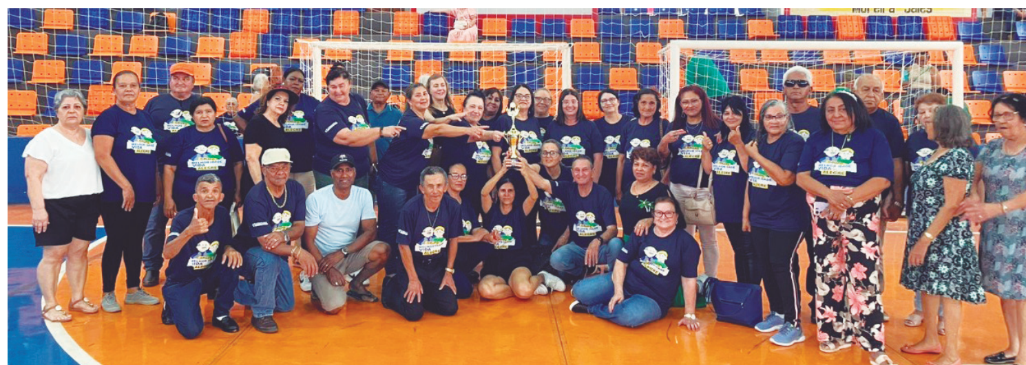
O evento foi realizado no último domingo em Moreira Sales

O Grupo da Terceira Idade de Rancho Alegre D'Oeste participou neste domingo (5), das comemorações pelo Dia Internacional do Idoso, realizadas no Ginásio de Esportes Morenã, em Moreira Sales. O evento reuniu grupos da melhor idade de diversos municípios em um grande encontro de integração, alegria e celebração da vida.