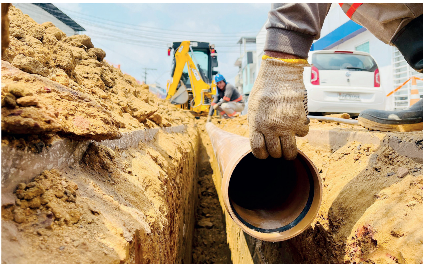
A ordem de serviço foi assinada nesta segunda-feira, durante reunião no Gabinete Municipal

A Ordem de Serviços foi assinada na última segunda-feira e segundo o prefeito, a iniciativa representa um avanço significativo em