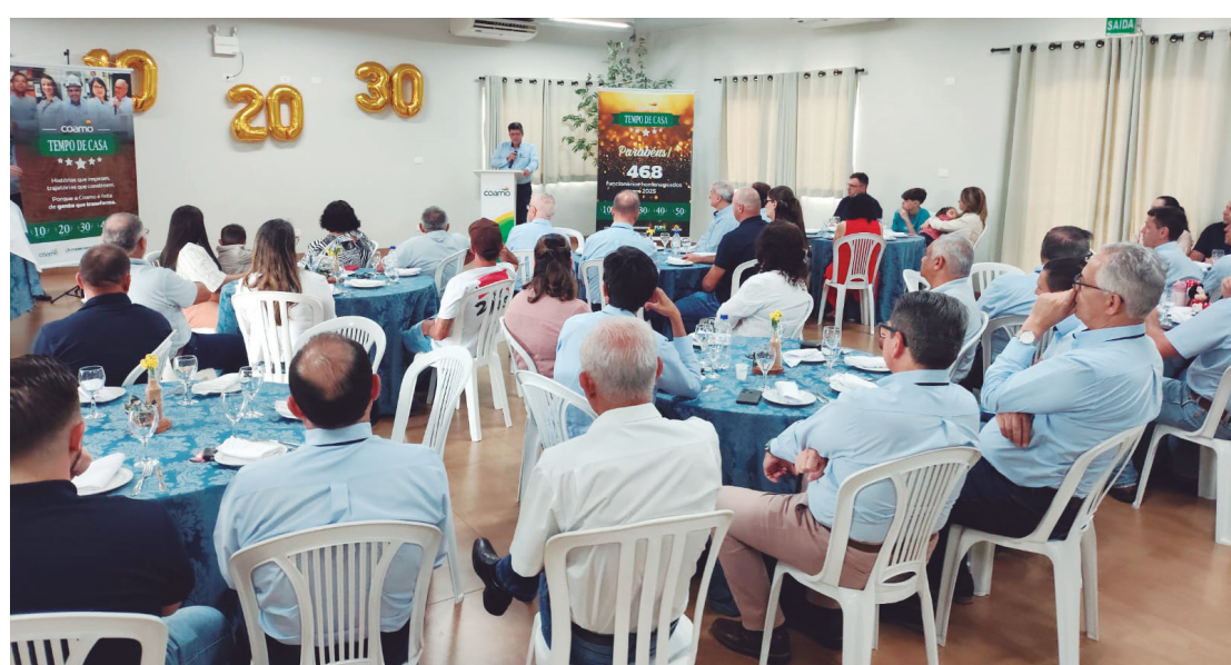
Os homenageados se reuniram na sede da Arcam em Goioerê

Neste ano, estão sendo homenageados 468 funcionários da cooperativa, que atua em 76 municípios dos estados do Paraná, Santa Catarina e Mato Grosso.