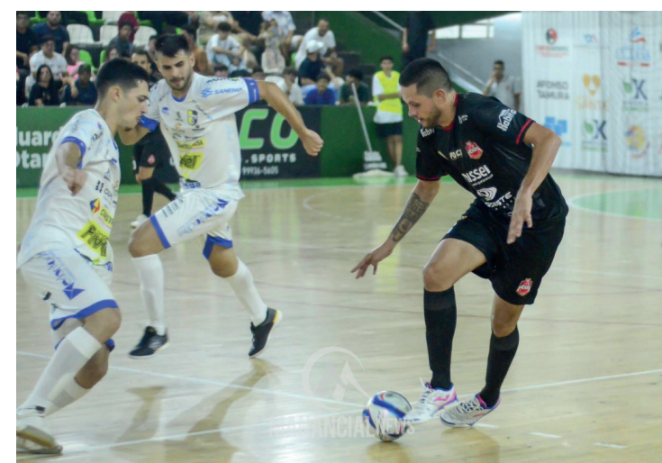
O time goioerense entra em quadra neste sábado para enfrentar o Ubiratã

Em nota, a direção da ADGG ressaltou que as dificuldades enfrentadas recentemente fortaleceram o grupo e reforçou que o apoio da torcida será fundamental para o sucesso nos próximos desafios.