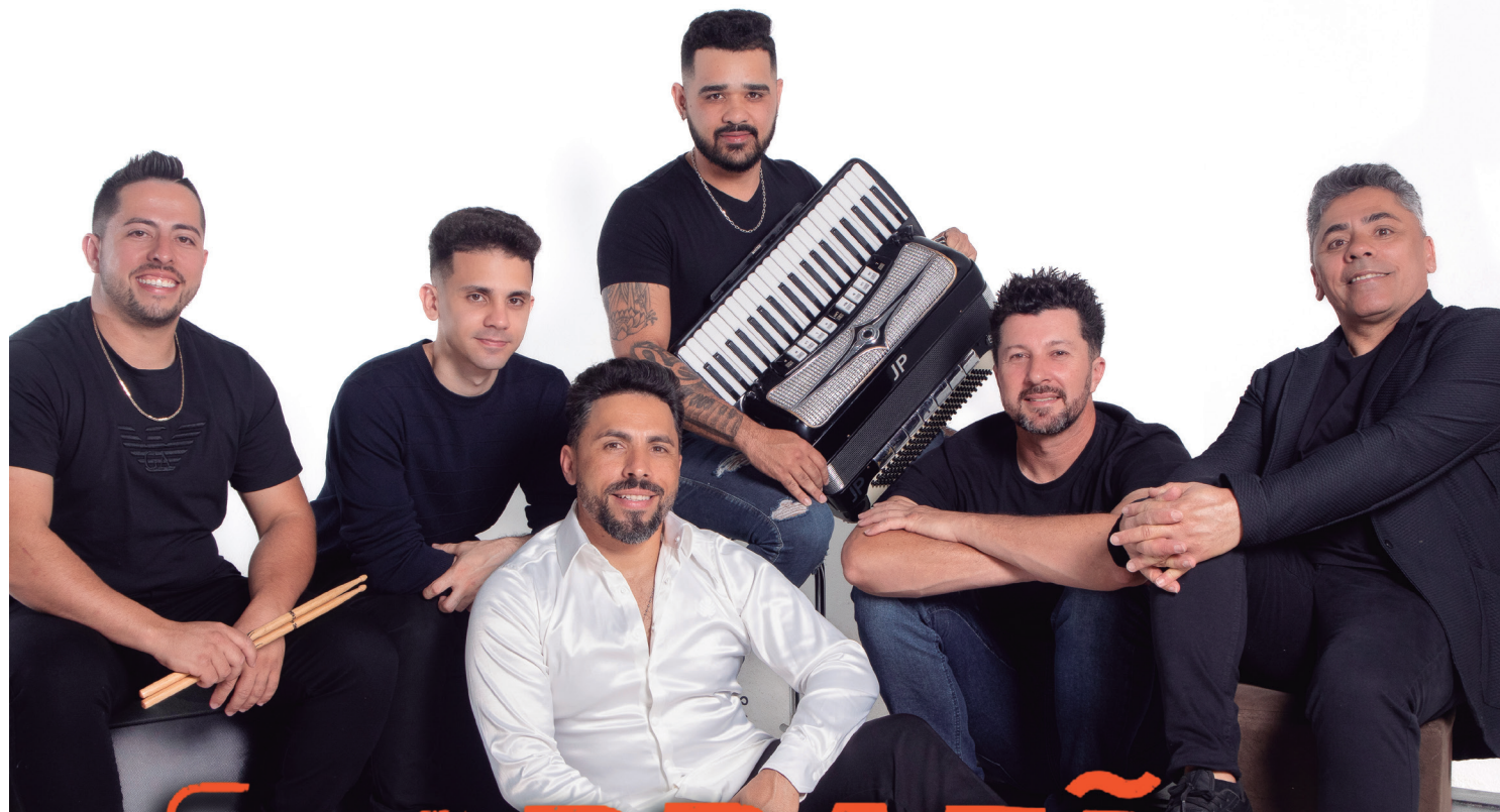
A Banda Garrafão é atração confirmada para a cavalgada que acontece no próximo dia 19 em Janiópolis

A programação começa no sábado, dia 18, com a recepção dos participantes no Parque de Exposições. No domingo, a partir das 7h, será servido o café da manhã, seguido pela saída da cavalgada às 9h, em um percurso de aproximadamente 12 quilômetros, passando por belas paisagens rurais.