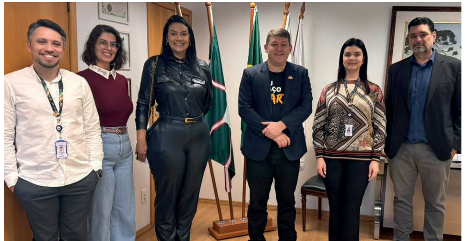
A Prefeitura de Goioerê está acompanhando de perto todo o processo que visa a implantação de uma Unidade Integrada do Sesc-Senac na cidade

A Prefeitura de Goioerê está acompanhando de perto todo o processo que visa a implantação de uma Unidade Integrada do Sesc-Senac na cidade.