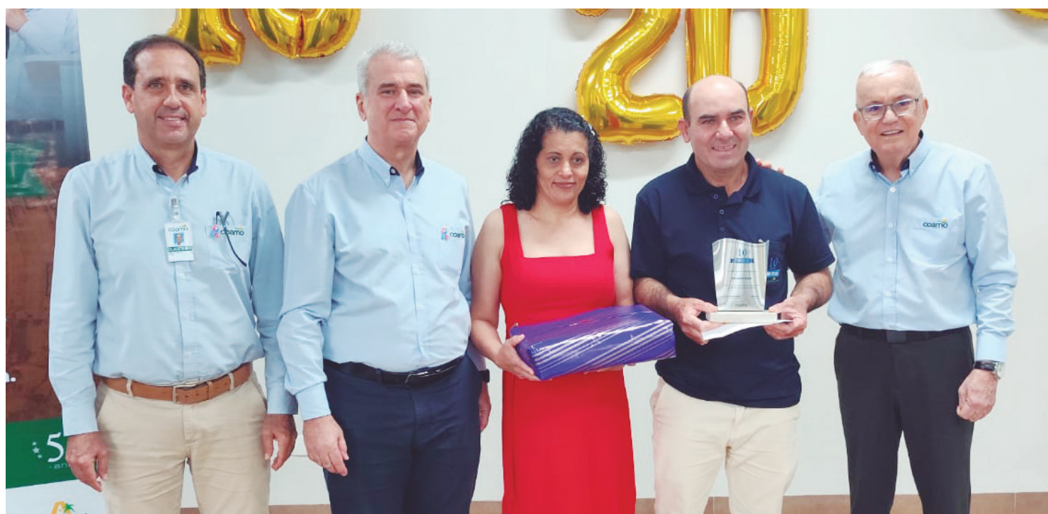
O evento de homenagem aos funcionários da Coamo foi realizado na última terça-feira em Goioerê