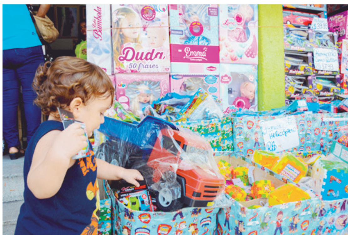
O Dia das Crianças já está movimentando o comércio de Goioerê

Em relação à preferência por brinquedos, a pesquisa mostra que ganhar brin-