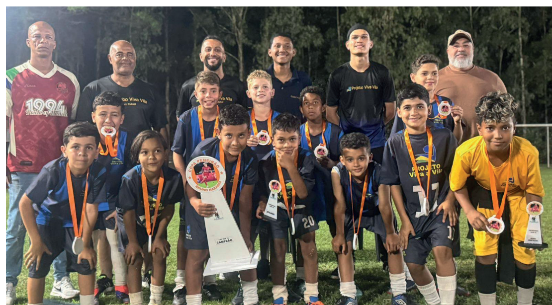
Os meninos do projeto Viva a Vila foram os grandes campeões