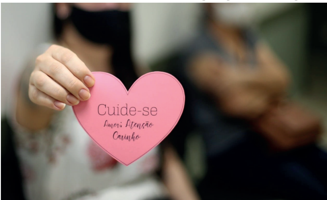
A Campanha Outubro Rosa ganha força em Goioerê

Entre outras ações, a Saúde de Goioerê tem promovido atividades educativas, orientações e coletas de preventivos. A campanha segue durante todo este mês.