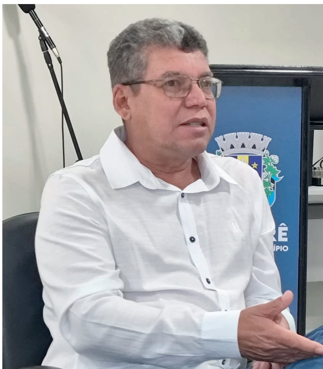
O vice-prefeito e líder da equipe de intervenção ‘Brito da Saúde’: Prestação de contas nesta quinta-feira

pe de intervenção deverá destacar as principais ações implementadas nesse período de 30 dias, que segundo consta, foi com foco na reorganização administrativa e no reequilíbrio financeiro da entidade. “Vamos mostrar o que foi feito até agora e o que poderá ser feito daqui pra frente”, diz o vice-prefeito ‘Brito da Saúde’.