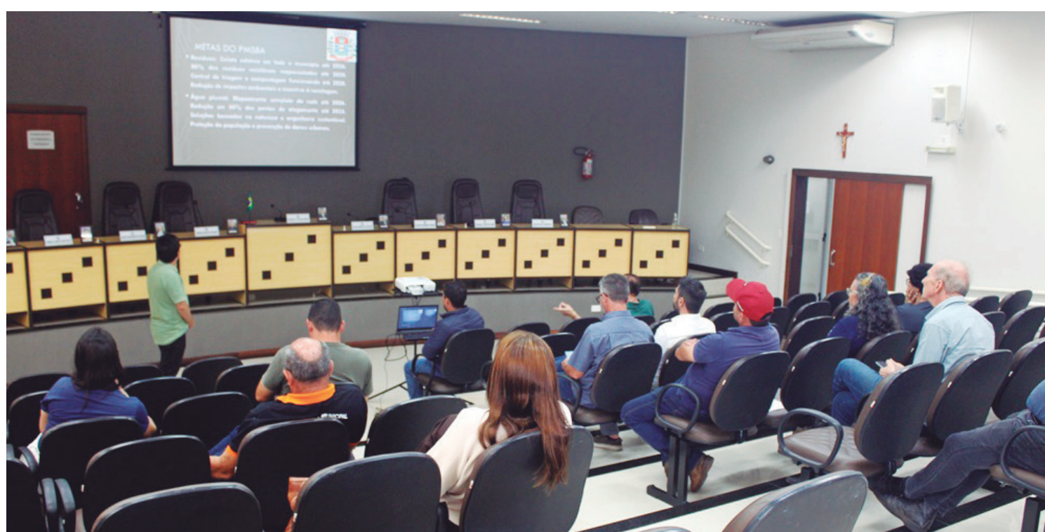
A audiência foi realizada no plenário da Câmara de Vereadores do município

cipal é o cumprimento adiantado dessas metas. Ademais, foi informado que a licitação para ampliação das redes já está em andamento, com apoio financeiro da Sanepar e execução pela Prefeitura.