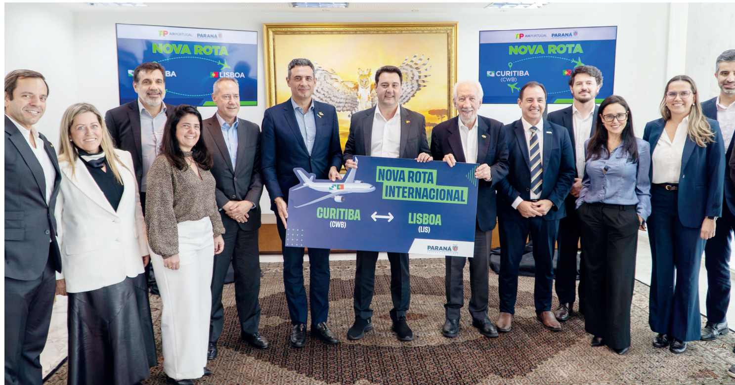
O governador Carlos Massa Ratinho Junior e diretores da TAP Air Portugal anunciaram nesta segunda-feira (3) a criação da rota

O novo serviço internacional representa um marco histórico para o turismo e os negócios no Estado, o que promete ampliar o fluxo de turistas