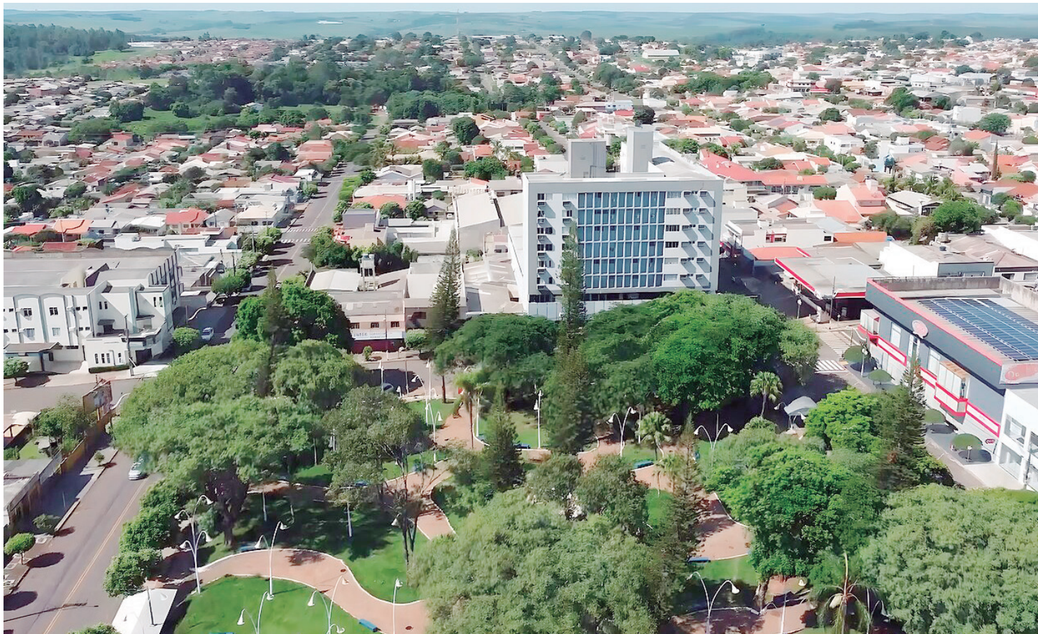
A cidade de Goioerê segue figurando nas primeiras colocações do ranking regional de geração de emprego