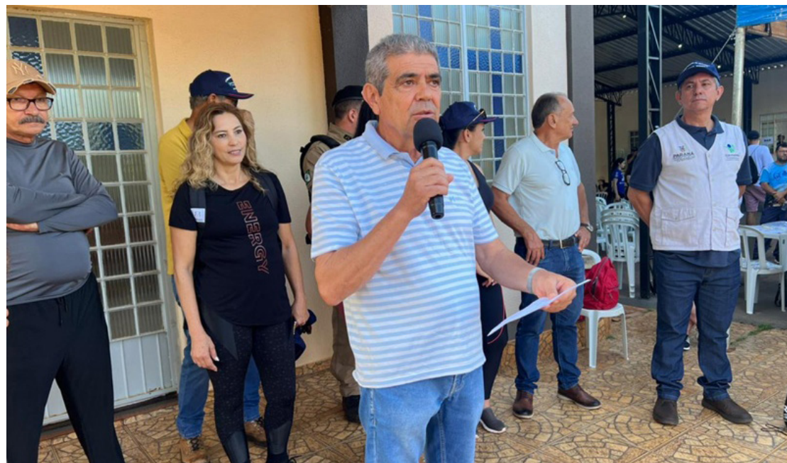
O prefeito Eides Guedes fala durante a abertura da programação da caminhada na natureza

Pátio e demais secretarias que se empenharam para deixar tudo pronto, bem como a Casa das Fraldas e lideranças da Comunidade do Graminha.