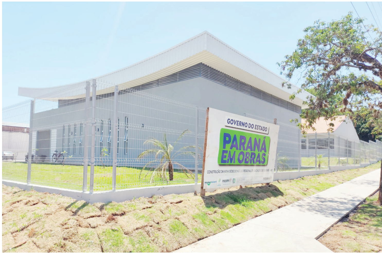
O prédio que vai abrigar a sede do Núcleo Regional de Educação de Goioerê está sendo finalizado

Ela cita que com o novo prédio, a população que precisa dos serviços do Núcleo de Educação e também os servidores, terão um local com mais conforto e funcionalidade. No total nove municípios são atendidos