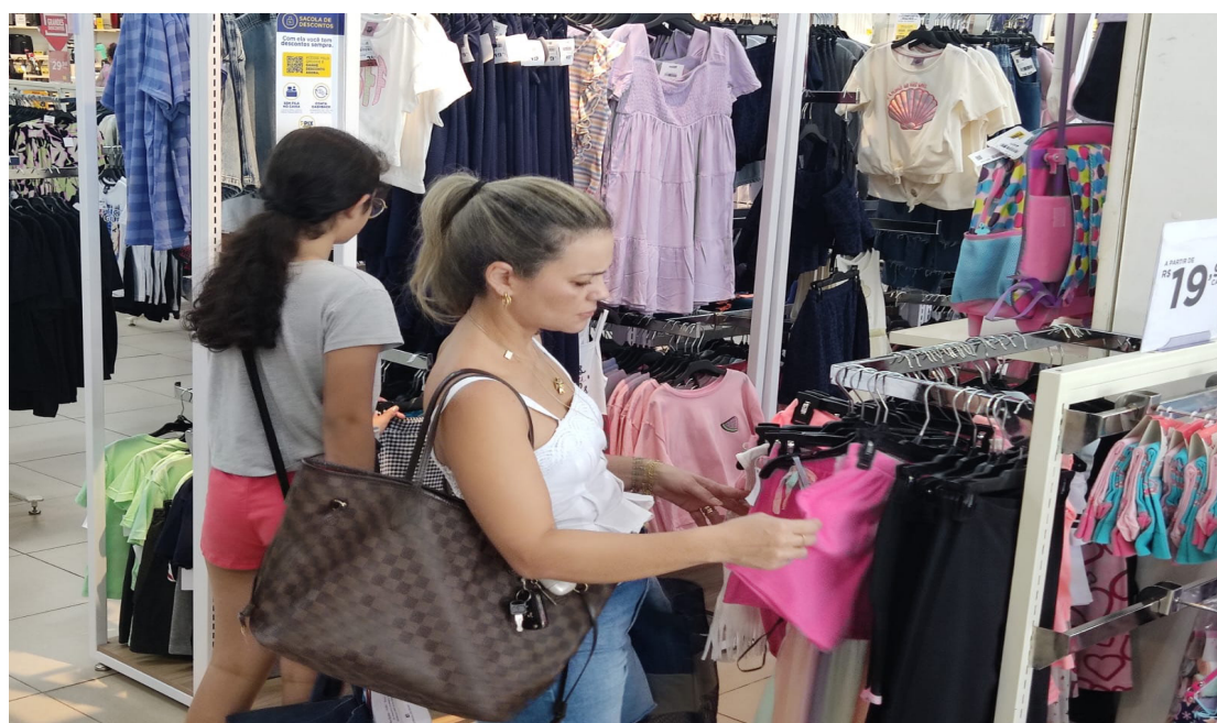
A abertura do comércio em horário especial começa no dia 16 de dezembro

LUZES DO NATAL: - Para estimular o clima natalino e colaborar com o aumento das vendas, a prefeitura de Goioerê anunciou que as luzes de