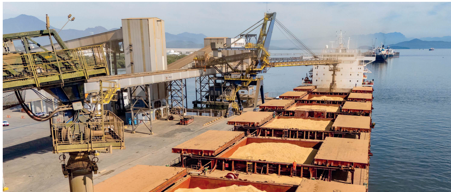
Porto de Paranaguá ultrapassa 13 milhões de toneladas de soja exportadas entre janeiro e outubro, sendo 91% da soja destinada à China

do aumento da exportação de soja estão a produção recorde da safra brasileira e a alta demanda chinesa, que praticamente parou de importar o produto dos Estados Unidos após os embates tarifários.