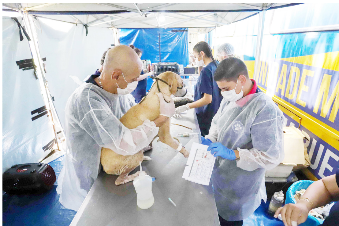
As castrações serão realizadas em Goioerê no dia 29 de abril de 2026

O programa é dos mais interessantes e relaciona a saúde ambiental, animal e humana por meio do controle populacional de cães e gatos através da esterilização, prevenção de zoonoses e ações de educação