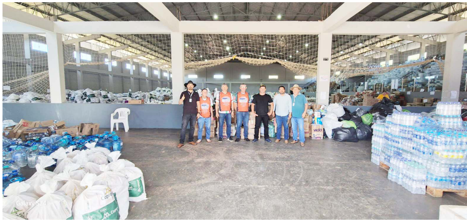
Os produtos arrecadados foram enviados para as famílias atingidas em Rio Bonito do Iguaçu

Comovida pela tragédia, a Prefeitura Municipal de Moreira Sales, através da Secretaria de Assistência Social, organizou uma ampla campanha de arrecadação em parceria com a Câmara de Vereadores, escolas, entidades,