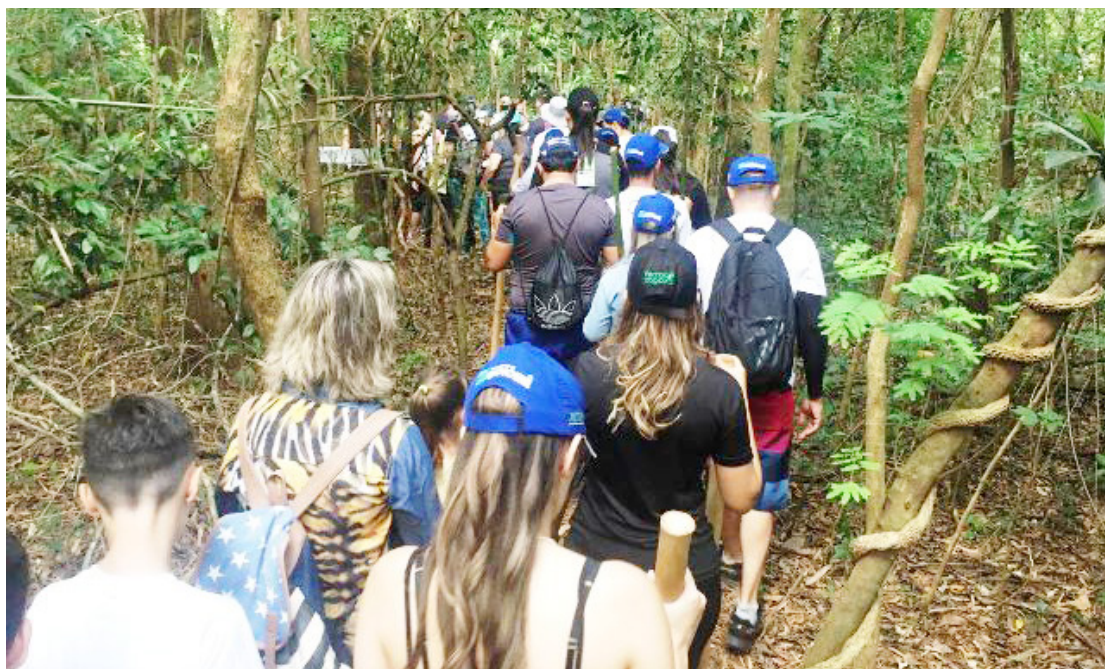
Acontece neste domingo (7) em Goioerê, a 8ª edição da Caminhada na Natureza, denominada de Circuito Água Branca do Cascalho

Segundo os organizadores, os participantes poderão apreciar paisagens campestres, áreas de mata preservada, trilhas sombreadas, riachos, cachoeiras, além de diversos elementos da fauna e flora local. A atividade integra o calendário regional de turismo rural e se consolida como um dos eventos mais aguardados do ano em Goioerê.