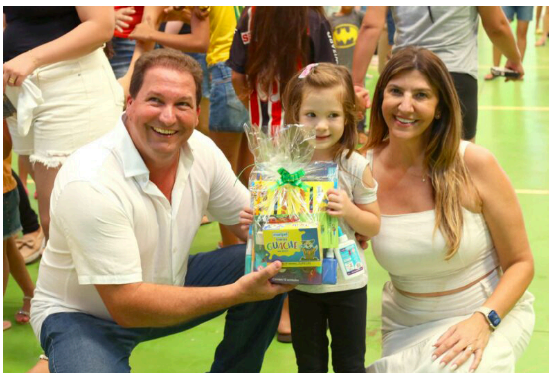
No início deste ano a prefeitura também fez a distribuição dos materiais escolares

Para os alunos da Educação Infantil (4 e 5 anos), o kit será composto por 2 colas coloridas atóxicas; 1 caderno de desenho