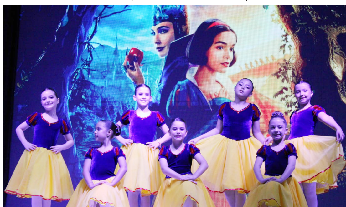
Espectáculo foi apresentado na última semana em Goioerê

A expectativa já começa a crescer para os próximos projetos, com a promessa de continuar encantando e inspirando através da dança.