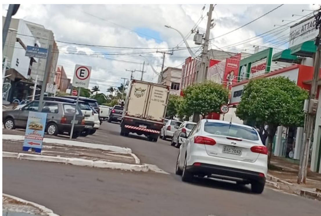
Até o dia 6 de janeiro de 2026, caminhões e outros veículos de carga, estão proibidos de trafegarem pela Avenida Francisco Scarpari

Ele cita que caminhões e outros veículos de carga deverão utilizar rotas alternativas, que serão divulgadas ao longo dos próximos dias. “Essa é uma medida necessária para evitar riscos à popu-