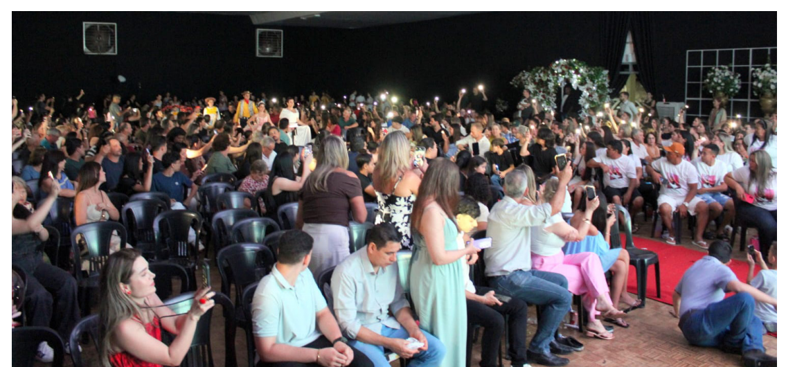
As apresentações encantaram o público que mais uma vez lotou o espaço da ACENG

A noite foi marcada por elegância e brilho, com figurinos deslumbrantes, iluminação cinematográfica e uma programação que celebrou não apenas a técnica, mas também a expressão artística de cada