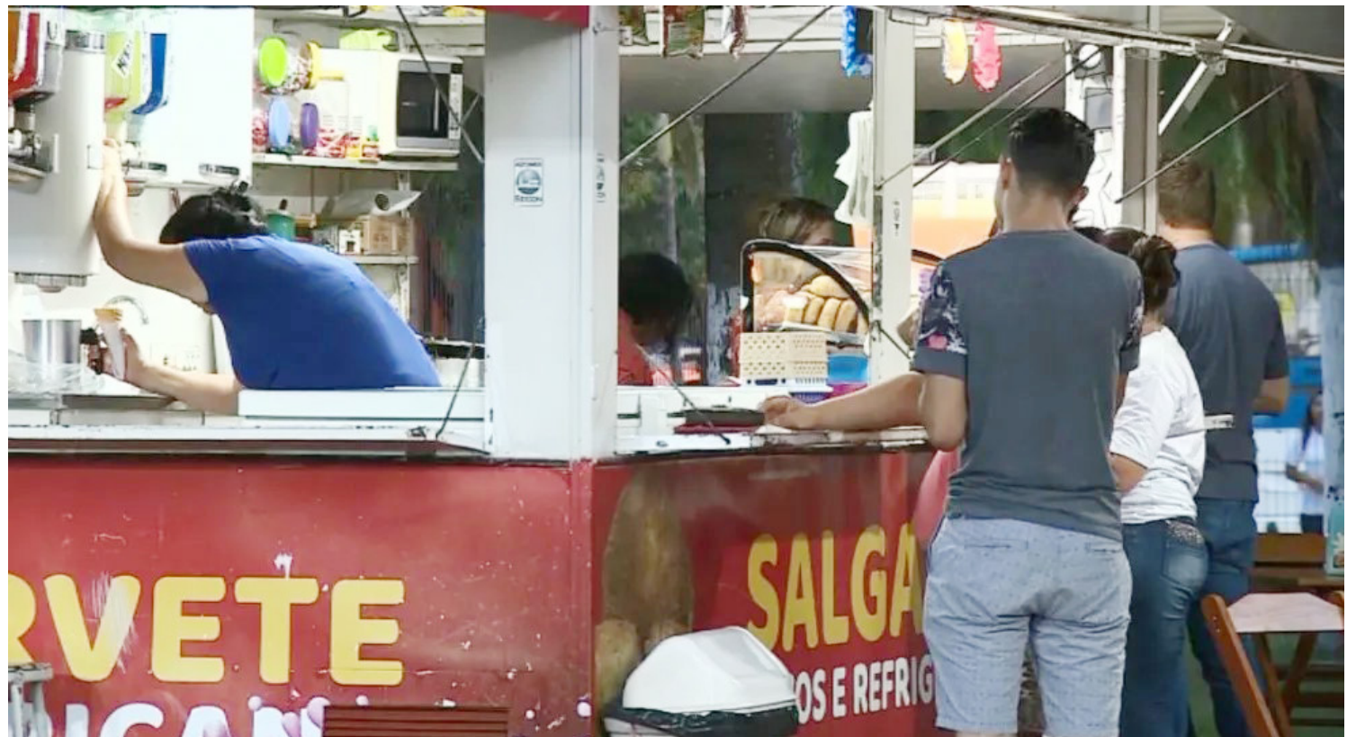
Decreto estabelece novas regras para funcionamento de ambulantes e trailers

Coluna publicada simultaneamente em 22 jornais e portais associados. Saiba mais em www.adipr.com.br