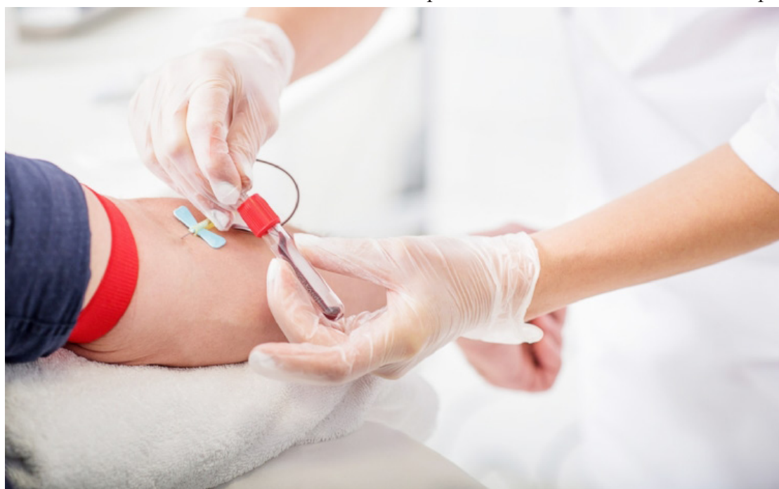
Os doadores serão levados para o Hemonúcleo de Campo Mourão

A campanha reafirma o compromisso de Goioerê com a promoção da saúde e o incentivo à solidariedade. Doar sangue é doar vida — e cada voluntário faz toda a diferença.