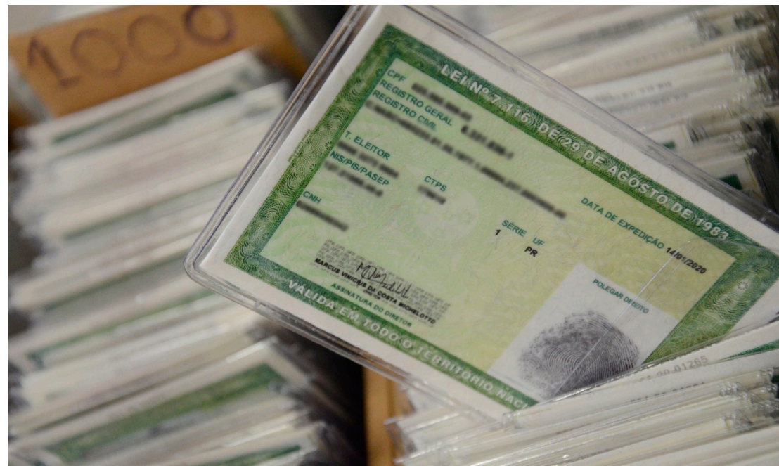
O setor de identificação está atendendo em horário diferenciado

O setor informa também, que após o dia 2 de fevereiro, o atendimento deverá ser retomado em seu horário habitual.