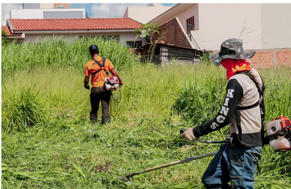
O alerta esta sendo feito para todos os proprietários de imóveis da cidade e chuvas de verão, que acabam promovendo a proliferação do mosquito transmissor da dengue. A colaboração de todos é muito importante para que a cidade não enfrente uma epidemia da doença. (foto ilustrativa).

O alerta municipal é importante, especialmente por conta do período de temperaturas elevadas