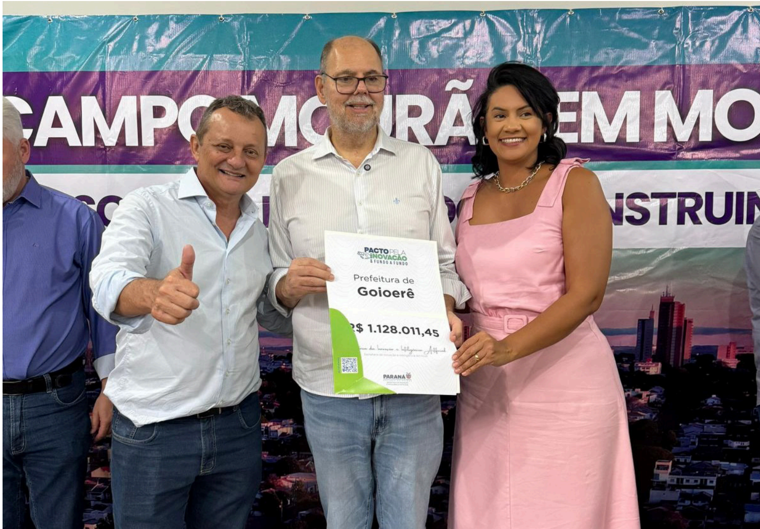
Pela primeira vez Goioerê foi contemplado com recursos para a implementação de novos espaços

Pela primeira vez, Goioerê foi contemplada com um investimento no valor de R$ 1.128.011,45, recurso que será destinado à construção, instalação e implementação dos novos espaços. A iniciativa reforça o compromisso do município com a inovação, a qualificação educacional