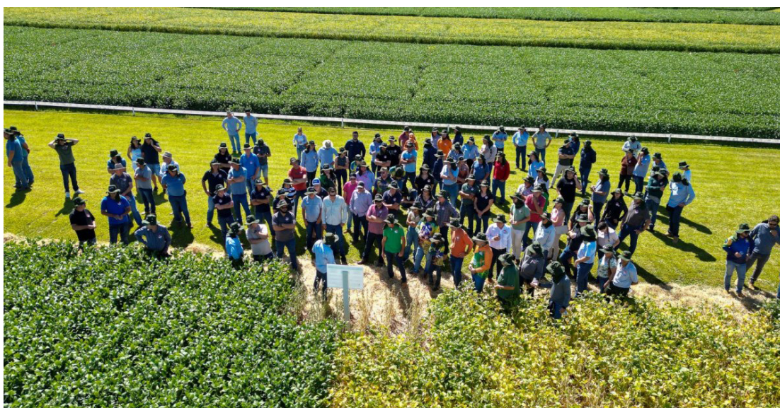
o 35º Dia de Campo de Verão Copacol apresentou estudos exclusivos realizados pelo CPA, e contou com a participação de 1,5 mil visitantes

Além da presença dos cooperados e cooperadas, colaboradores e pesquisadores do CPA, o secretário de Agricultura e Abastecimento do Paraná, Márcio Nunes, também prestigiou o evento. “A Copacol é uma das cooperativas mais importantes do mundo com produtos exportados para muitos países. E ela faz um trabalho sensacional com os produtores, um exemplo é esse Dia de Campo. A Copacol treina, adapta e coloca o produtor em situações de competitividade, tudo isso visando a melhoria da qualidade de vida através do aumento da renda do produtor, estimulando que as famílias fiquem no campo”, completa o secretário.