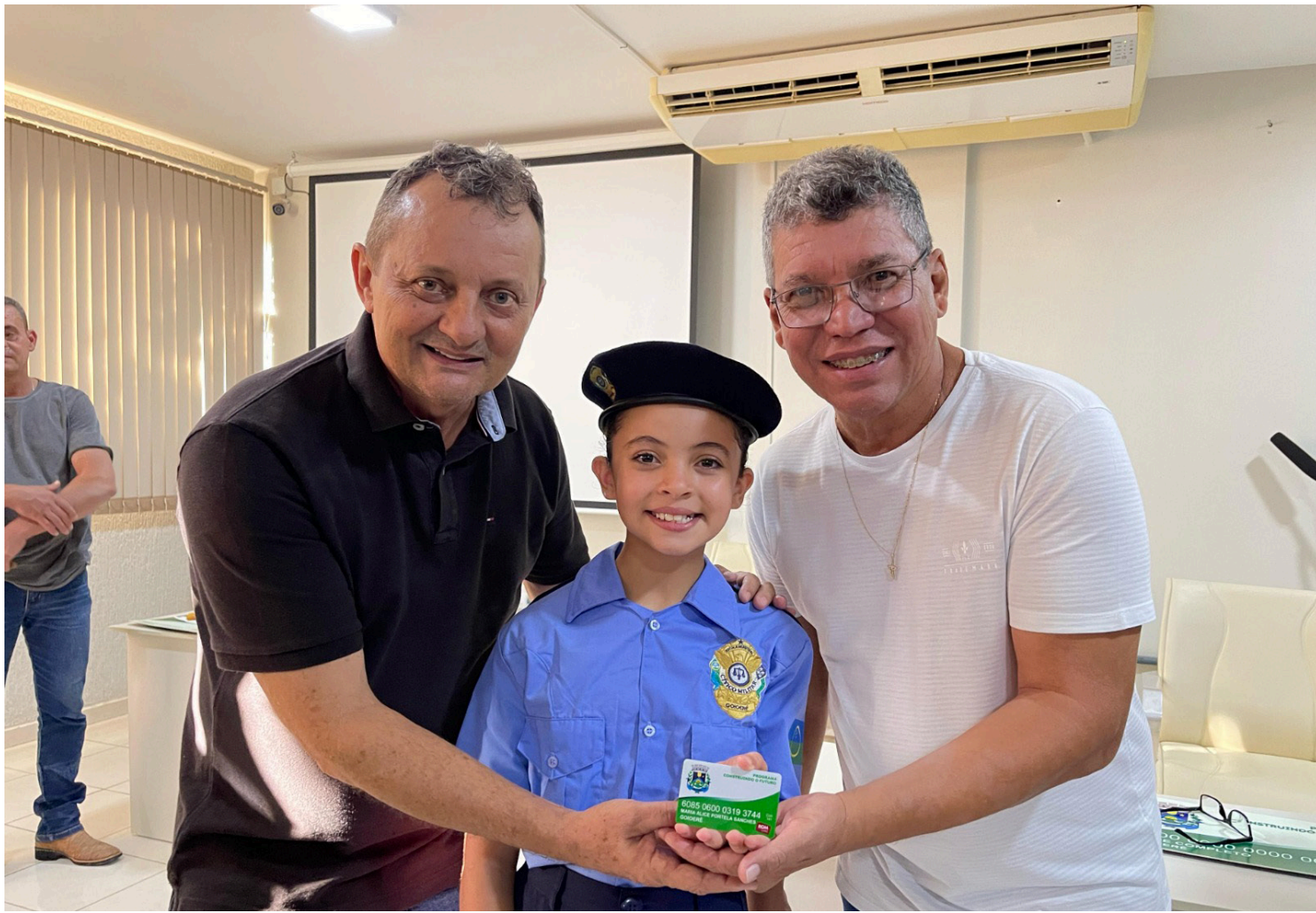
Todos os alunos da Rede Municipal de Ensino serão contemplados com o cartão

Segundo a Secretaria de Educação, o edital tem como objetivo ampliar a rede de estabelecimentos credenciados, garantindo aos estudantes da rede pública municipal e suas famílias a livre escolha dos fornecedores, ao mesmo tempo em que fortalece o comércio local e assegura transparência na aplicação