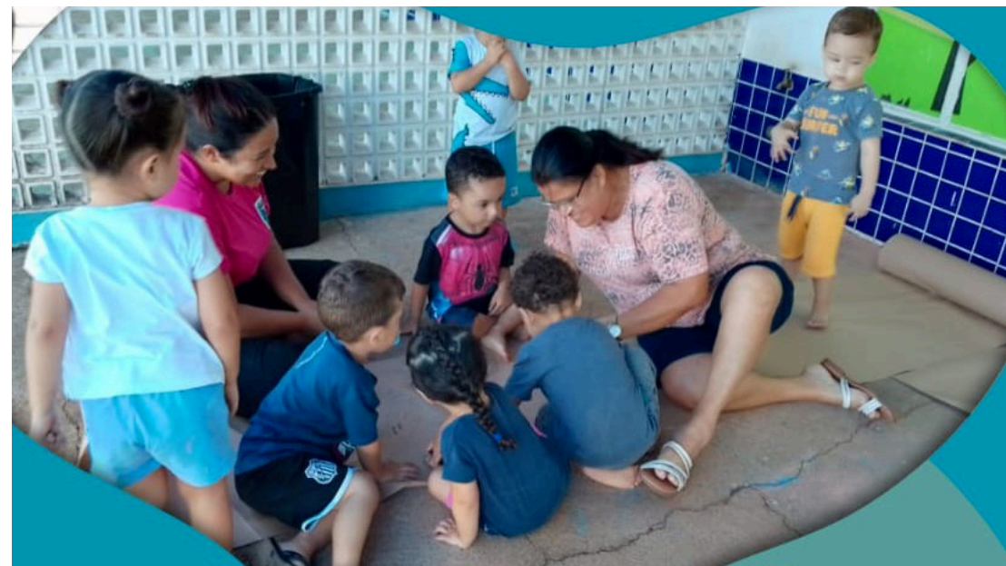
rede municipal passa por melhorias durante o período de férias

Cuidar da infraestrutura e oferecer apoio às famílias é investir em uma educação pública de qualidade.