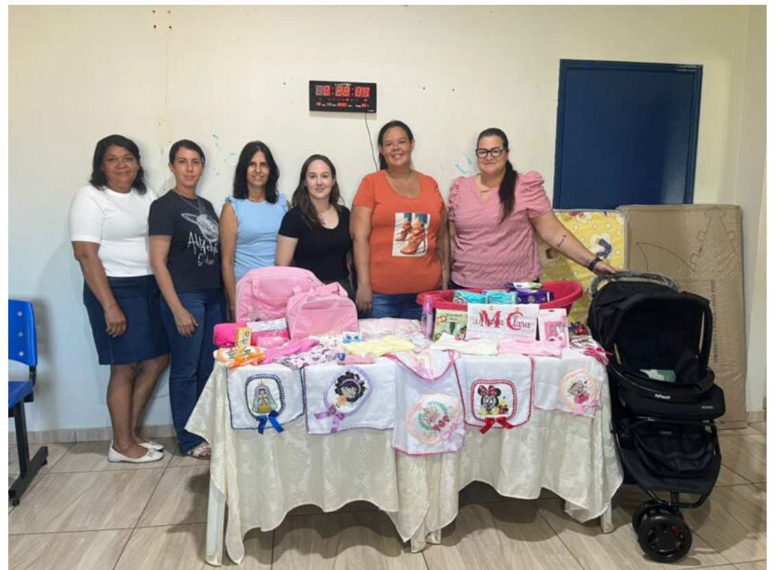
O projeto AMAR é uma espécie de política pública da cidade: apoio às gestantes

O Projeto AMAR é voltado para gestantes em situação de vulnerabilidade social, garantindo uma gravidez saudável e suporte completo às famílias. Ele faz parte da oferta integrada dos serviços