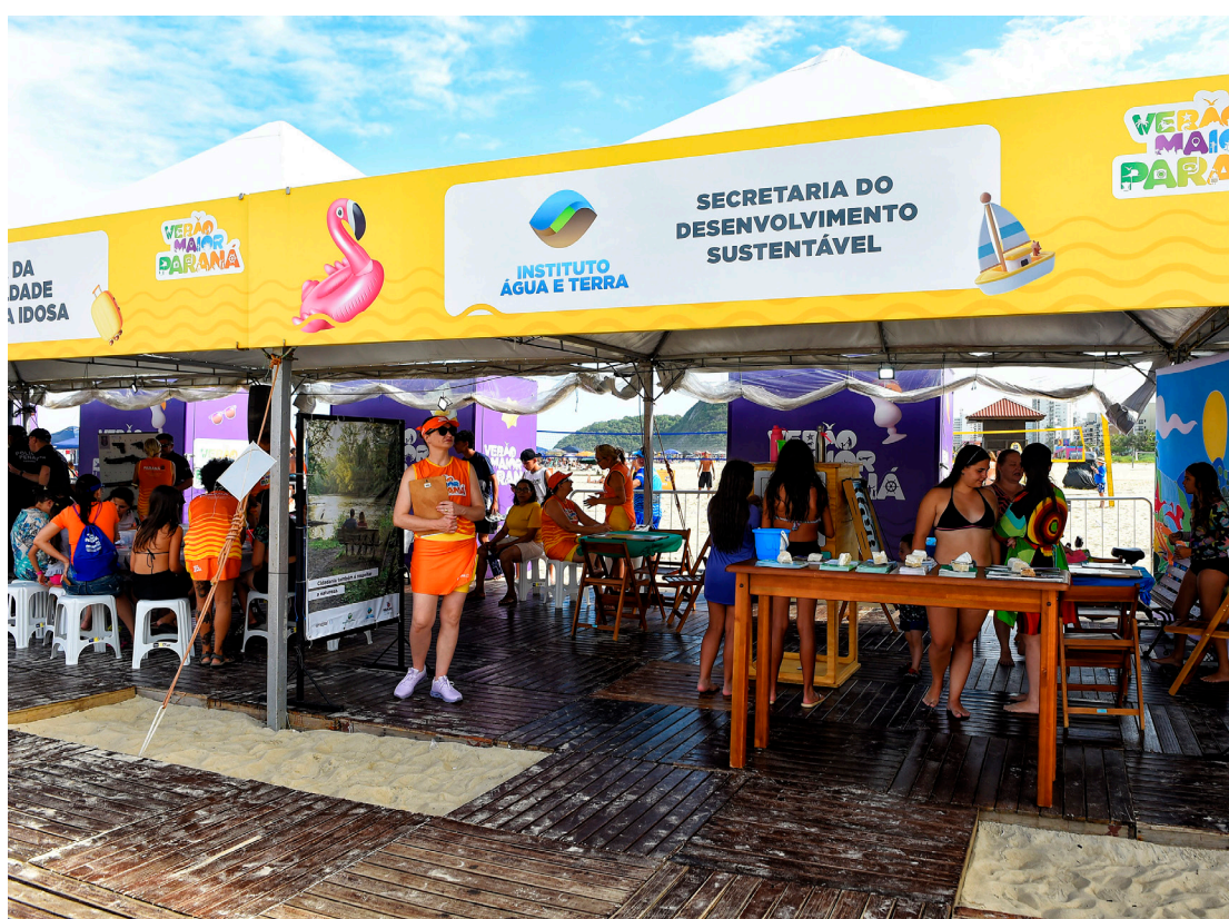
Segundo o boletim do Instituto Água e Terra (IAT), foram 24.390 atendimentos em quatro semanas de temporada – 15.796 pessoas no Litoral e 8.594 no interior

ocorrem nas arenas oficiais do órgão em Pontal do Paraná, no balneário de Shangri-lá, e em Matinhos, na praia de Caiobá, e inclui jogos, brincadeiras e atividades educativas seguindo cinco eixos temáticos de diferentes aspectos ambientais que mudam semanalmente. São realizadas também gincanas de palco, que buscam aguçar a curiosidade e despertar o senso de responsabilidade ambiental.