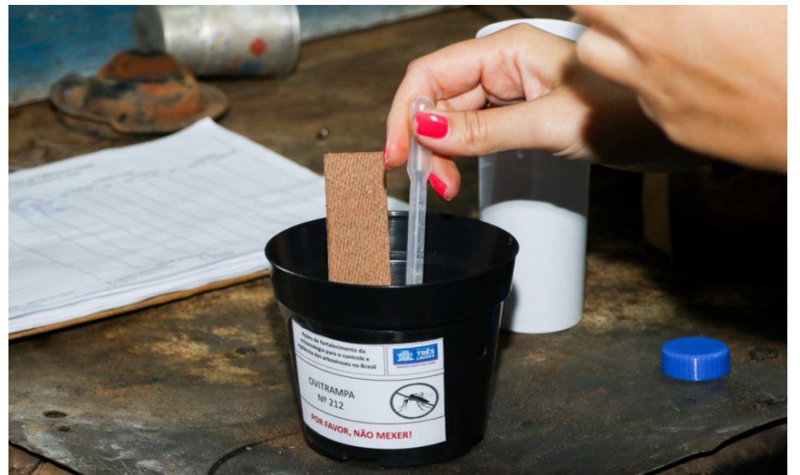
O combate à dengue tem sido intensificado em Goioerê

Segundo a Secretaria de Saúde, o número ele-