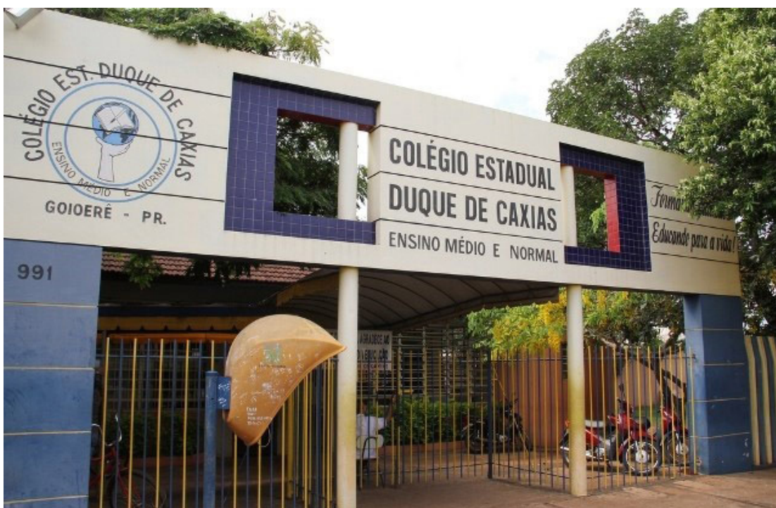
As matrículas estão abertas e os interessados deverão comparecer na secretaria do colégio

considerado um dos mais modernos em se tratando de tecnologia, pois acaba de adquirir 41 compu-