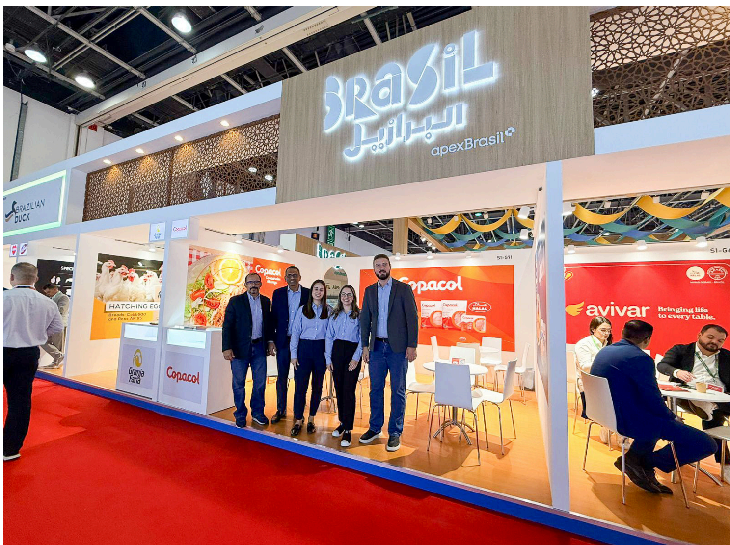
A Copacol marca presença na Gulfood 2026, uma das maiores feiras de alimentos do mundo, realizada em Dubai, nos Emirados Árabes Unidos

Tradicional participante da feira, a Copacol apresenta ao público internacional um portfólio de produtos desenvolvidos especialmente para atender às preferências e exigências dos consumidores da região. “O Oriente Médio representa um mercado estratégico para a avicultura brasileira, reconhecida mundialmente por seus elevados padrões de segurança de alimentos. A participação da Copacol na Gulfood é fundamental para ampliar a visibilidade dos nossos produtos, agregar valor às exportações e impulsionar o desenvolvimento no campo, com impacto direto na geração de empregos nas cidades ligadas à atividade. Estar presente em uma feira dessa magnitude reforça o orgulho de ver a marca Copacol consolidada em 85 países, escolhida por consumidores que confiam na qualidade e na credibilidade do que produzimos”,