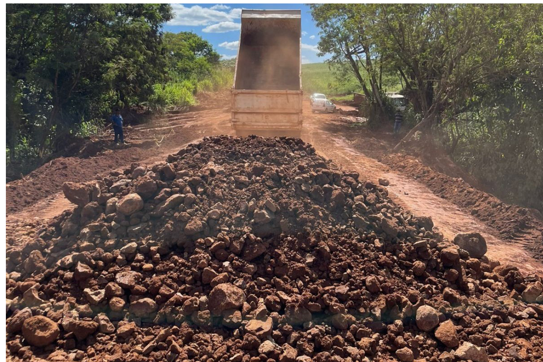
Os serviços estão sendo realizados pela prefeitura da cidade

De acordo com a administração municipal, os investimentos refletem o empenho em melhorar o acesso às comunidades rurais, fortalecer o escoamento da produção agrícola e proporcionar mais segurança e qualidade de vida aos moradores e a todos que utilizam a Estrada do Palmital.