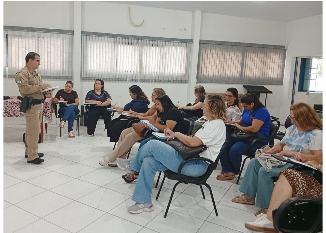
A reunião contou com a participação de coordenadores de escolas, diretoras e representantes da Polícia Militar

O Proerd é uma iniciativa voltada à prevenção do uso de drogas e ao combate à violência, promovendo valores como responsabilidade, respeito, cidadania e cultura de paz entre os