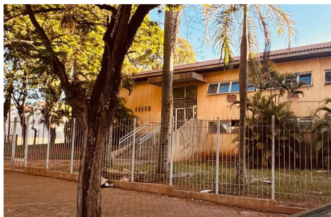
O novo local é estratégico para atendimento da população