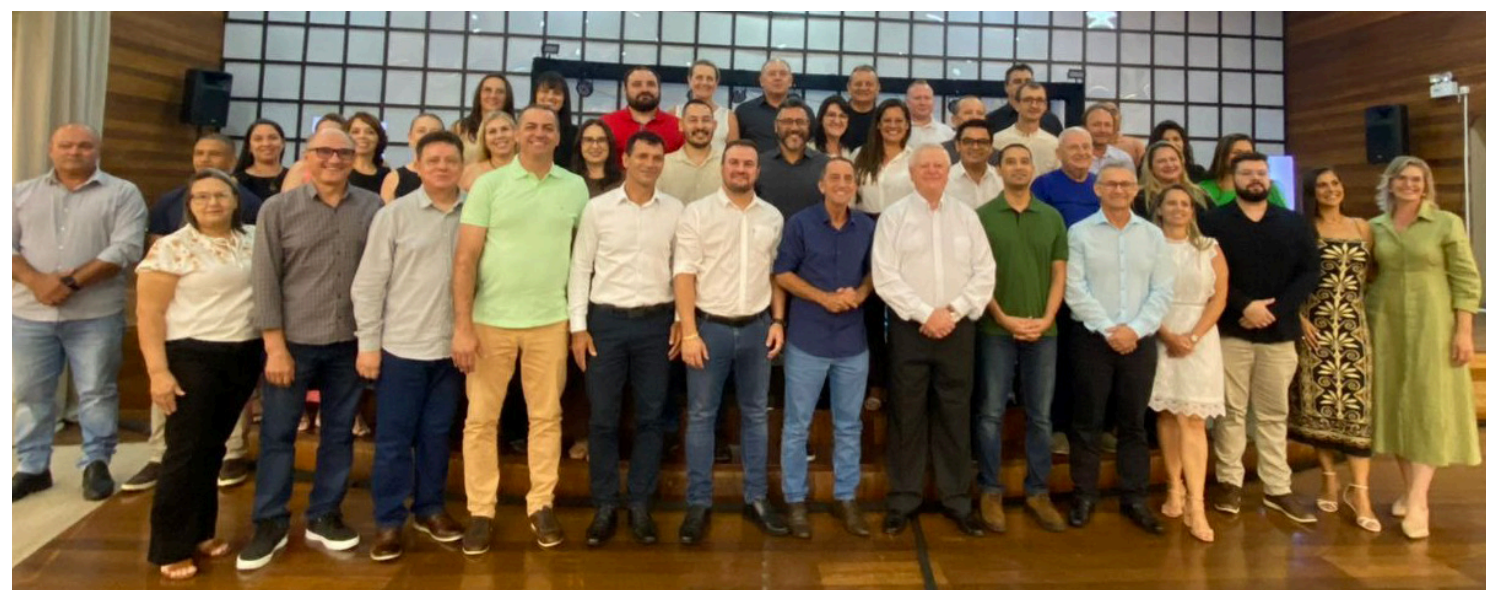
Ato em Cafelândia reforçou o compromisso regional com cultura, esporte e educação

balhando com seriedade para assegurar projetos que promovam inclusão, desenvolvimento e qualidade de vida para a comunidade.