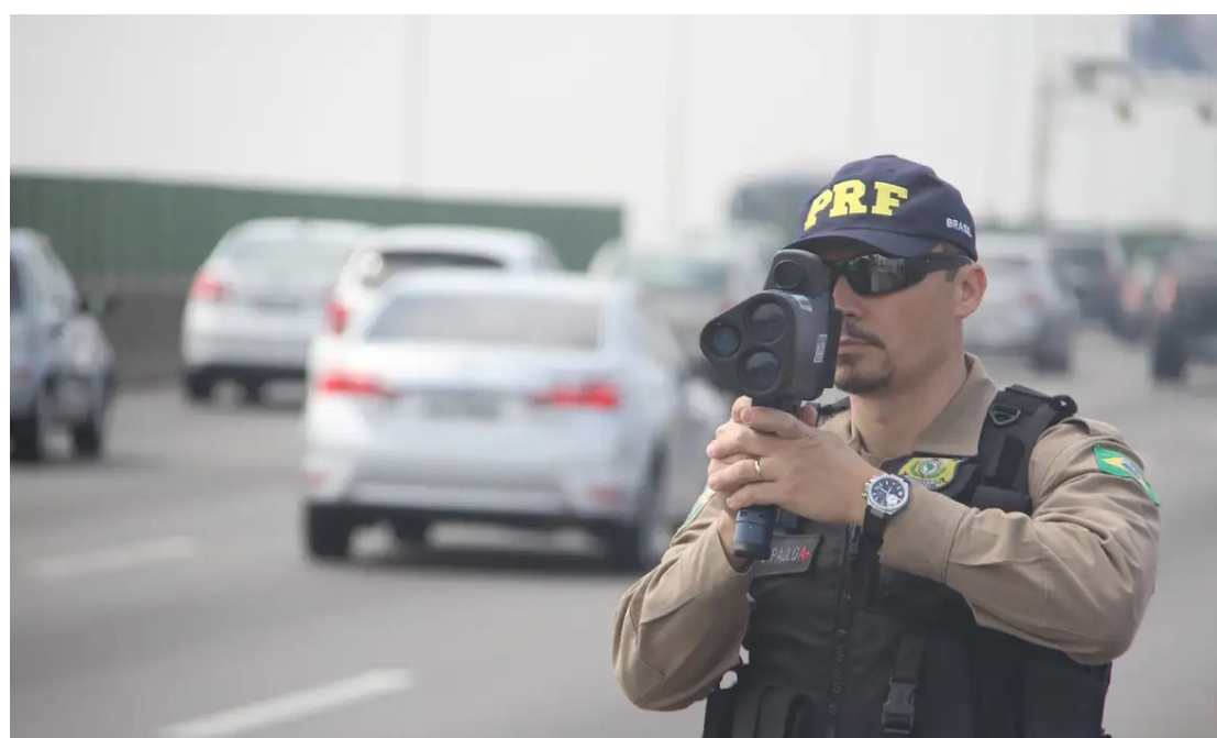
A operação começa nesta sexta-feira: fiscalização será intensificada nas rodovias

da Polícia Rodoviária Federal. É que, antes de pegar a estrada, os condutores devem verificar as condições do automóvel, com atenção especial aos itens de segurança, como freios, pneus e sinais de iluminação e sinalização. A viagem deve ser planejada para evitar longos períodos de condução sem paradas, com pausas para descanso, principalmente após quatro horas ao volante.