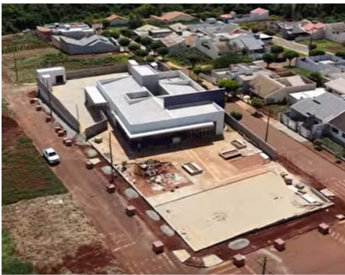
As obras estão com mais de 85% concluídas: conquista importante para a população

Segundo o prefeito, a nova unidade de saúde só virou realidade graças ao apoio do deputado federal licenciado e secretário de Estado da Saúde, Beto Preto. “Também quero agradecer ao governador