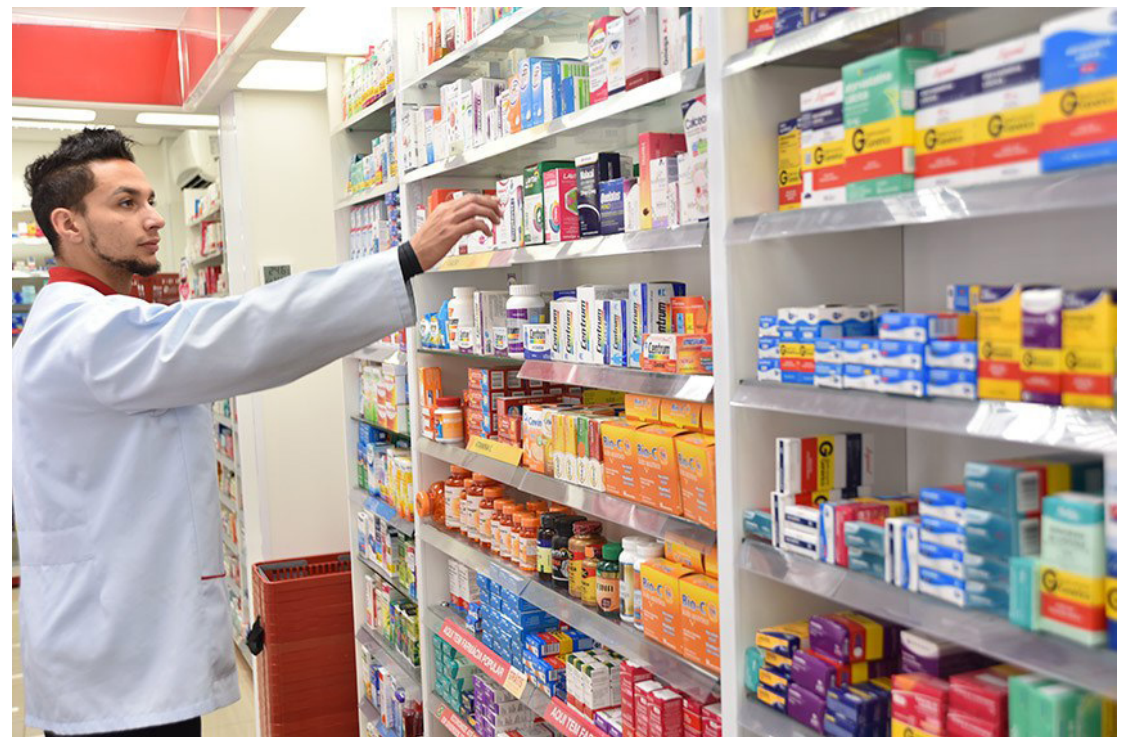
A partir de agora farmácias poderão ser implantadas dentro de supermercados

No caso de medicamentos sujeitos a controle especial, a legislação estabelece uma segurança adicional: a entrega ao consumidor só pode ocorrer após o pagamento ou, alternativamente, o produto deve ser transportado do balcão até o caixa