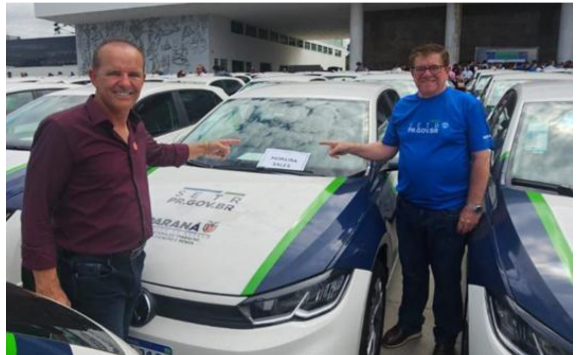
O veículo foi entregue nesta semana para a Agência do Trabalhador de Moreira Sales

Volpato, que tem acompanhado de perto as ações da Agência do Trabalhador no município, destacou a importância do investimento para melhorar a estrutura de trabalho e reforçar os serviços prestados à população.