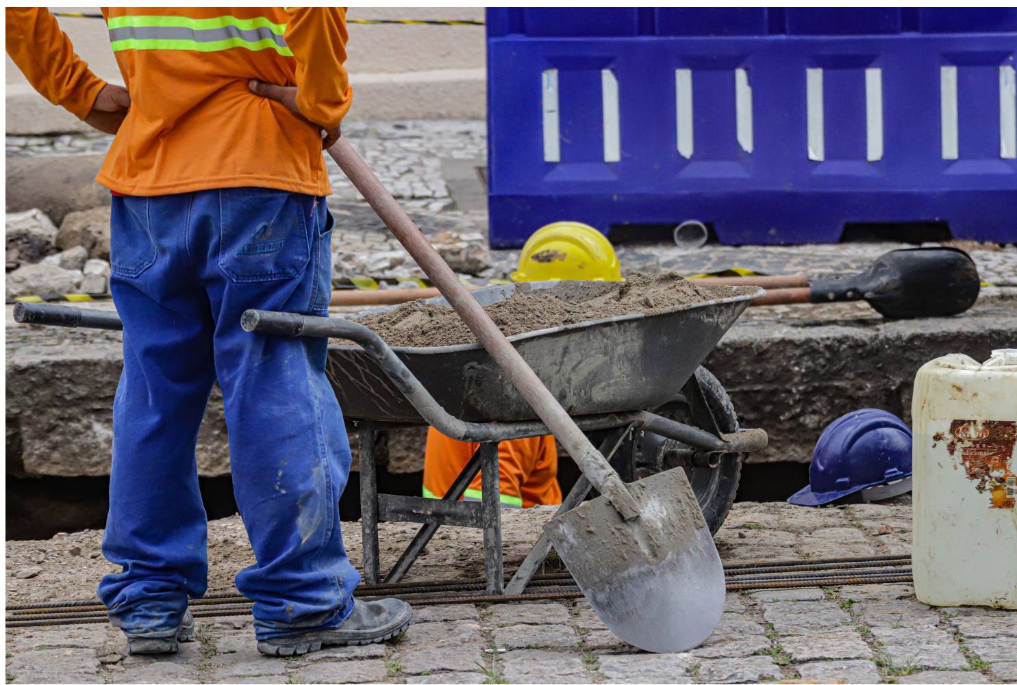
Acontece hoje o Mega Feirão de emprego em Goioerê

que para este evento, a prefeitura está contando com o apoio e parceria da Copacol, Fiação Goioerê e Frimesa. “São empresas parceiras, que absorvem muita mão de obra, gerando emprego e renda para as famílias da nossa cidade”, disse. O evento terá como local a Praça da Igreja Matriz, sendo realizado das 9h às 16h.